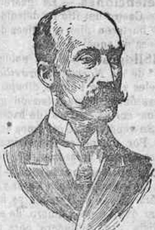
Lord Lansdowne, «leader» de los conservadores en la alta Cámara inglesa.

Y ante aquel cuadro emocional que tenía por fondo el lienzo gris de espesas nubes, sur-