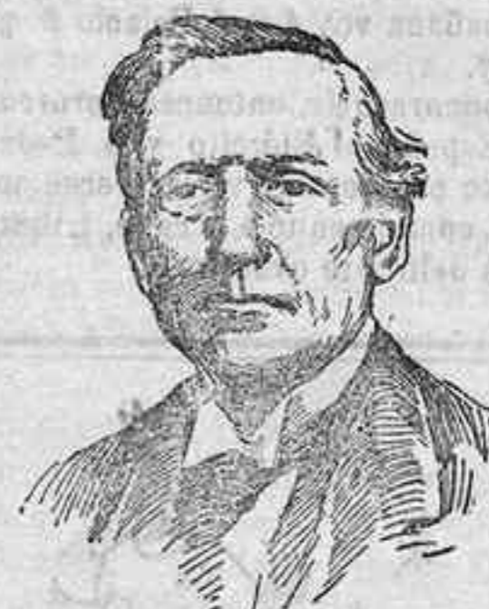
Mister Asquith, primer ministro del Gabinete inglés.

En caso contrario, al retirar su apoyo, le tributarán el homenaje debido á la lealtad y á la franqueza.