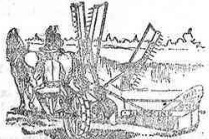
Segadora agavilladora DEERING

ARADOS Brabant MELOTTE y RUD-SACK. CULTIVADORES Planet.—GRADAS de muelle. SEMBRADORAS "San Bernardo", con cajón. DISTRIBUIDORA de abonos.—TRITURADORES de Grano— Abono y CORTA-FORRAJES.