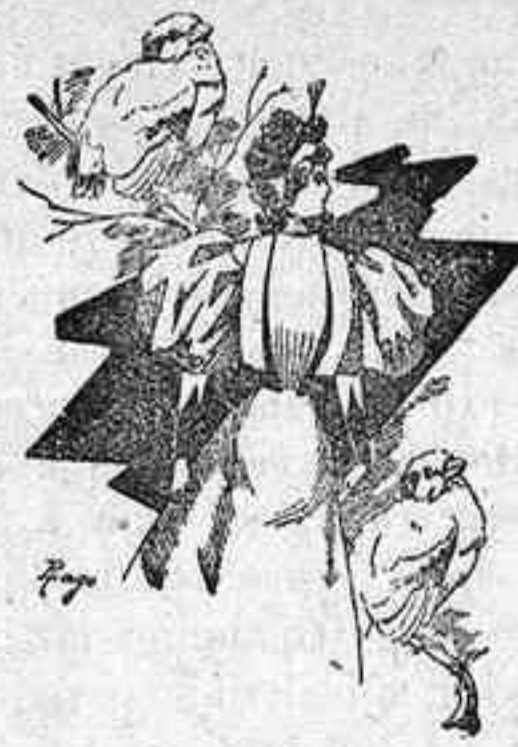
Traje para calle.

Falda forma capa , bordada con azabache. Un biés de terciopelo en el borde, color negro. Cuerpo y falda son de una pieza, abrochándose el primero por detrás con broches invisibles.