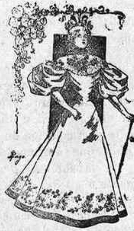
Traje para visita.

Como verán nuestras lectoras hoy tenemos el gusto de presentarles tres modelos completamente nuevos y del mejor gusto, y creemos firmemente que todos ellos han de ser de su agrado por no contener exageraciones, cosa rara hoy que se abusa tanto de ellas.