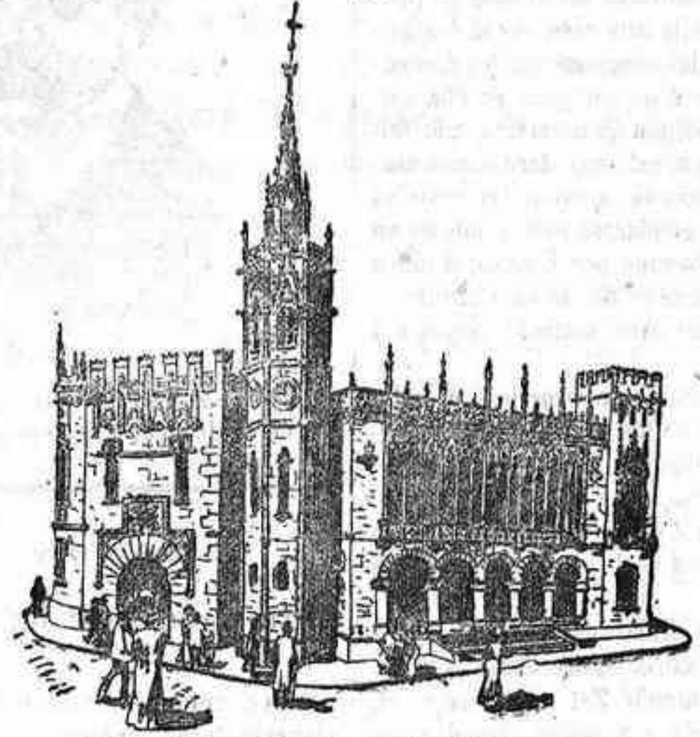
EL PALACIO MUNICIPAL

Este suntuoso edificio es obra que hace honor al arquitecto del Ayuntamiento de Valencia don Francisco Mors, quien, inspirándose en los monumentos de la ciudad, de estilo gótico florido, ha confeccionado una fábrica esbelta y hermosa y que llamará grandemente la atención.