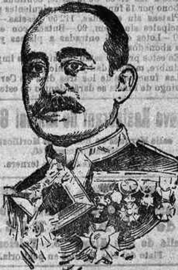
FIGURAS DE ACTUALIDAD.—El gobernador de Barcelona general don Ramón Aunón y Villalón.

Con el objeto de satisfacer la creciente demanda de ejemplares del DIARIO y para mayor comodidad del público, los números sobrantes de la tirada corriente quedan puestos a la venta en los kioscos de las Tendillas, la calle del Conde de Gondomar y la Estación, dejándose de expenderlos en la Administración de este periódico.