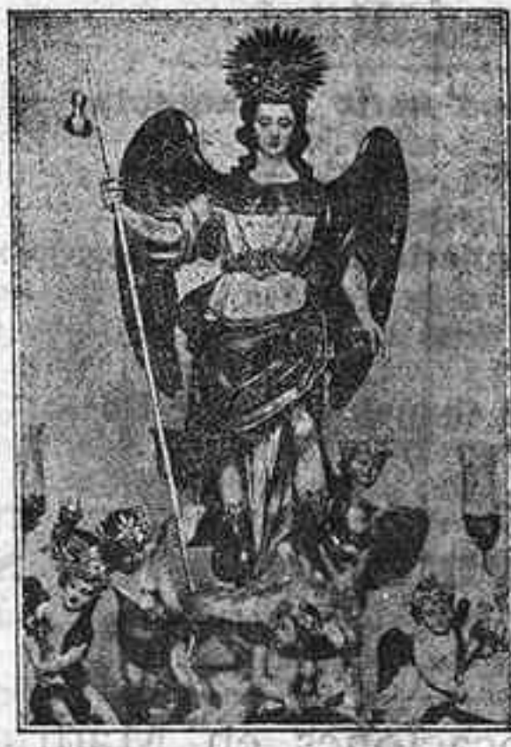
EL ARCANGEL SAN RAFAEL, Custodio de Córdoba

Ojalá que en el próximo curso sea insuficiente el local que la Escuela de Artes ocupa, para contener a todos los alumnos matriculados.