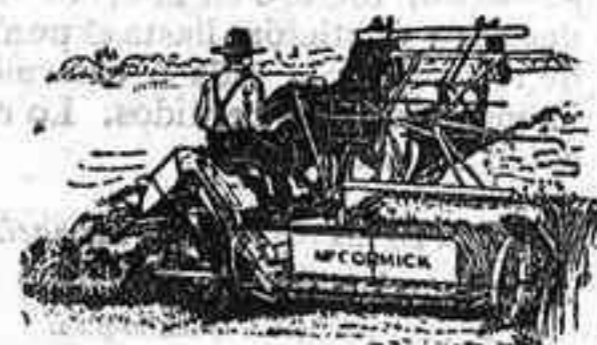
Atadoras Macormick — ULTIMA PERFECCION —