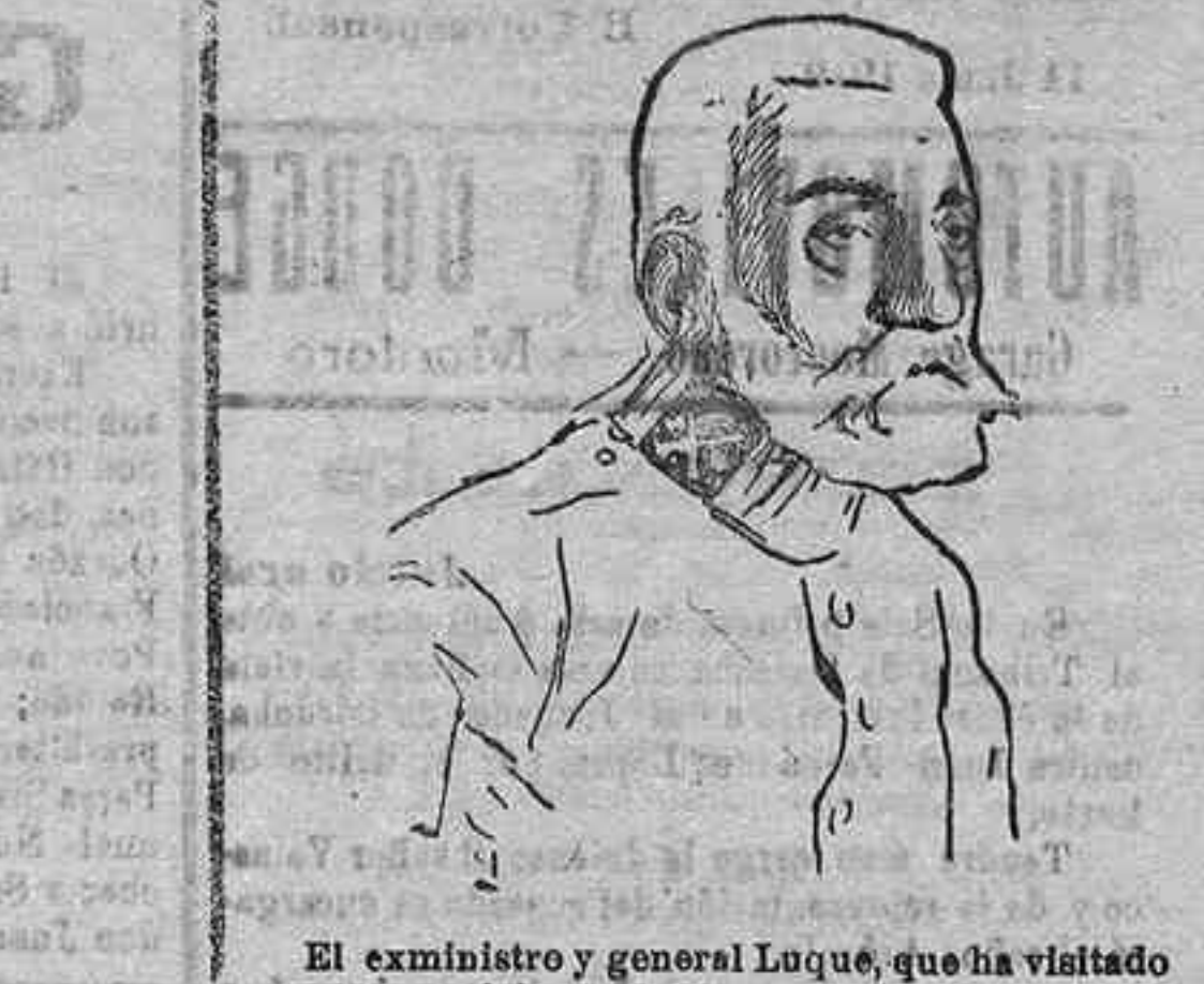
El exministro y general Luque, que ha visitado nuestras posiciones de Marruecos.