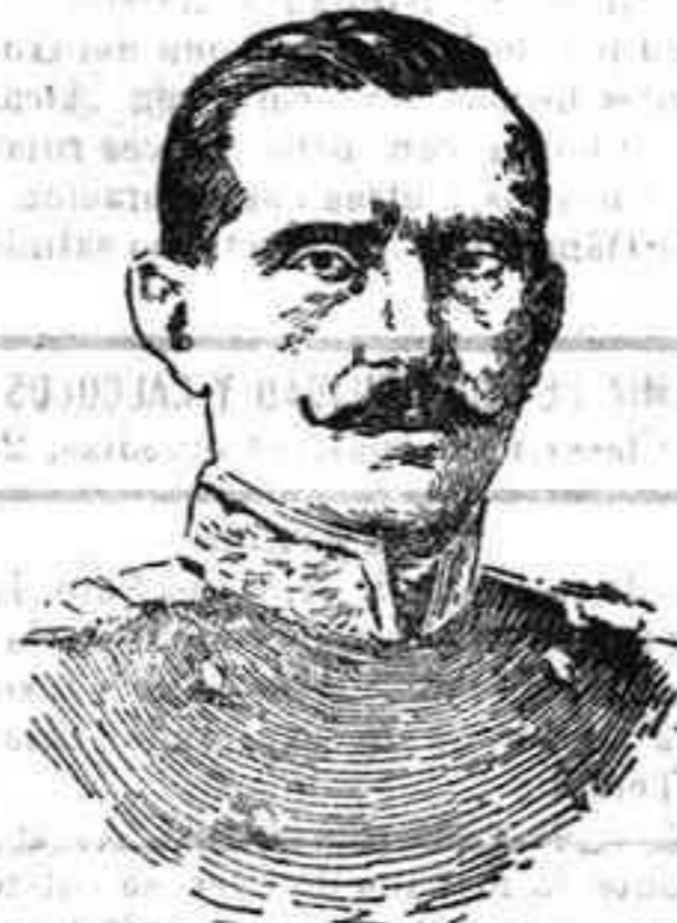
FIGURAS DE LA GUERRA.—El generalísimo búlgaro Jekon.

Los aliados, en tanto llegaba la oportunidad de llevar a él la acción, aguardaron a que se efectuase el levantamiento de las cosechas en la Moldavia y Valaquia, al parecer una de las condiciones impuestas por Rumania para intervenir al lado de aquellos, y también esperaron a que mejorase la temperatura en Macedonia, donde los fuertes calores estivales, aparte de lo inadecuado que hacen la estación para grandes operaciones de guerra, ocasionan verdaderas epidemias de paludismo, tifus y disenterias; así es que se consagraron a sus preparativos. El general Serrail era