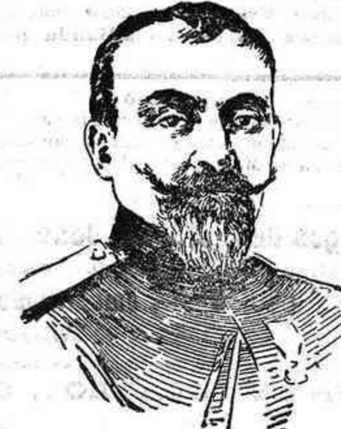
FIGURAS DE LA GUERRA.—El general Boiadjev, comandante en jefe del primer cuerpo de ejército búlgaro que opera en Servia.

Otra razón tenían los austrogermanos y búlgaros para precipitar las operaciones en el frente balcánico.