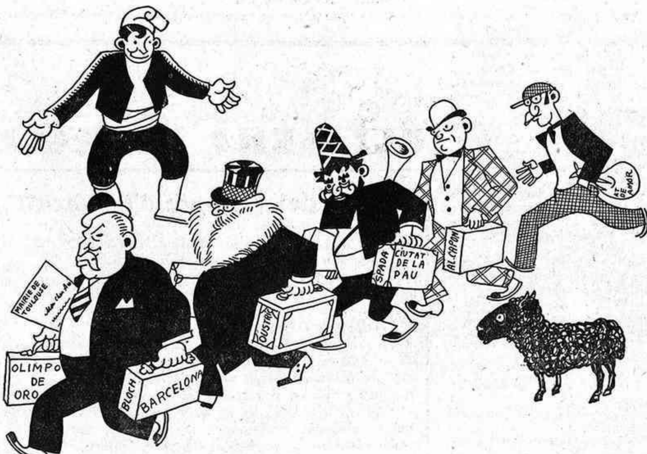
—I tots aquests els presenta en Fontbernat? —Ah! Així els haurem de rebre per cortesia.

EL BE NEGRE desmentiria la seva tradicional fama de serietat si no s'ajuntés, amb totes les seves forces, al clam dels que demanen una tan justa com merecudada recompensa per al co-negut caramellaire.