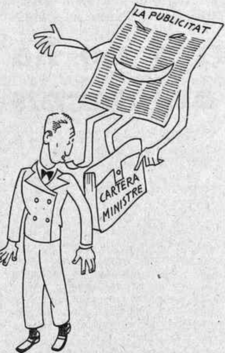
—Quins carteristes més fins! Encara no la tenia i ja me l'han birlada.