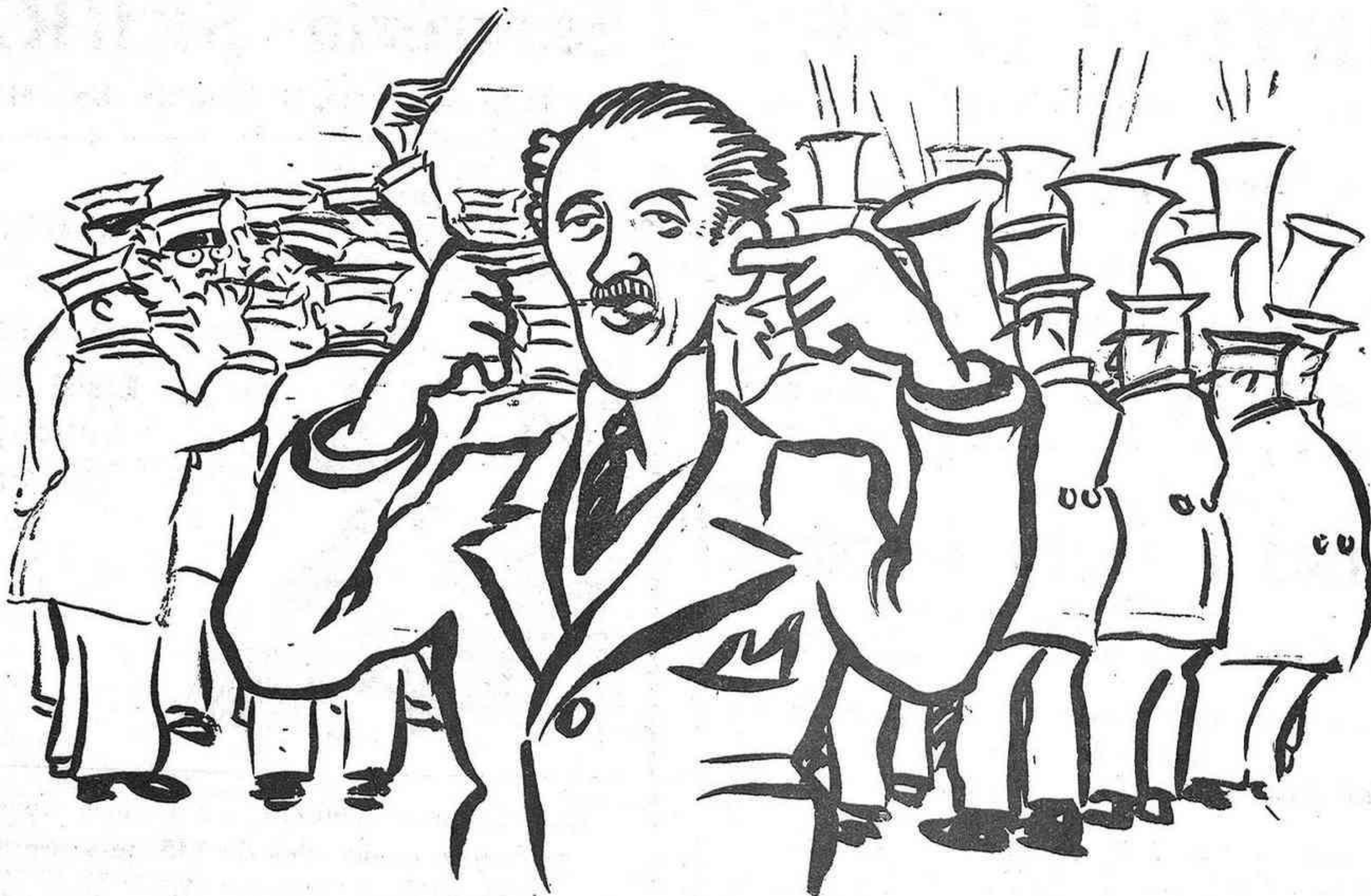
En Maynés.—Com desafina aquesta banda! Un music.—Li falta l'oll de l'augment de sou.

Impremta L'Esquella i La Campana :: Carre. de l'Olm, 8. Barcelona