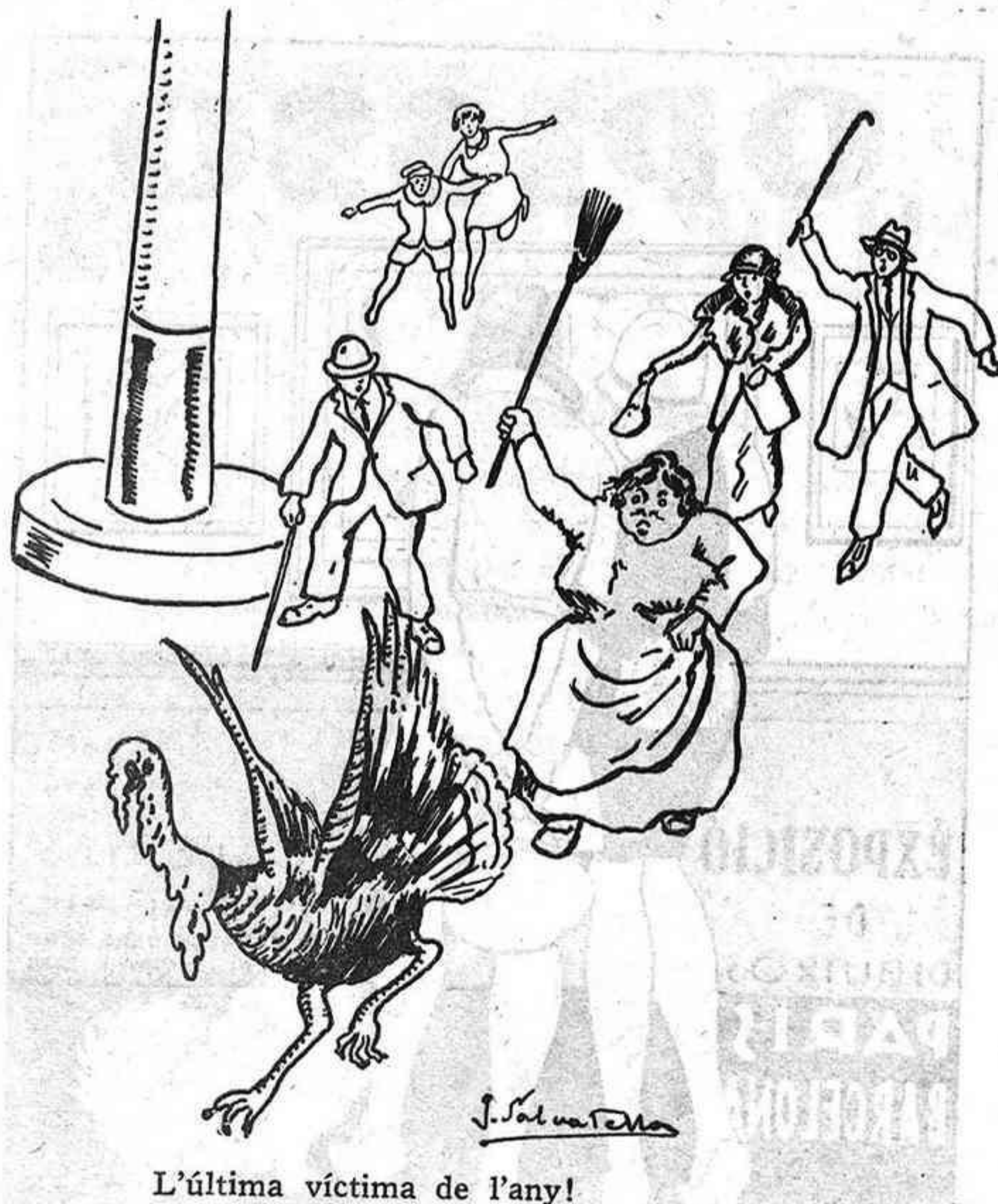
L'última víctima de l'any!