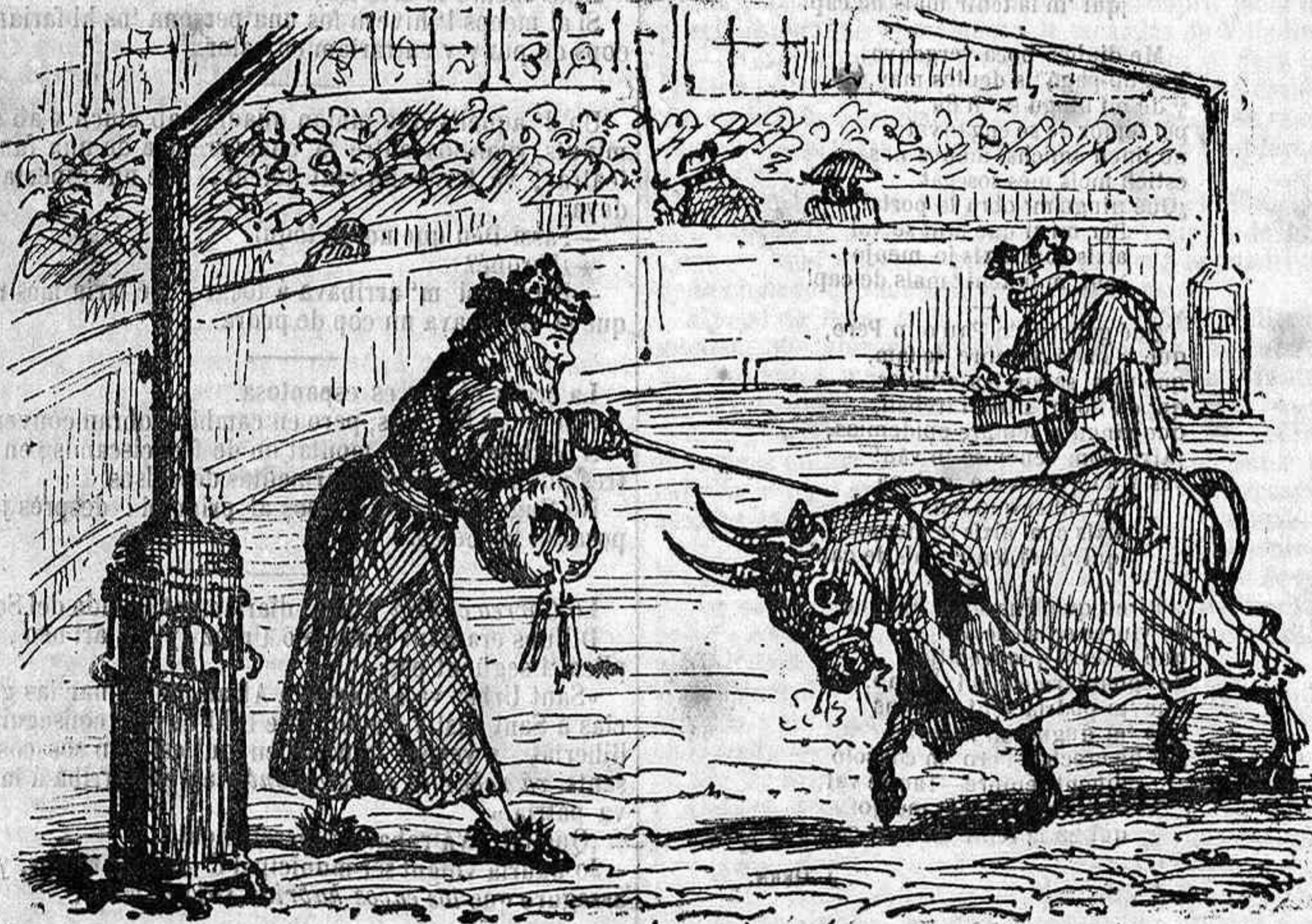
Toros d' iverm.