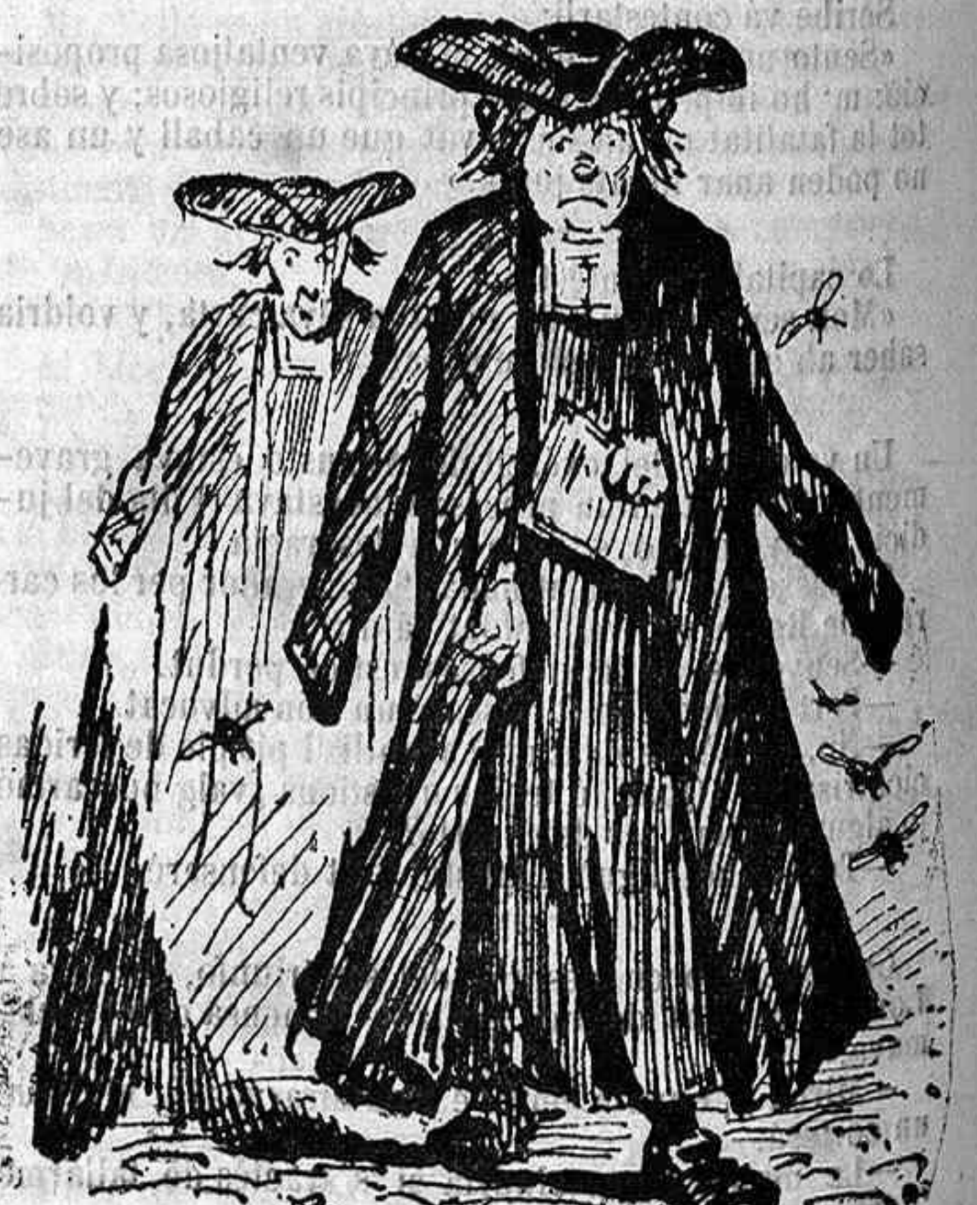
La filoxera de la ensenyanza.