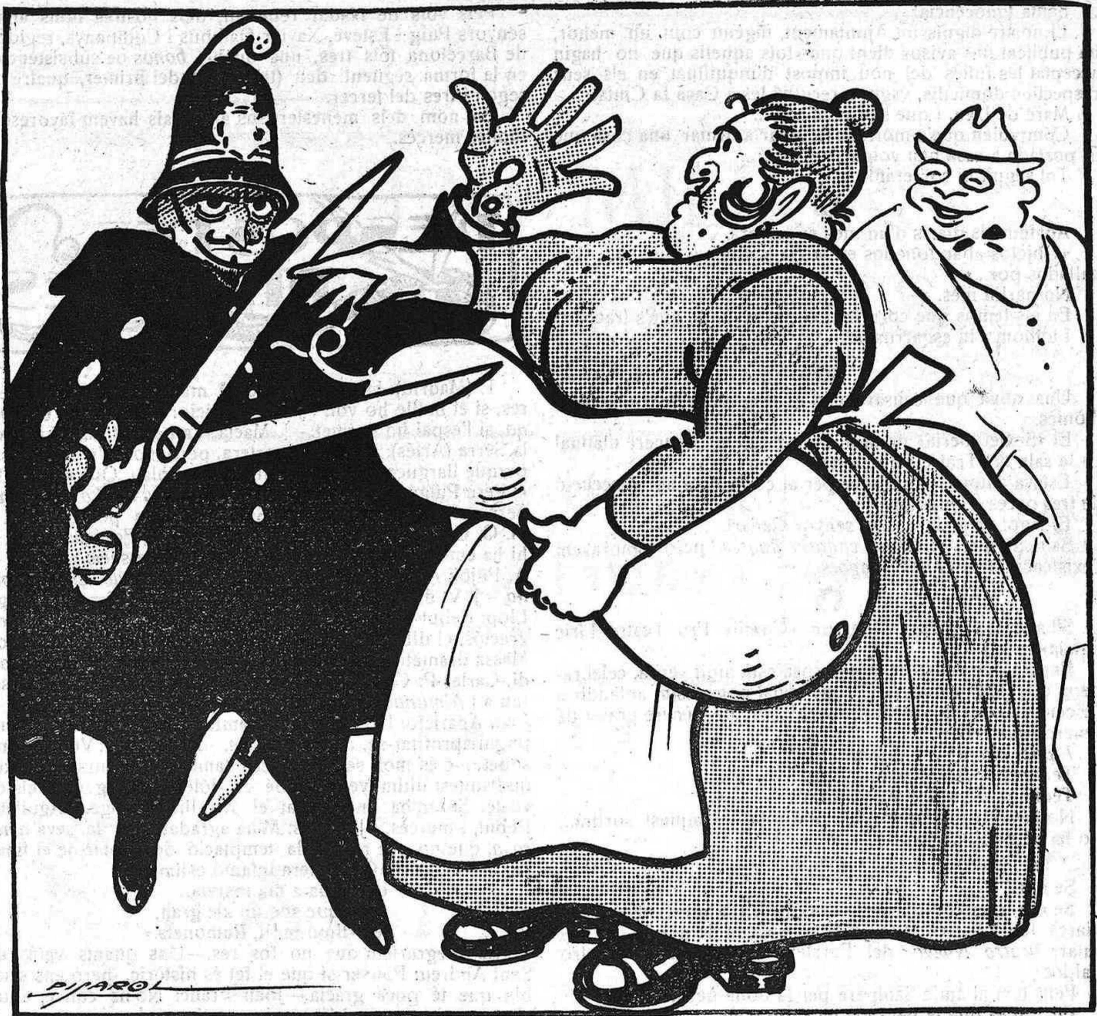
DELS DIES TRAGICS