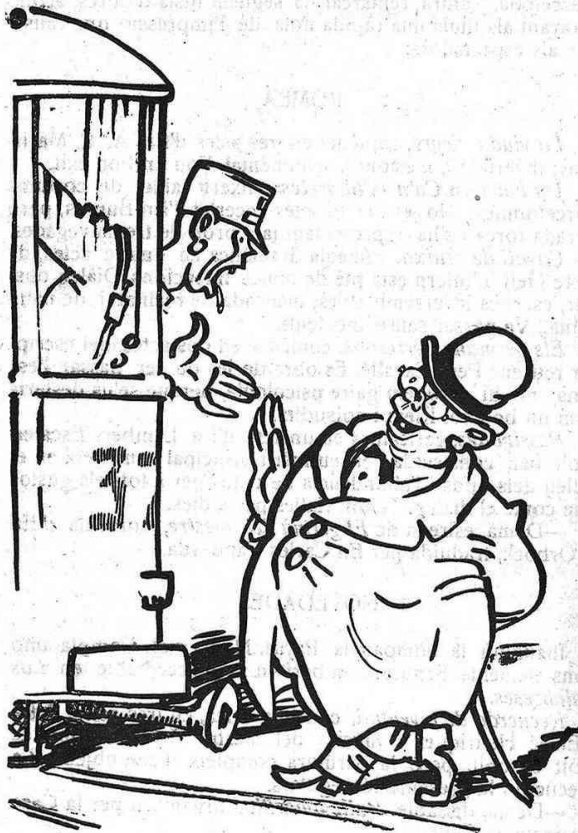
L'ENCARIMENT DELS TRAMVIES