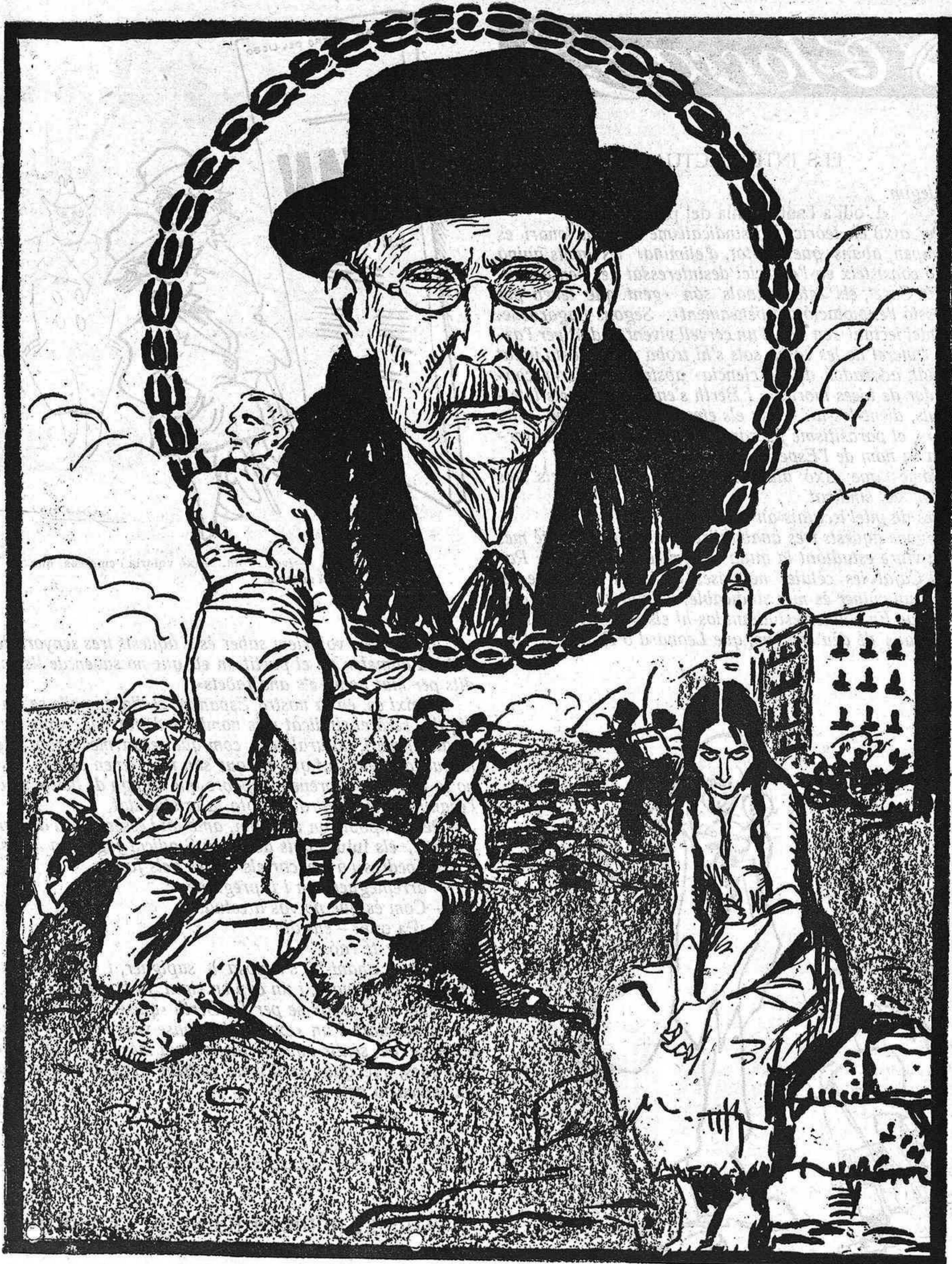
B. PÉREZ GALDÓS, GLORIÓS AUTOR DELS «EPISODIOS NACIONALES» Morí a Madrid el dia 5 del present