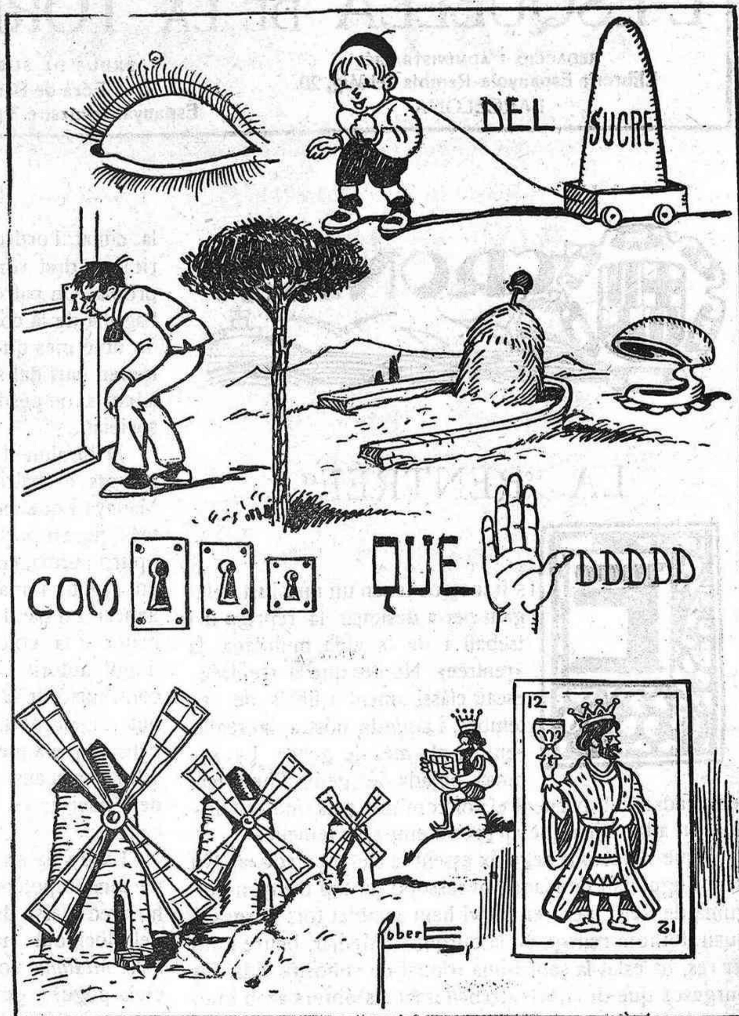
JEROGLIFICS SENSE PREMI

Sobre tot tenint an En Durán per fiscal i cap de la oposició.