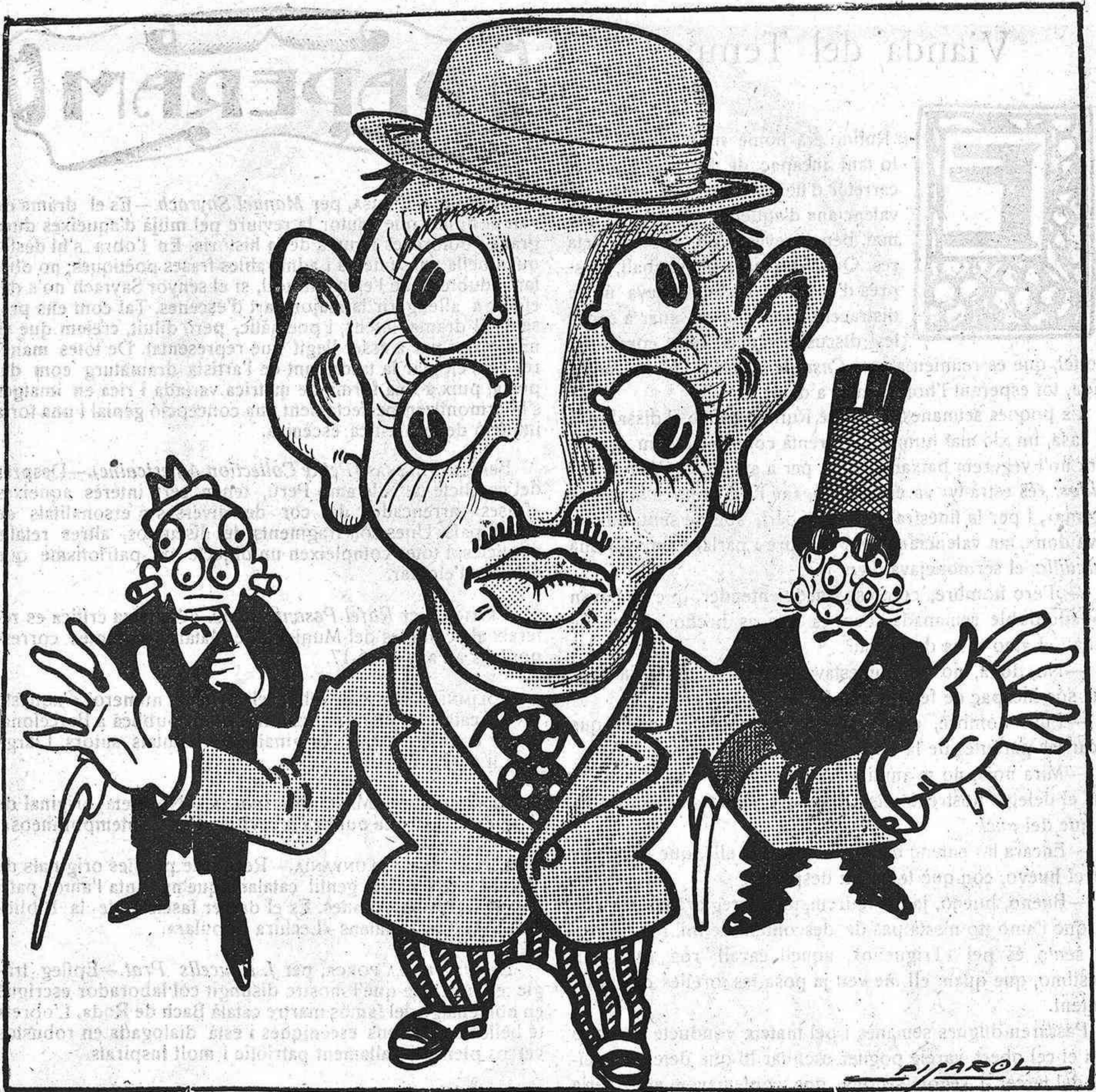
EL BARCELONÍ MATINER

-Un bando a la cantonada? Veïam, donem-hi una ullada!