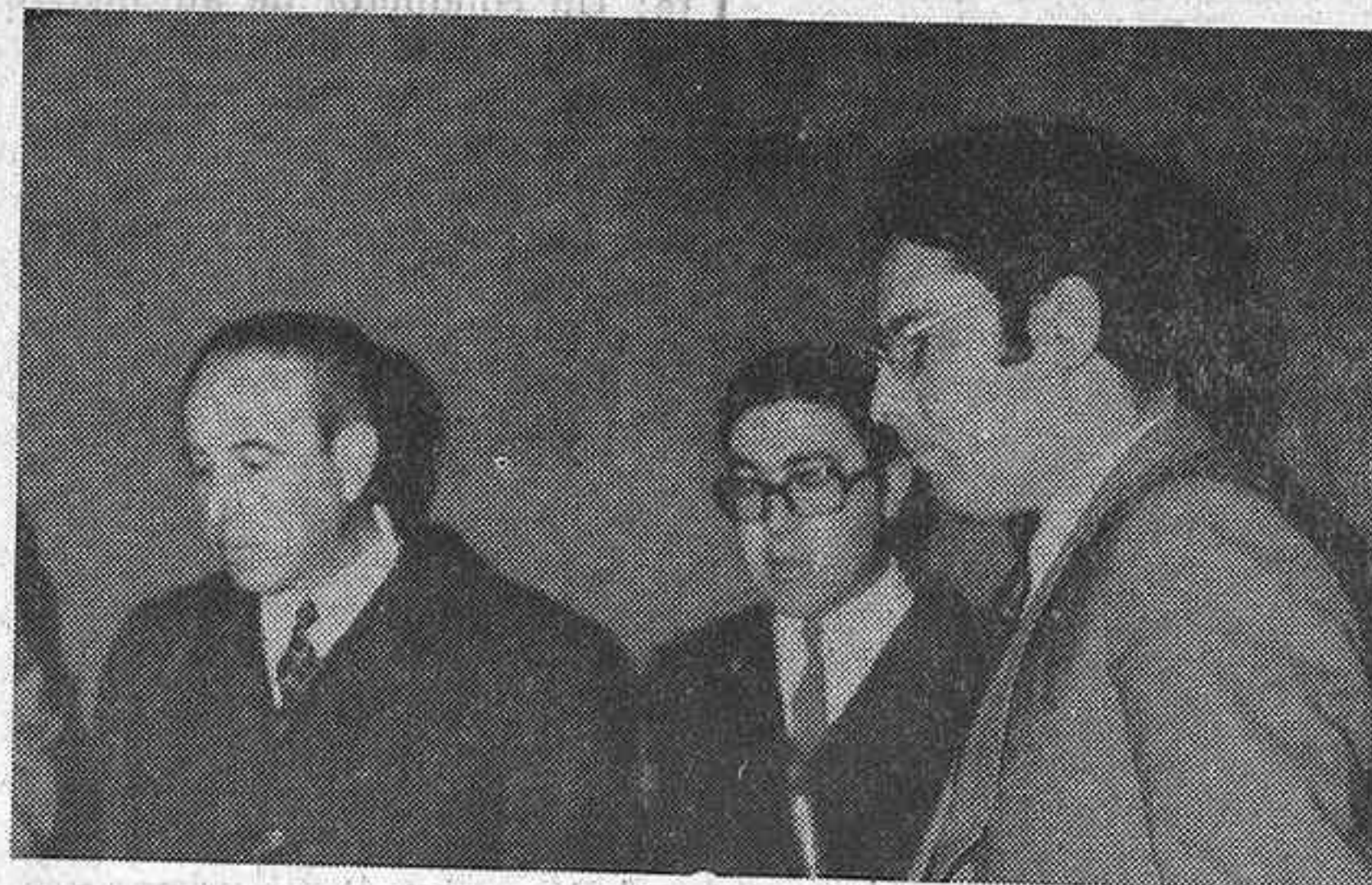
El Delegado Sindical durante su discurso de inauguración.