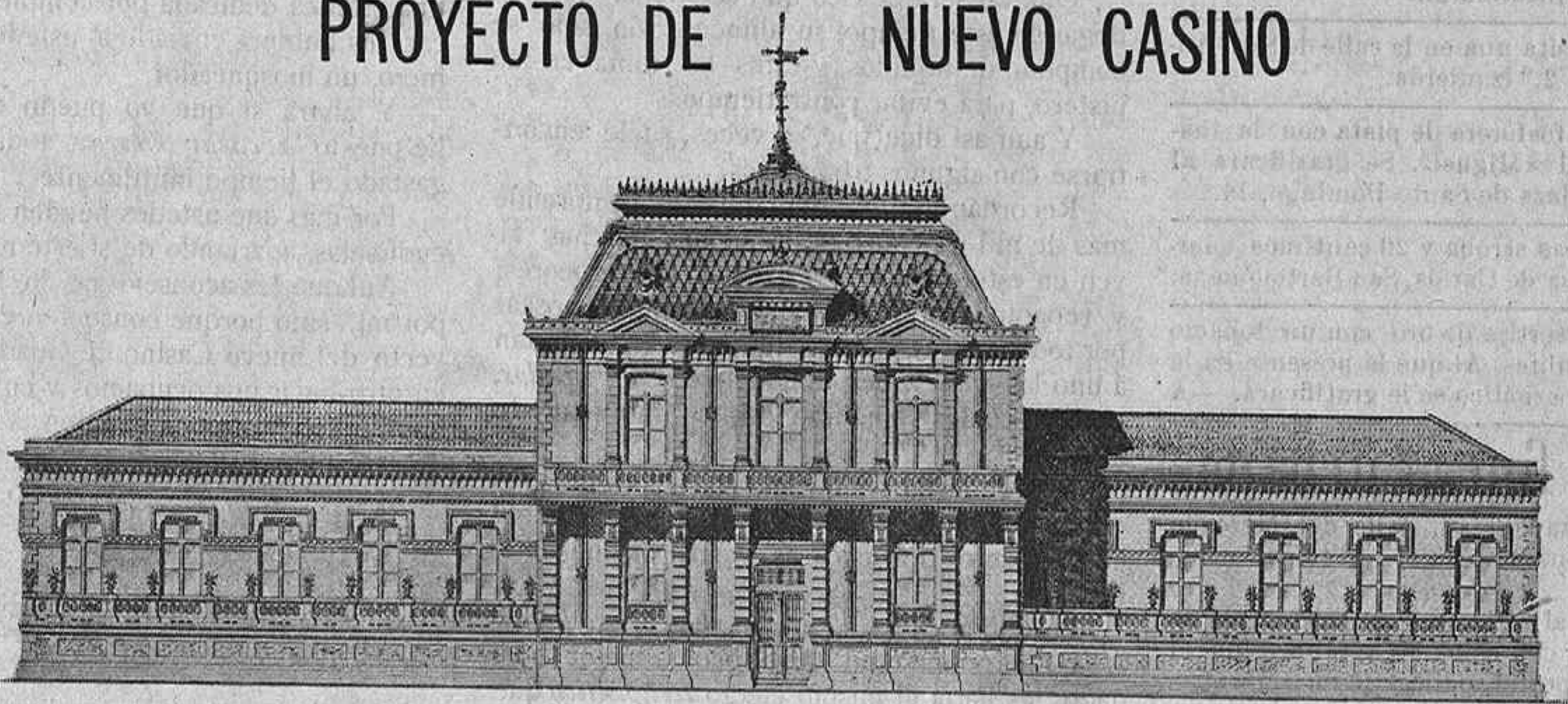
FACHADA PRINCIPAL DEL EDIFICIO