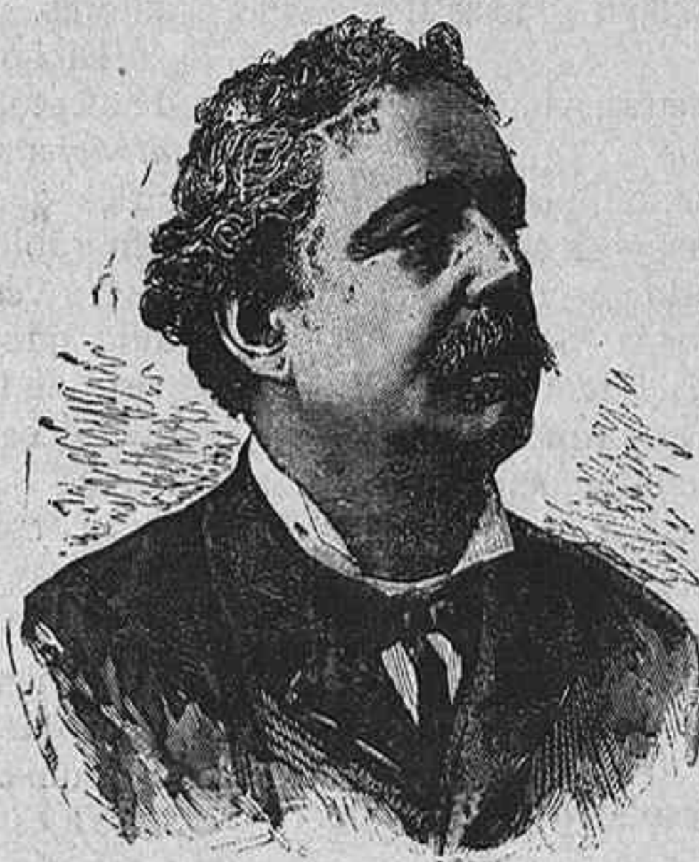
EDMUNDO DE AMICIS