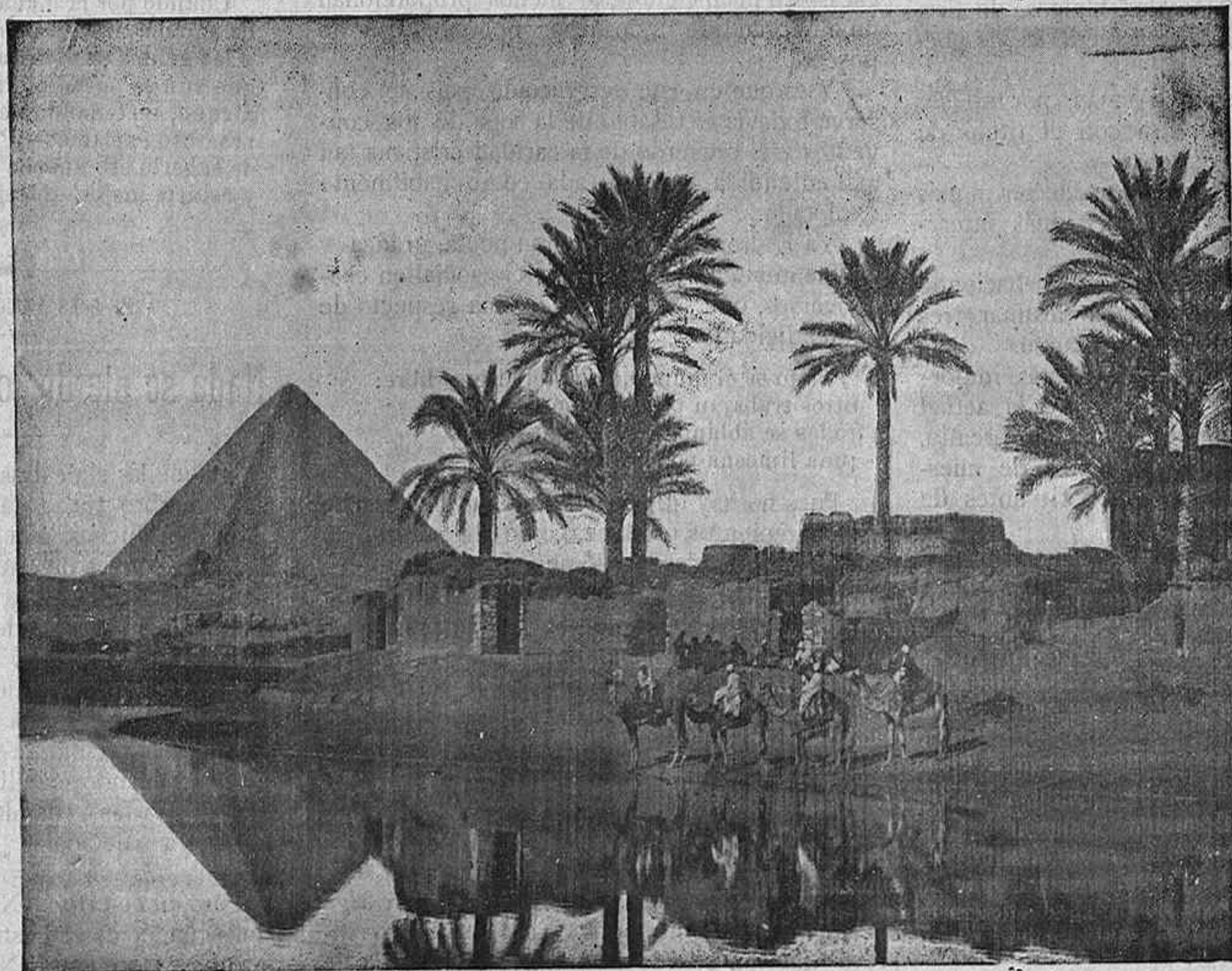
LAS PIRÁMIDES DE EGIPTO