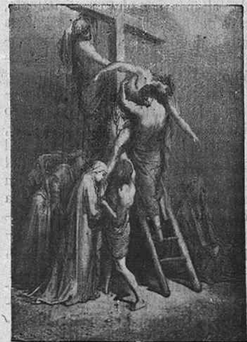
DESCENDIMIENTO DE LA CRUZ