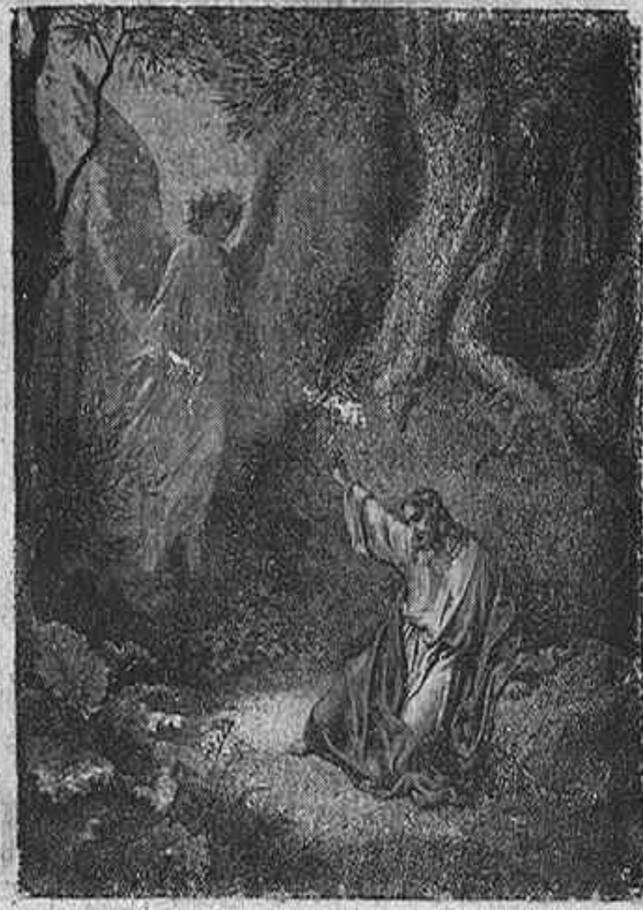
LA ORACIÓN EN EL HUERTO

Cuadros del inmortal artista Gustavo Dore