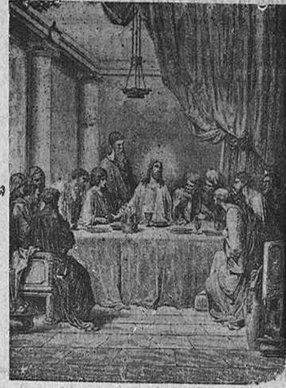
LA CENA DE LOS APÓSTOLES