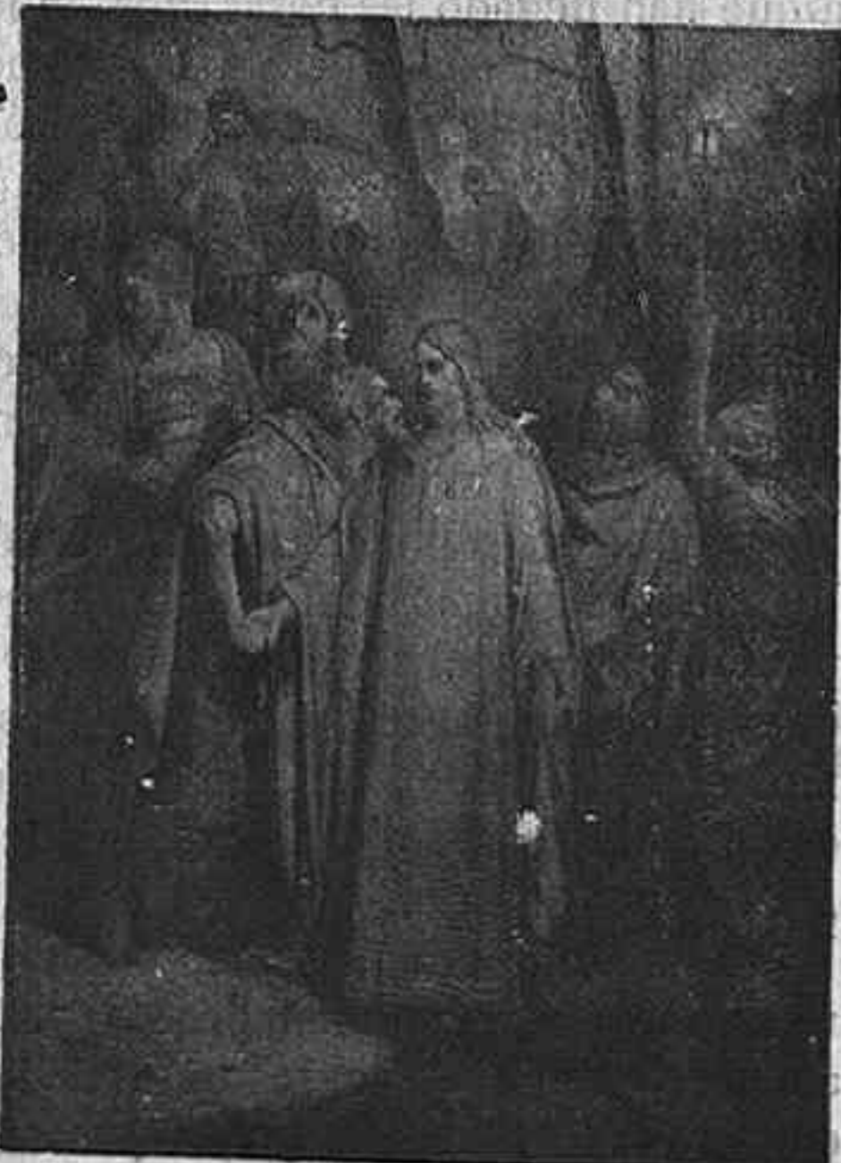
EL BESO DE JUDAS