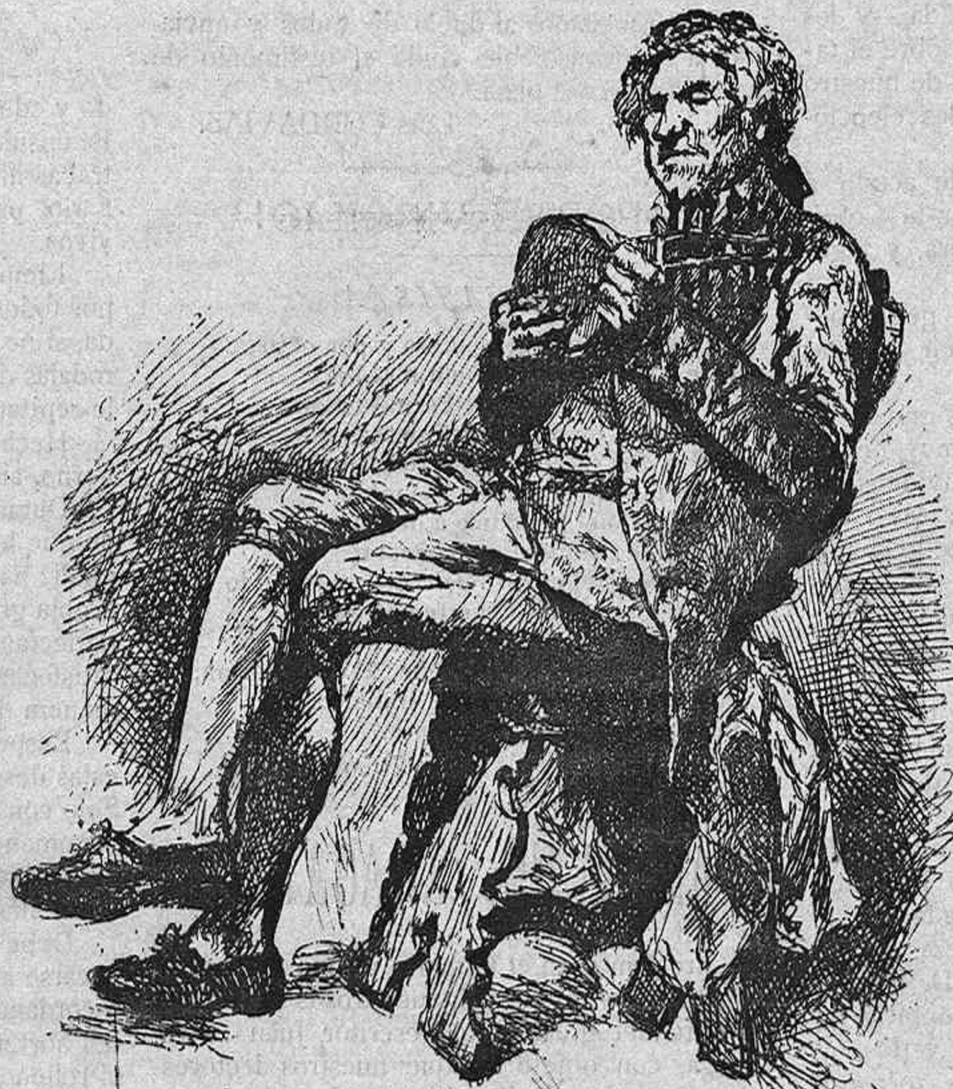
Un violinista de antaño