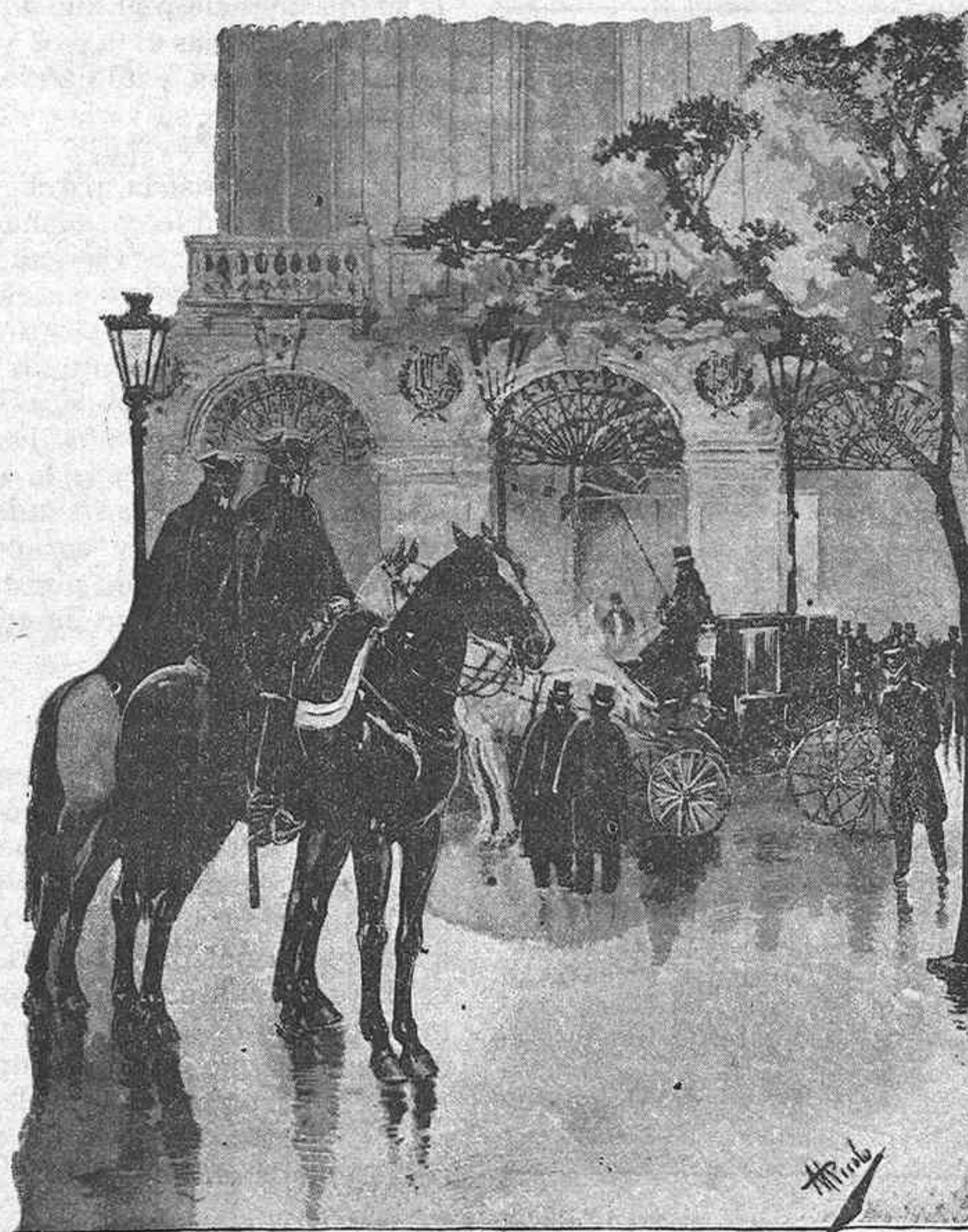
LA SALIDA DEL BAILE