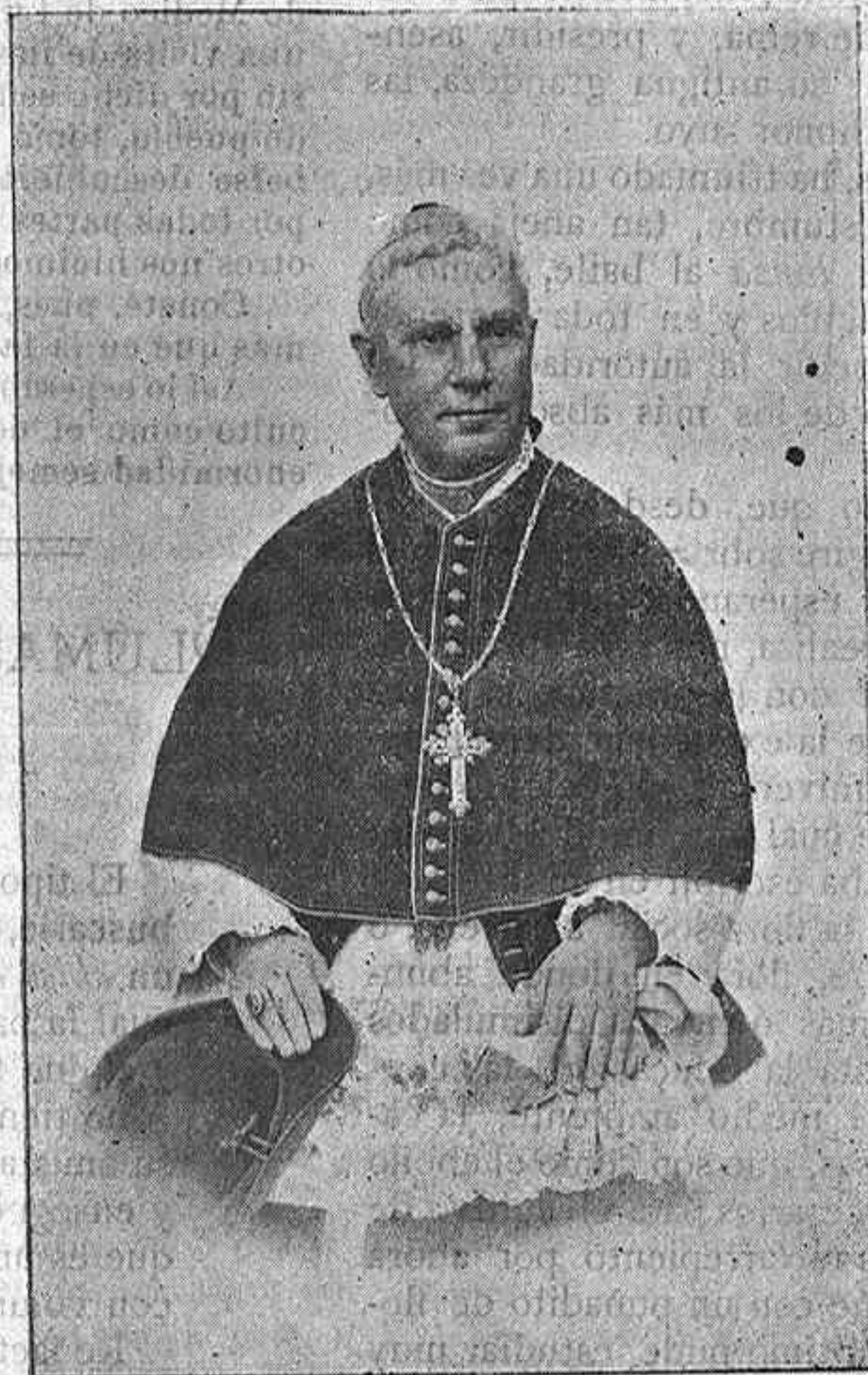
EL OBISPO DE SIGÜENZA