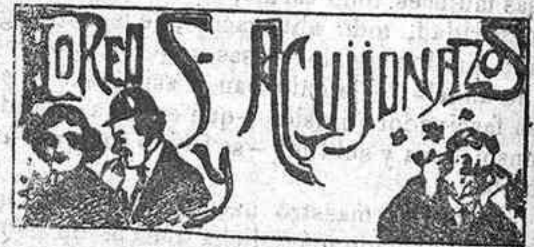
[Hasta la vuelta!]

Hoy actuará también dicha compañía, poniendo en escena, en la primera sección, La tela de araña y por la noche, Un pleito , El amor y el almuerzo y La salsa de Aniceta .