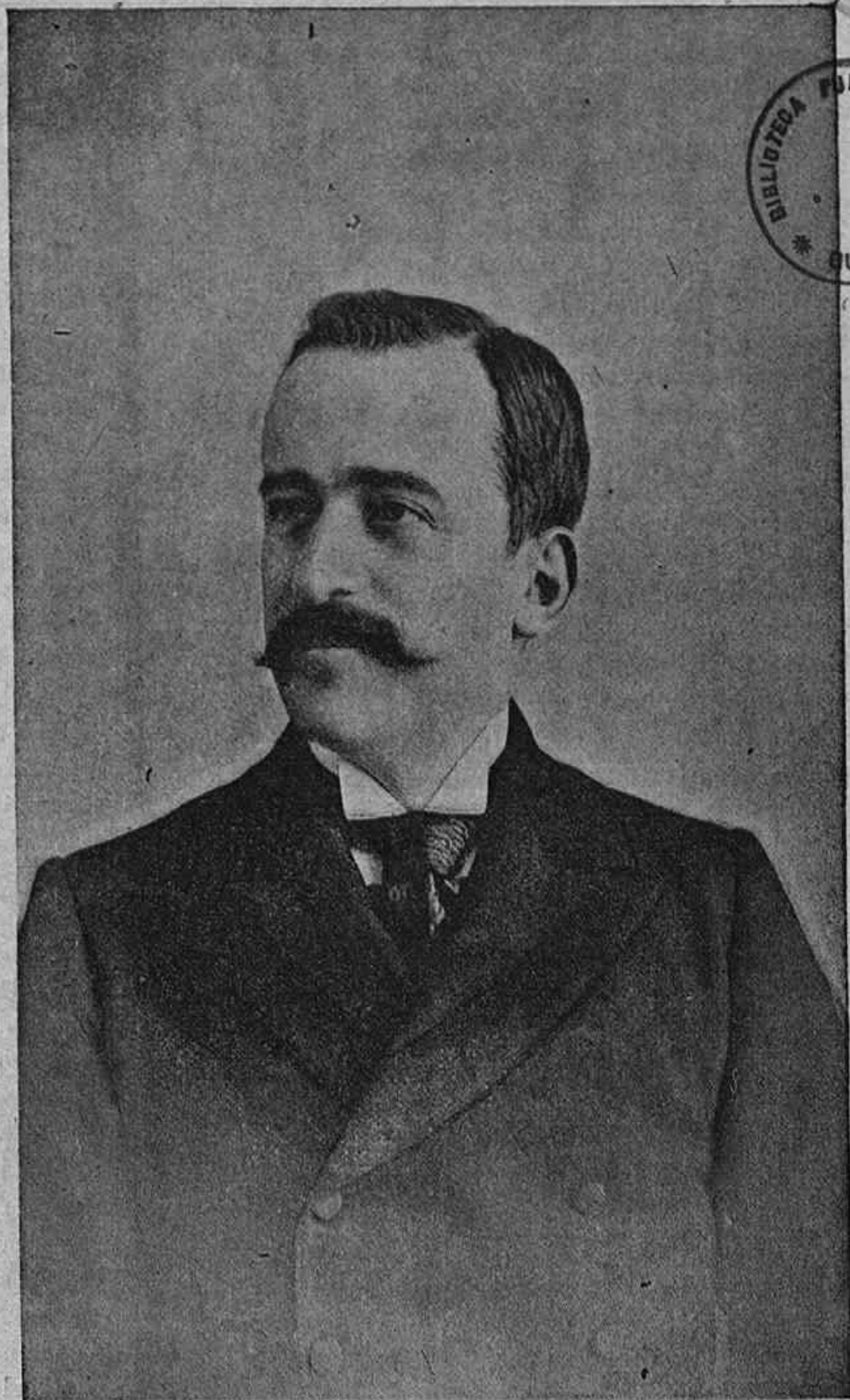
EXCMO. SR. CONDE DE ROMANONES

Grabados: Retrato del Excmo. Sr. D. Alvaro Figueroa, conde de Romanones.