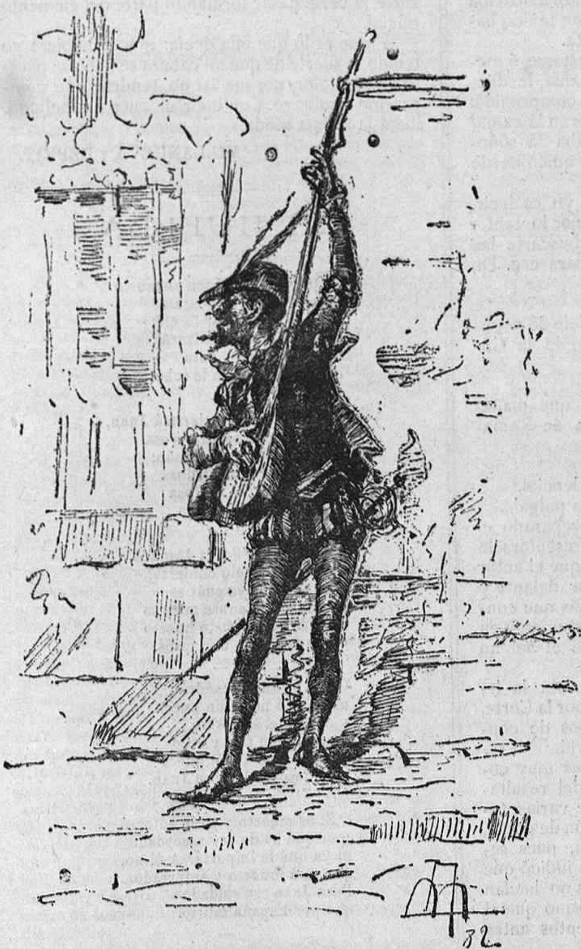
EL TROVADOR.—Dibujo á la pluma de Apeles Mestre.

Grabados: El trovador, (dibujo á la pluma de Apeles Mestre).