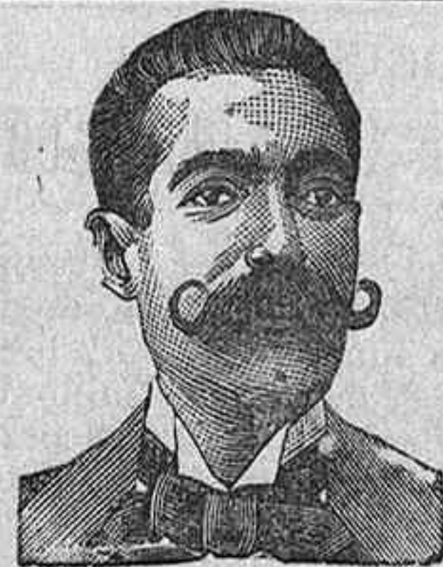
A. SALVATI COSTANZI CALLE DIPUTACION 435 BARCELONA