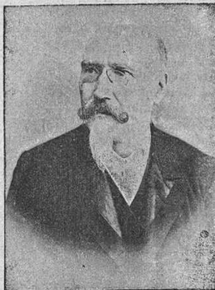
DON JOSE ECHEGARAY