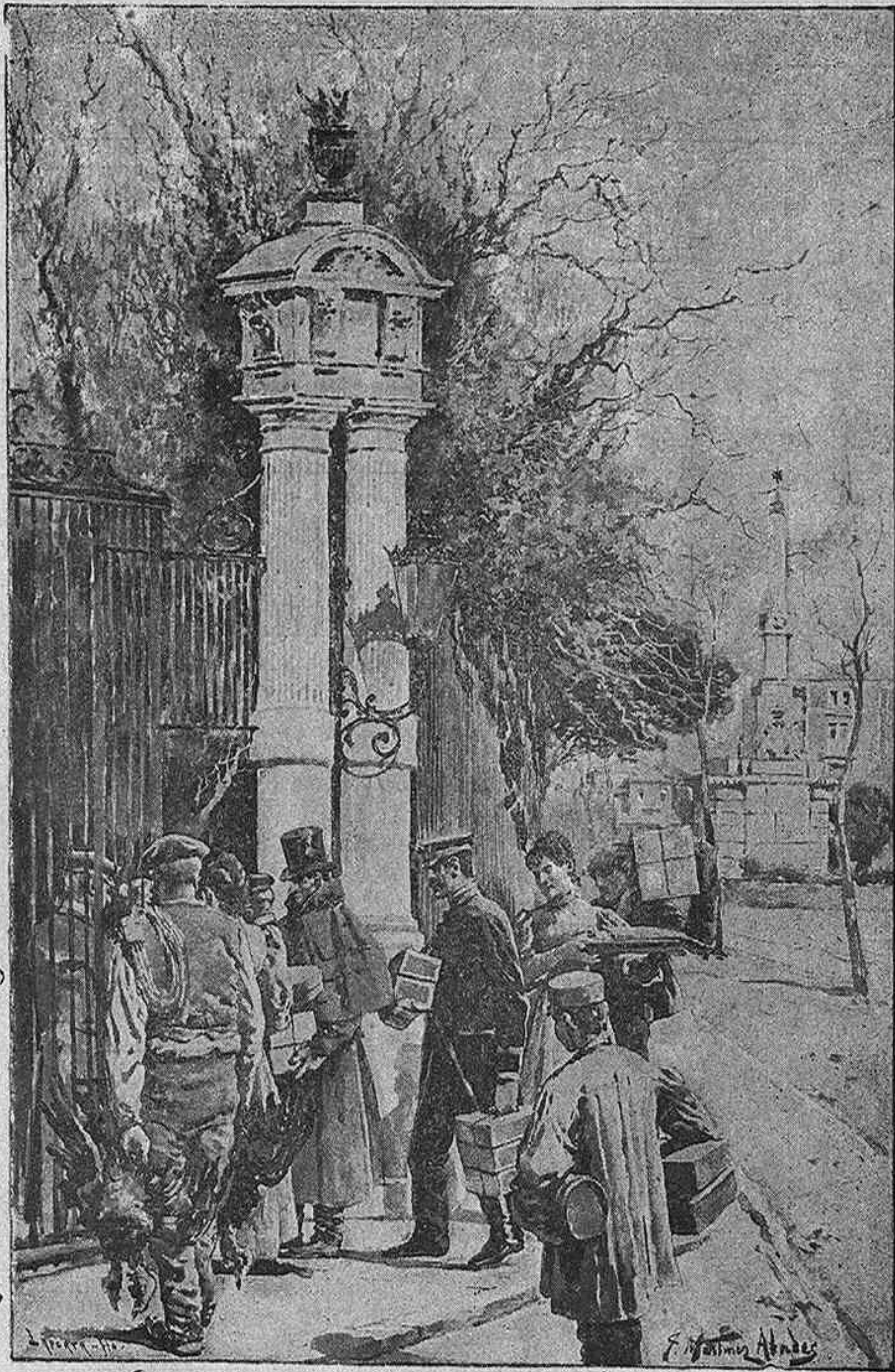
REGALO DE REYES

NÚMERO CORRIENTE 10 CÉNTIMOS. AÑO VII Guadalajara 1.º de Enero de 1900 NUM. 279 NÚMERO ATRASADO 25 CÉNTIMOS.