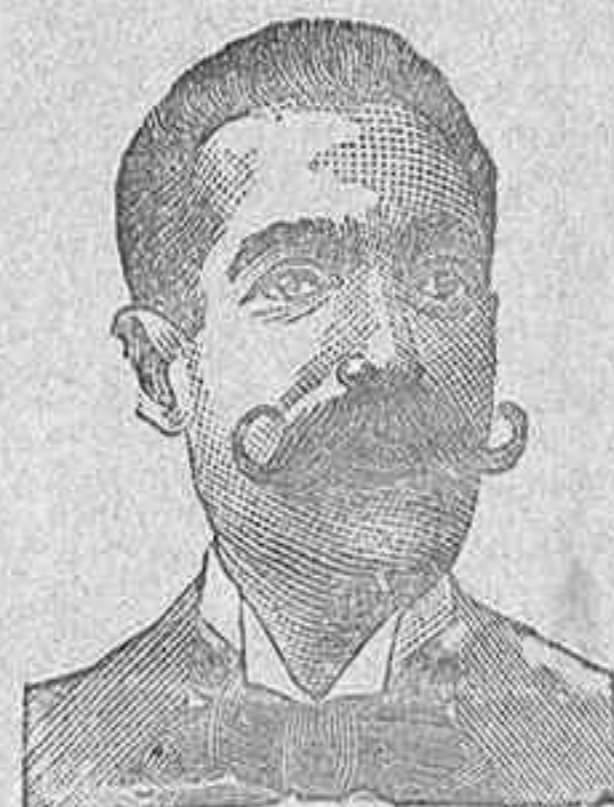
A. SALVATI COSTANZI CALLE DIPUTACION 435 BARCELONA