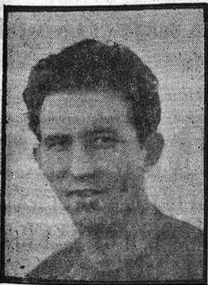
DOALTO. De todos conocido por su temporada anterior en la que las ex (Pasa a la página seis)