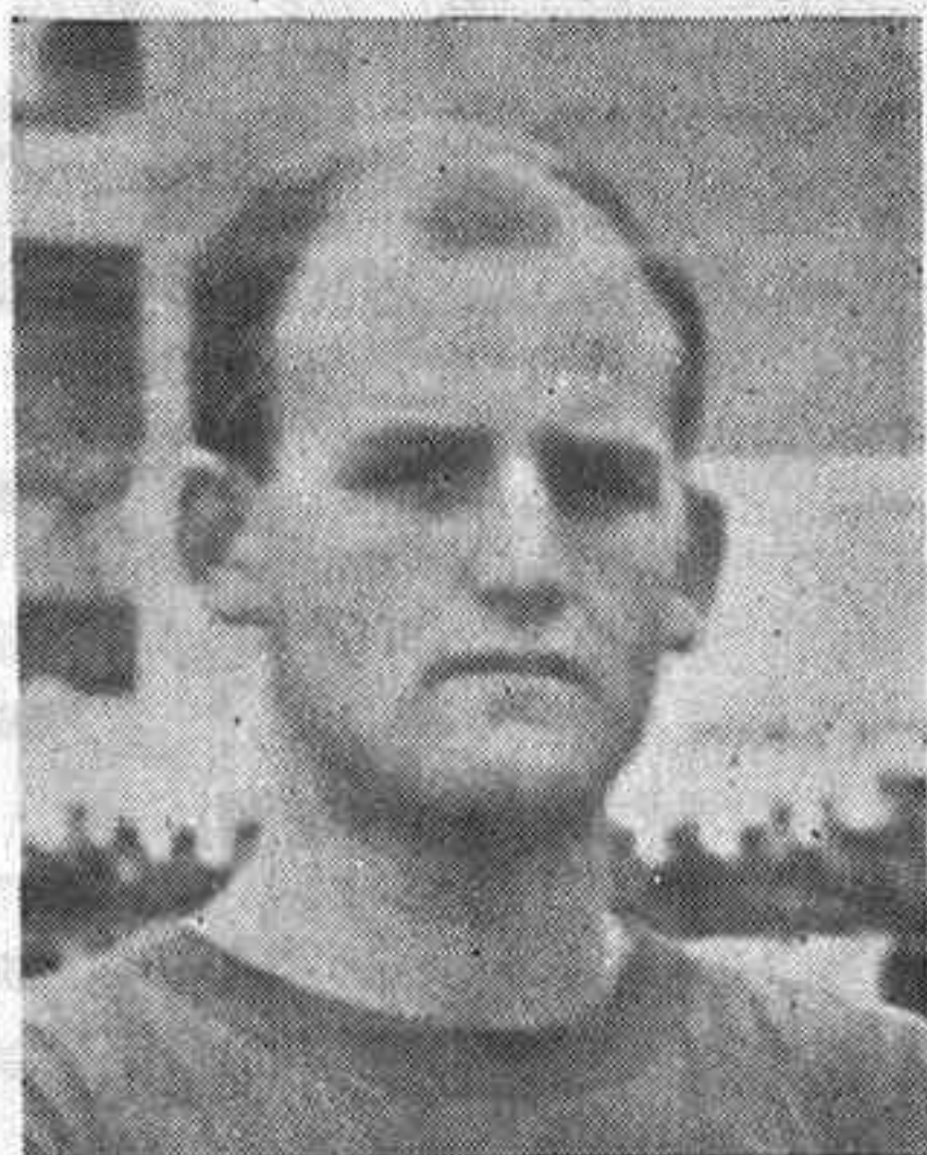
Camargo II: que hubo de sustituir, con regular fortuna, en el centro de la zaga, al lesionado Pedrito

Los primeros cuarenta y cinco minutos transcurren con claro dominio local. Toda la iniciativa es del Guadalajara y Valbuena pasa tranquilo todo este