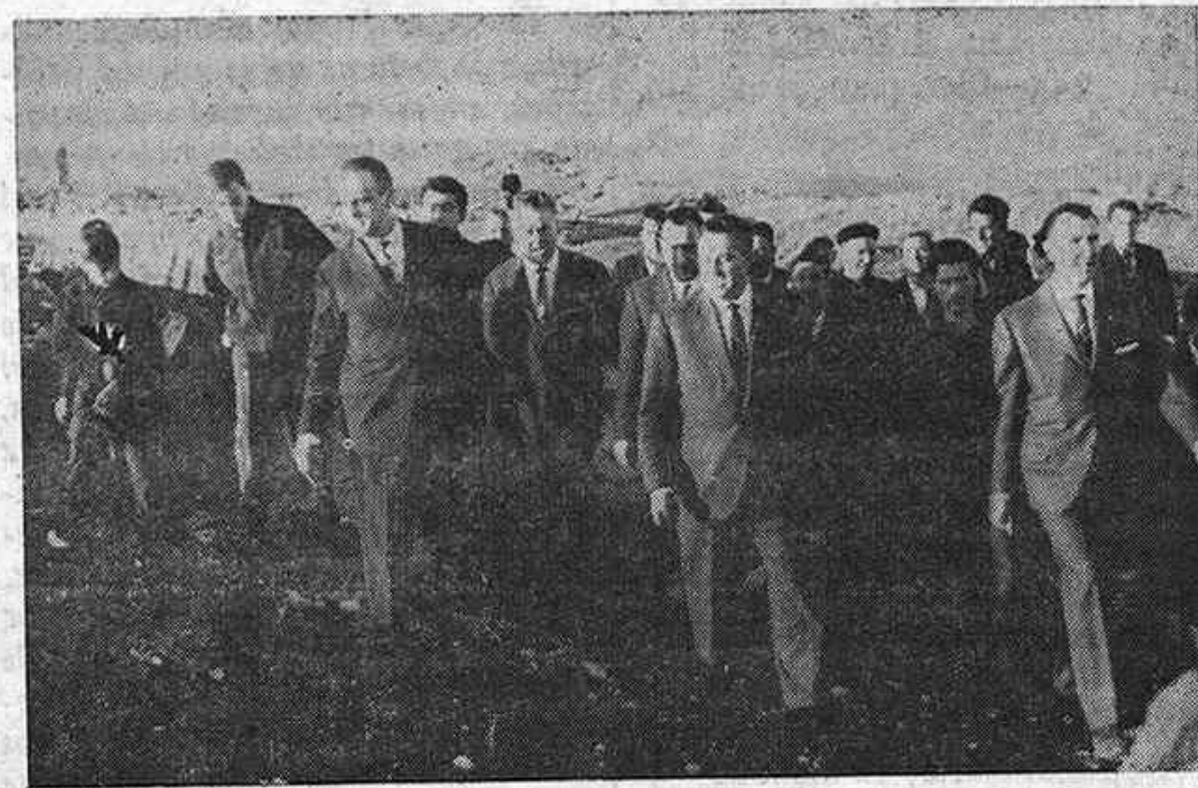
En la explanada del castillo atencino

Nos gusta, estamos orgullosos de la Paz, pero no nos gusta el olvido. Y creemos, en contra de la opinión de quienes piensan que es hora de nuevas andaduras, de roturas de amarras con un tiempo al que se quiere hacer viejo, que hubiera seguido siendo bueno el que Guadalajara, de algún modo, sin estridencias sí pero con profundo amor y eterna gratitud, hubiera patentizado su colectivo júbilo en la victoria, con una muestra de reconocimiento a quienes materializaron el comienzo de este venturoso camino que ya dura veintiséis años. Hubiera sido una magnífica oportunidad de acreditar que el 29 de marzo de 1939, si está alejado en el tiempo, no lo está en el corazón de los alcañares, en el que sigue operando como poderoso determinante y con el que debe contarse, impresionablemente, a la hora de las nuevas programaciones.