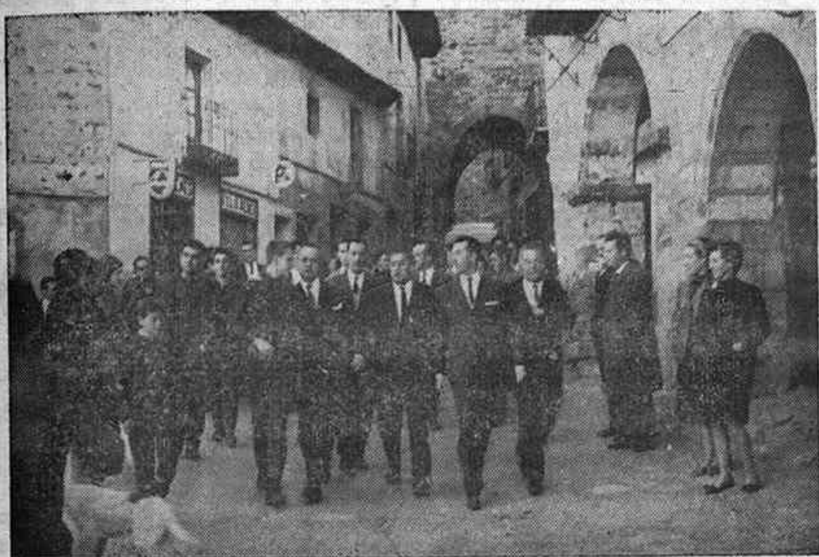
El señor ministro, con nuestras primeras autoridades, de regreso del castillo de Atienza.

El Sr. Fraga prometió a nuestras Autoridades una visita más detenida, con un itinerario por Pastrana y zona de los lagos