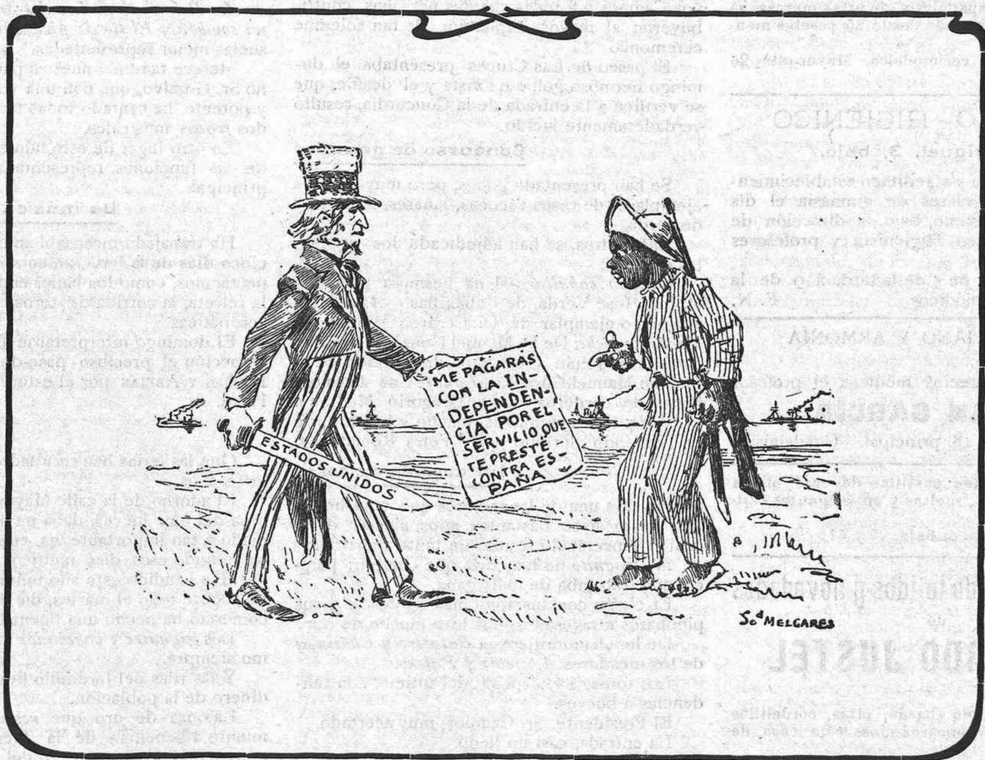
UNA LETRA CONTRA CUBA Á OCHO AÑOS VISTA