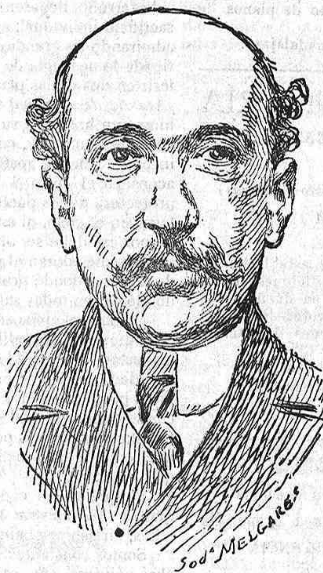
Don Eduardo Dato Iradier Presidente del Congreso de los Diputados