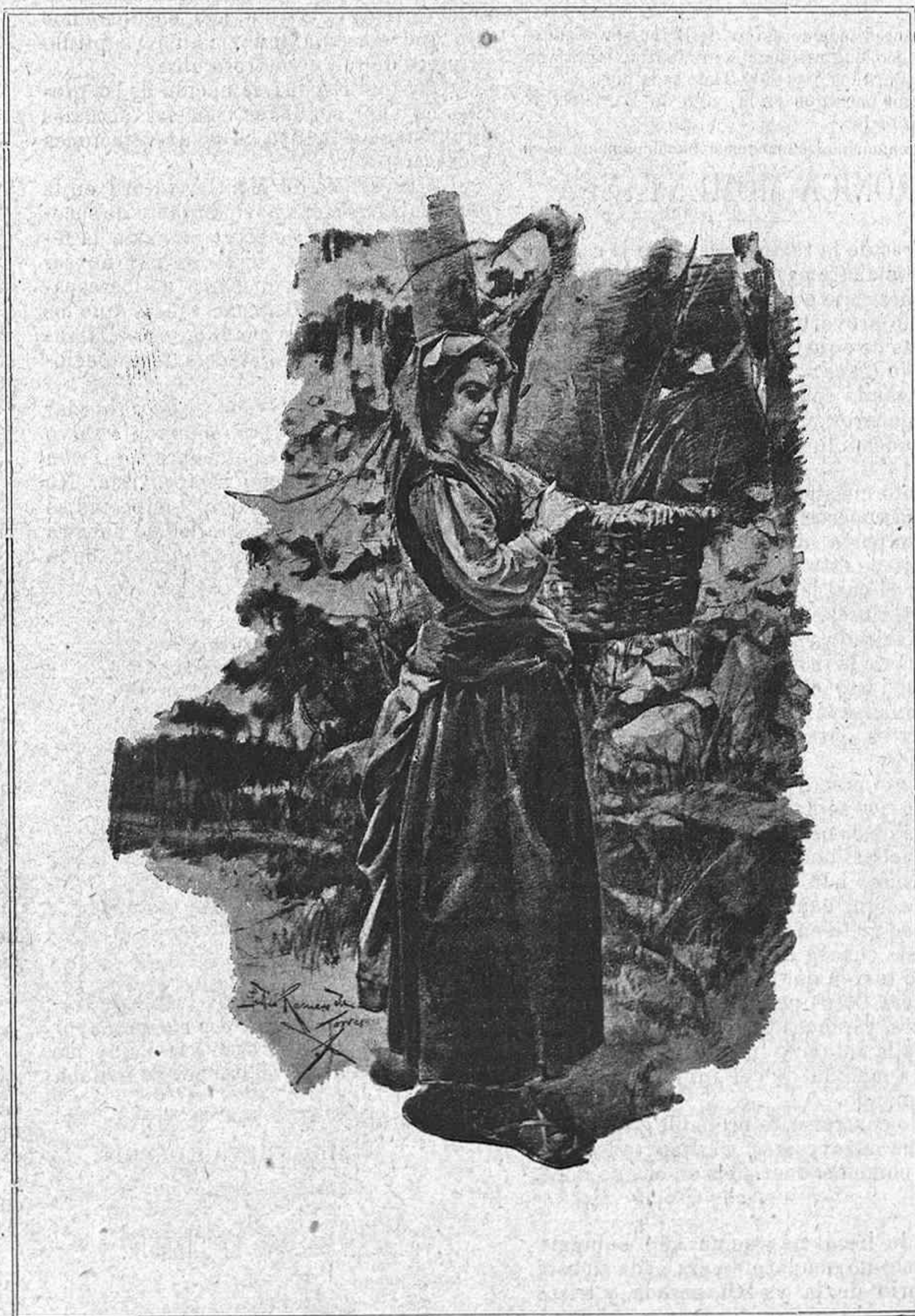
LA VENDIMIADORA, DIBUJO DE JULIO ROMERO DE TORRES

Bellas artes: La vendimiadora, dibujo de Julio Romero de Torres. Nuestros gomaz, por Cilla.