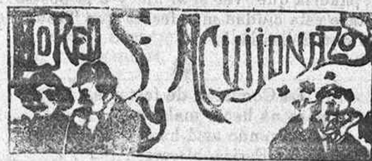
¡Eche usted lujo!

Por la tarde, a las cinco, Exposición, final de la novena y adoración de la reliquia del Santo.