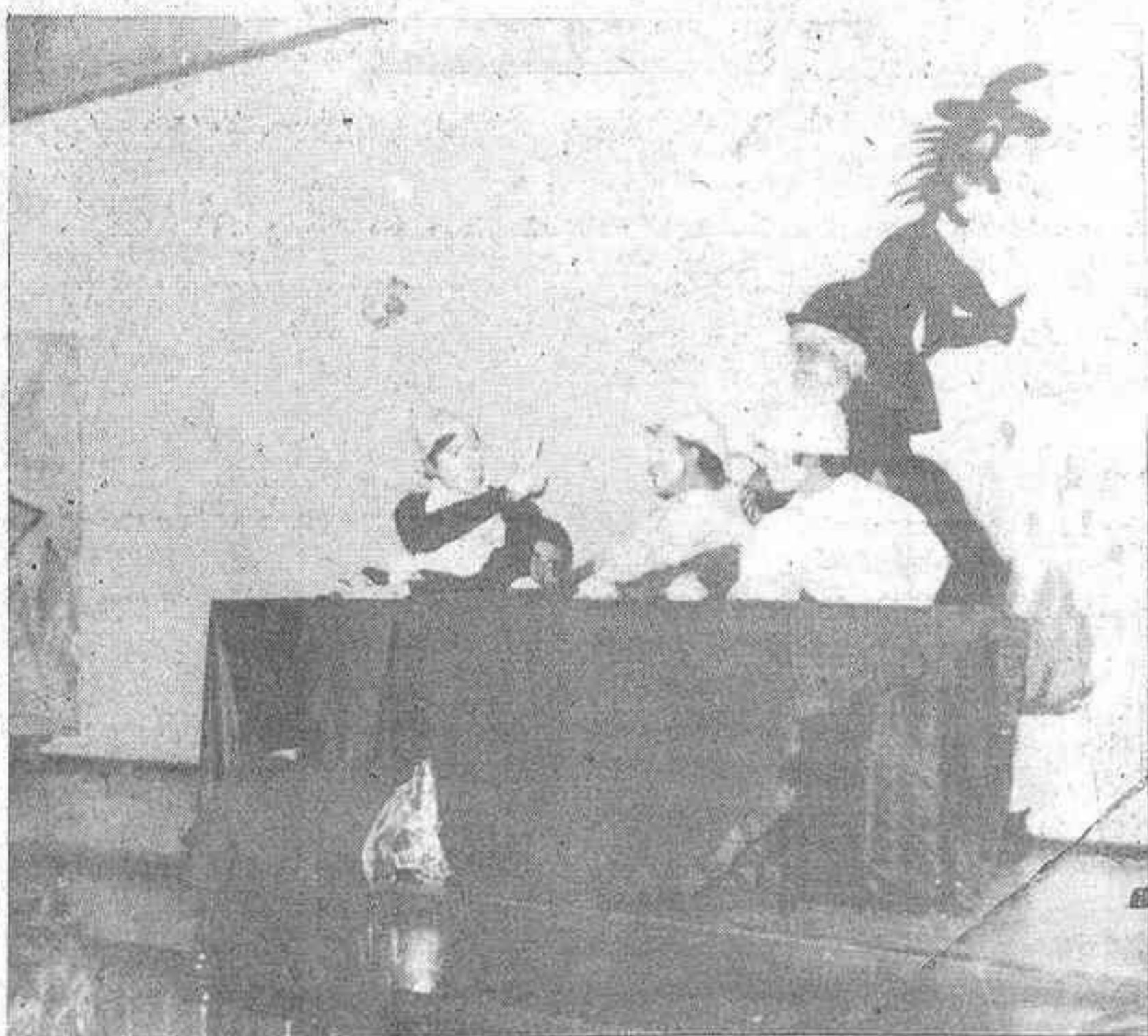
Un momento de la obra