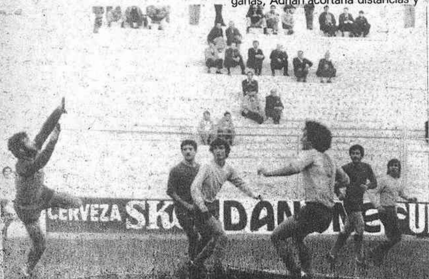
La delantera oriolana solo reaccionó al final.