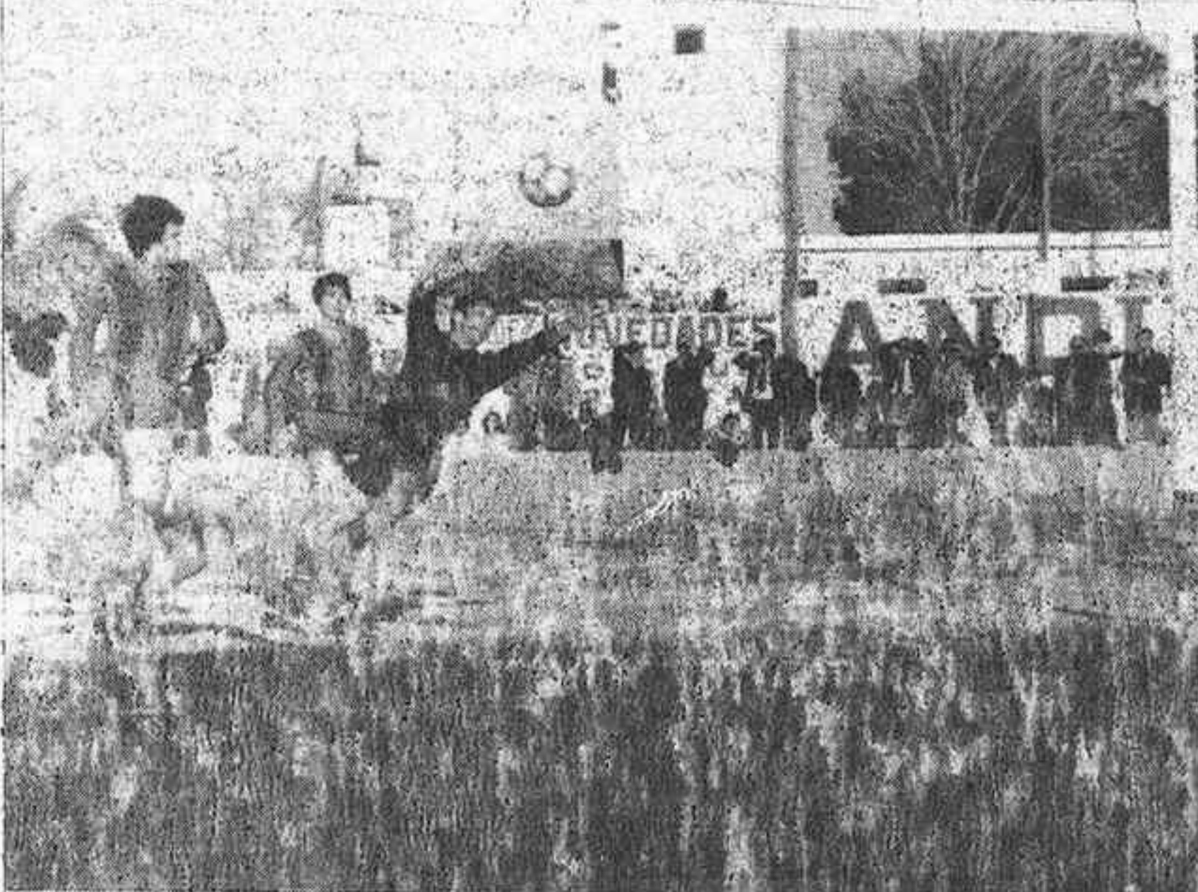
El Almoradí tuvo muchas oportunidades.

En La Condomina y por sanción federativa el Orihuela cedió un positivo más ante el Santomera, equipo que se encontró con tres goles regalados en una desafortunada tarde para la defensa oriolana. Al comienzo del partido el Orihuela montó su ataque que no tuvo inspiración rematadora, mientras que los del Santomera en su primer avance se les hizo falta y como consecuencia de su saque, Mazón batió a Feliciano sin apelación posible a partir de ahora se haría más insistente la presión oriolana, pero sin resultado positivo y para colmo de males Burguete que aun jugando de centrocampista es un hombre a tener en cuenta por su capacidad de