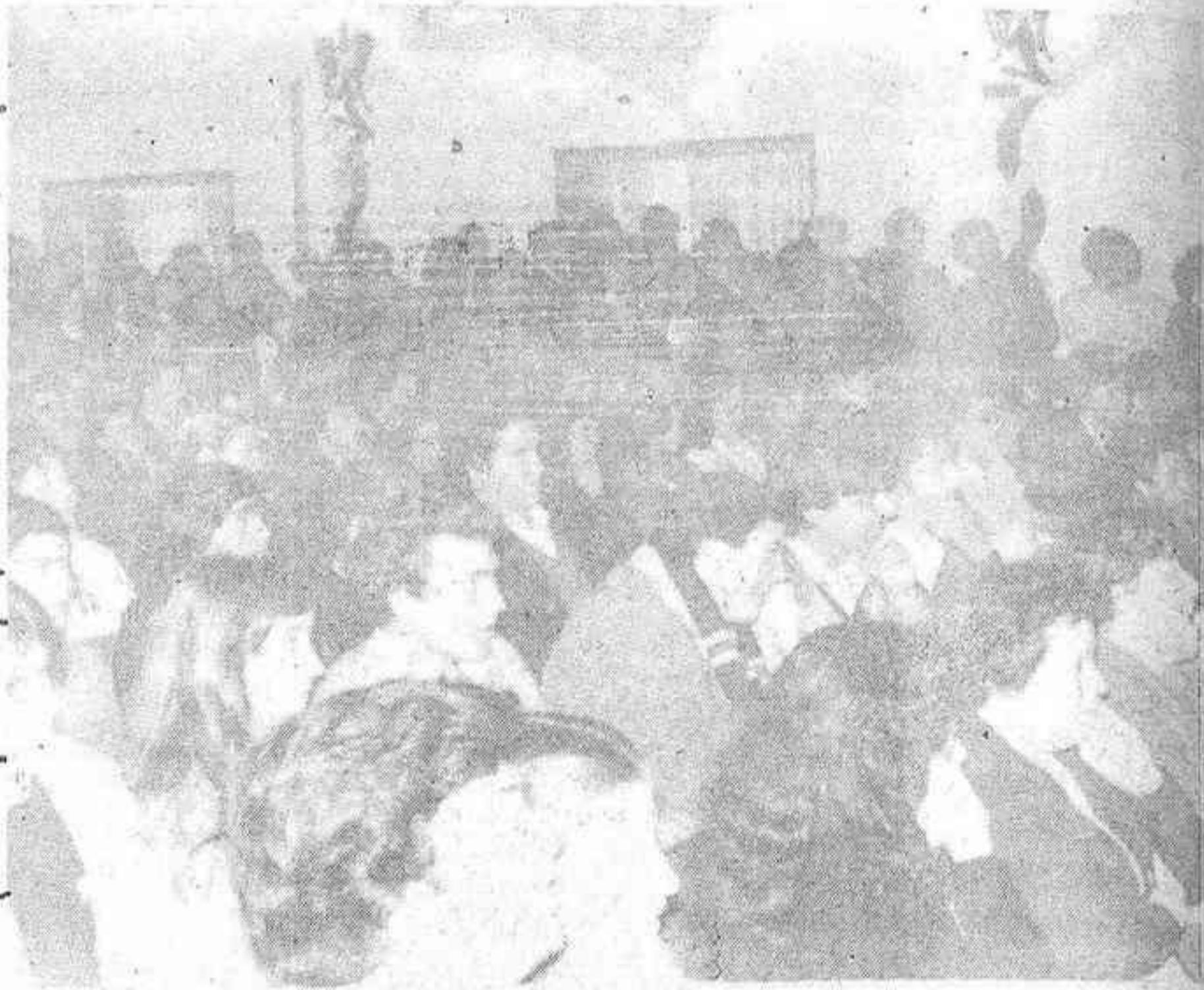
Asistió mucho público

Los proyectos del Instituto de Formación Profesional a la vista del éxito obtenido y del desinteresado ofrecimiento de colaboración de las cajas Rural Central, de Ahorros Provincial y de Alicante y Murcia, son consolidar la idea de celebrar conjuntamente toda la Forma-