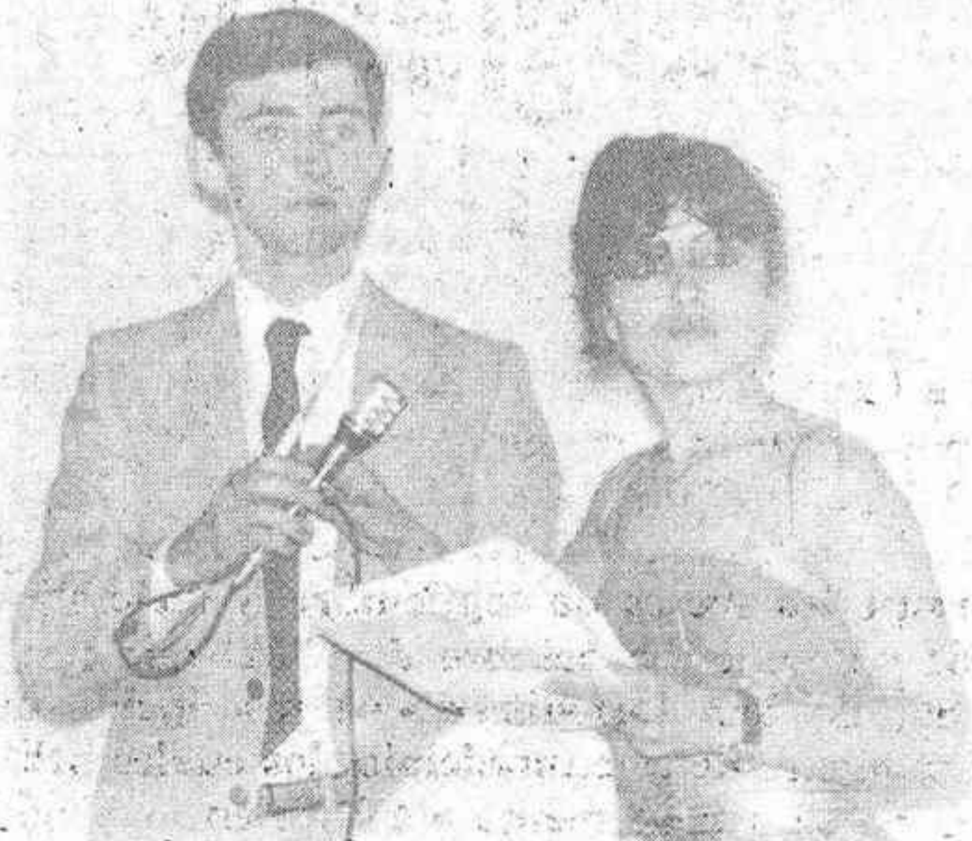
Los presentadores del acto

Gran relevancia adquiere este año la festividad de San Juan Bosco para cuya conmemoración el Instituto de Formación Profesional preparó un apretado programa de actos en los que participaron, por expresa invitación del Instituto, los demás centros de formación profesional de Orihuela y de la comarca, en concreto Jesús y María, San José Obreiro y la Escuela Familiar Agraria «El Campico». La programación de la festividad, siguiendo la experiencia del pasado año, la hicieron los propios alumnos del Instituto en Asamblea de Representantes, con posterior aceptación por parte del Consejo de Dirección.