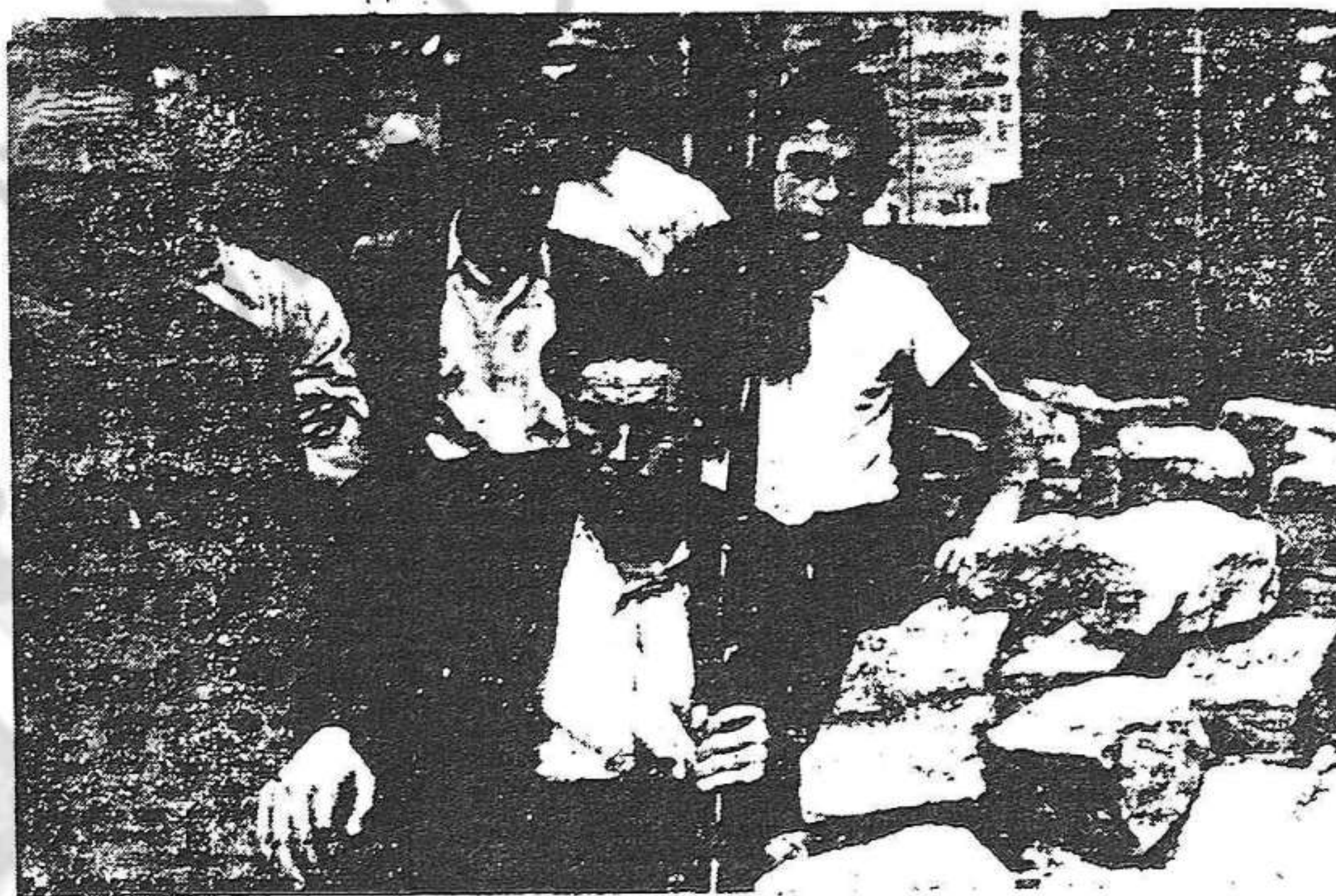
Mentre uns descansen al peu de la barricada, d'altres cuiten a allistar-se a les Milícies antifeixistes que abatrán la reacció

Les forces feixistes ocuparen de bon principi els pisos del capdavant de l'Hotel Colom i el «Circulo del Ejercito y de la Armada». Finalment, fugint-se addictos al règim i donant visques a la República, aconseguiren lliure-se a la Telefònica i ocupar els llocs estratègics.