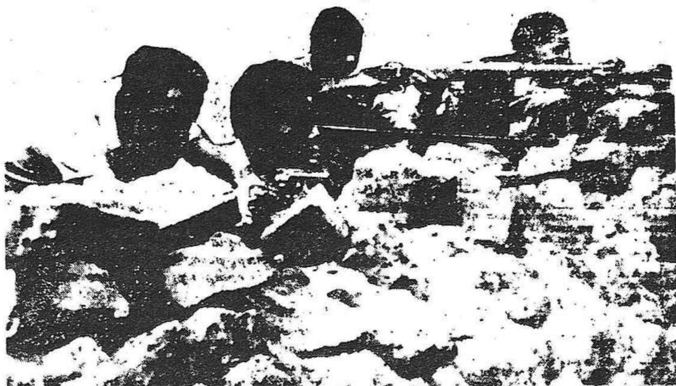
Una avançada de la Revolució

Durant la nit del divendres dia 17, van correr per Madrid els rumors d'una sublevació feixista a les terres del Marroc.