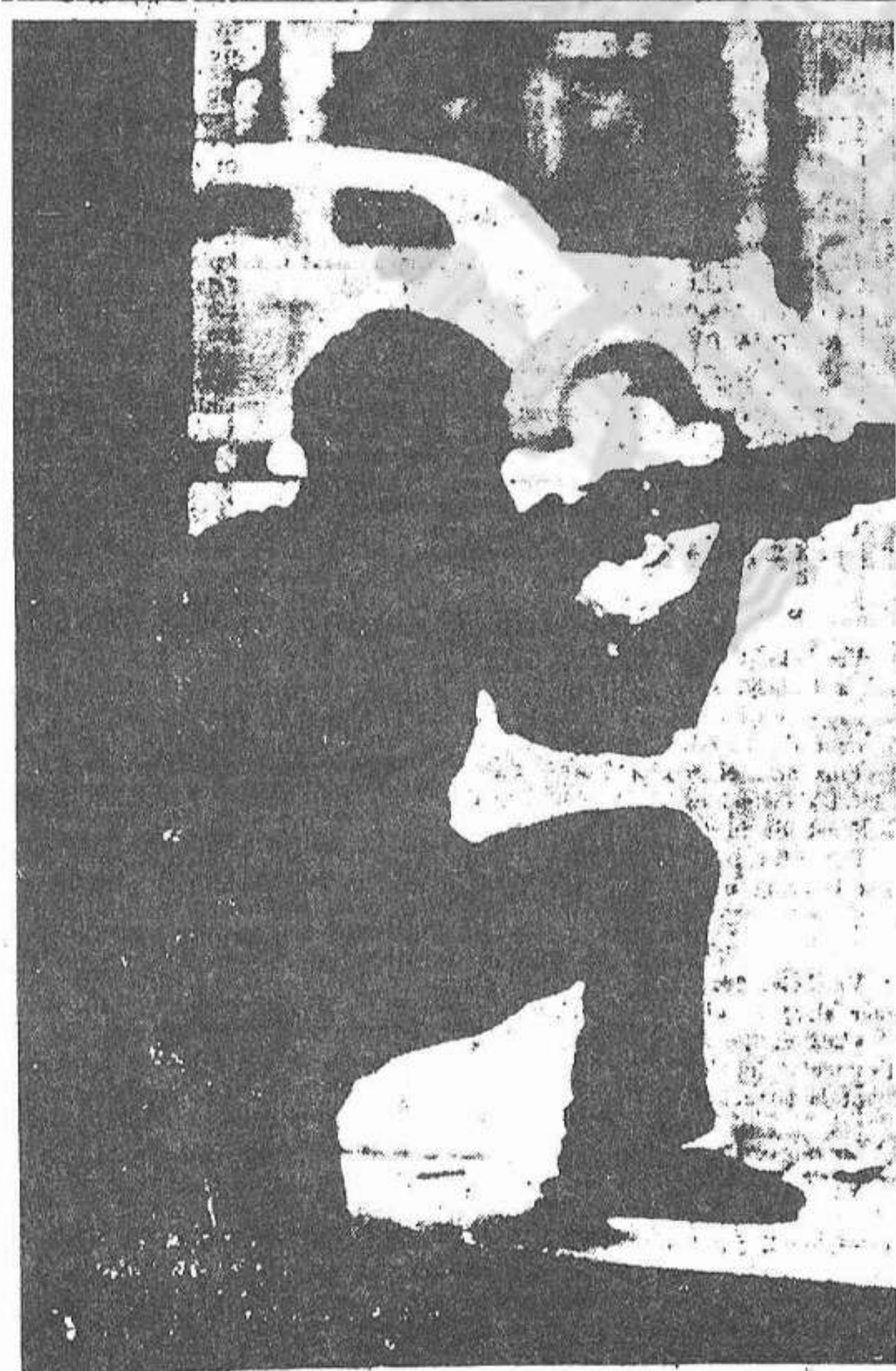
Un dels molts herois anònims que ha donat la nostra classe treballadora

El Butlletí Oficial de la Generalitat d'avui publica, entre altres, els decrets i ordres següents: Ordre creant una Comissió de Pressa a tot Catalunya per exercir el control de totes les empreses periodístiques, i nomenant Comissari el Sr. Joaquim Vilà i Bissà. Decret creant la Comissaria General de la Banca, per mitjà de la qual el Govern de la Generalitat interdirà el funcionament de la Banca privada que opera a Catalunya. Decret disposant que l'Escola Normal de Mestres i Mestresses de la Generalitat es faci càrrec de tots els centres d'ensenyament confessional de Catalunya per tal d'habilitar-los per a escoles del poble. Decret en virtut del qual la Generalitat de Catalunya s'apropia tots els materials i objectes d'interès pedagògic, científic, artístic, històric, arqueològic, bibliogràfic i documental que hi hagi als edificis o locals afectats pels actuals esdeveniments. Ordre disposant que el Rector de la Universitat Autònoma de Catalunya es faci càrrec de tots els centres d'ensenyament que constitueixen el Districte Universitari, als efectes del manteniment de l'ordre, la disciplina i bon funcionament d'aquella centre.