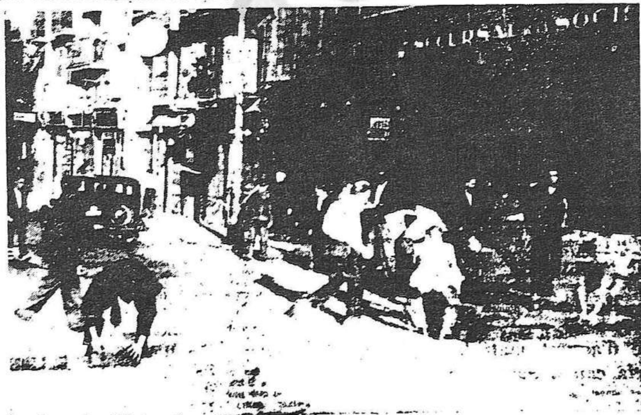
Tot just s'havien engegat els primers trets, el poble començà a aixecar barricades al carrer de l'Hospital i a la Rambla