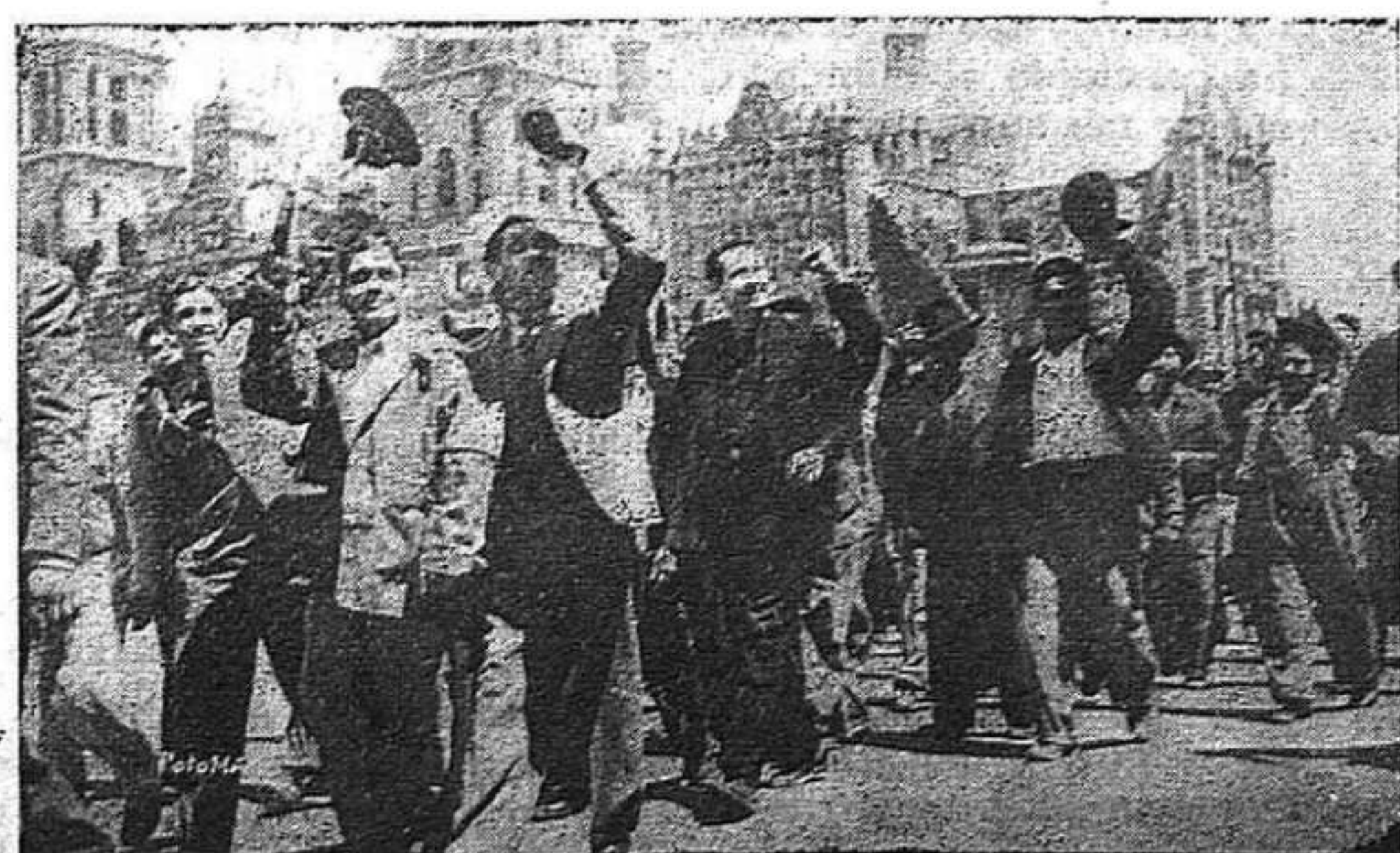
Un aspecto de la manifestación del Primero de Mayo en la ciudad de México.

Tiempo perdido. ¿Para qué tanta zarandaja, fruto del saqueo de un manual cualquiera? En fin de cuentas, es el pueblo español quien "dará la hora".