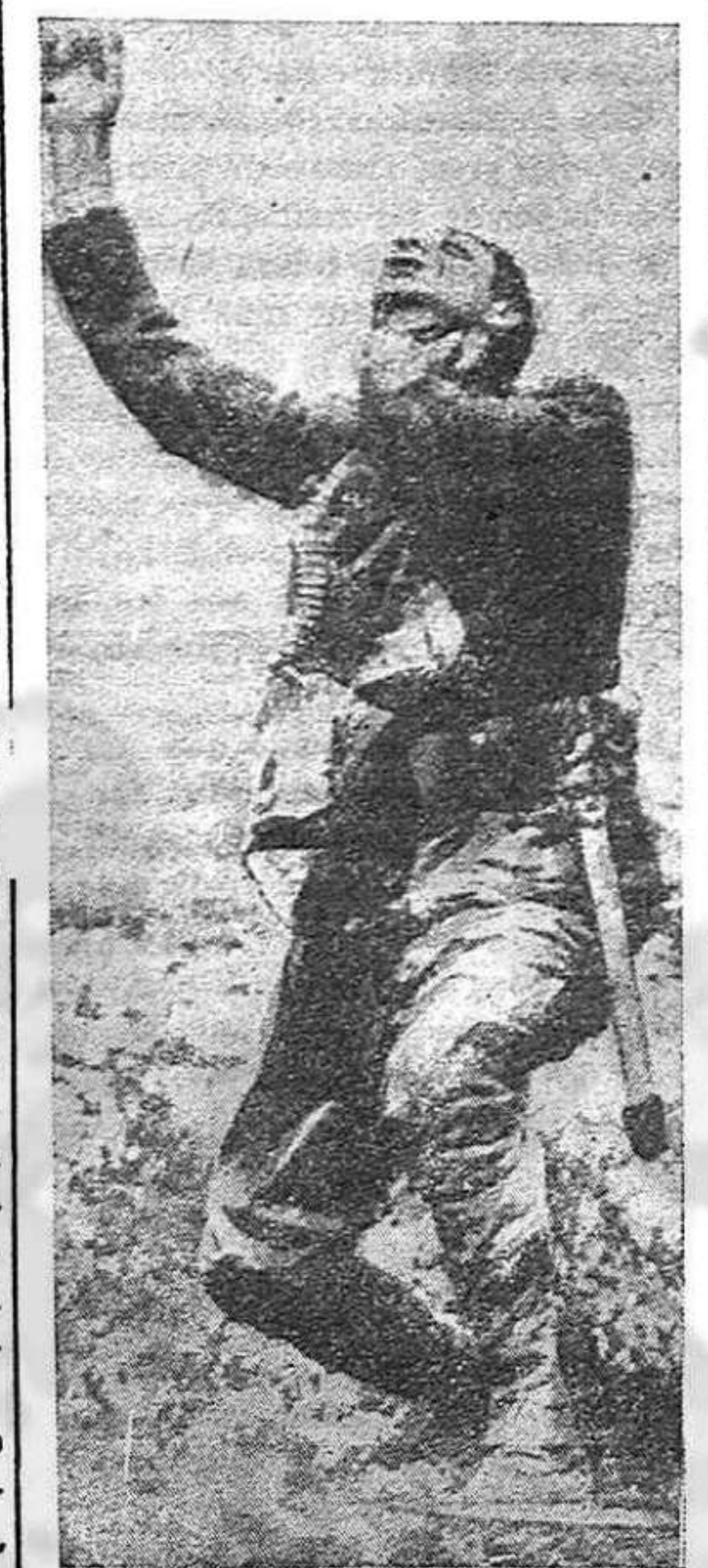
Aún no ha habido grandes combates, pero la tierra ya está roja de sangre de los caídos.

Pero la burguesía, sirviéndose de sus lacayos los Blum, los Jouhaux,