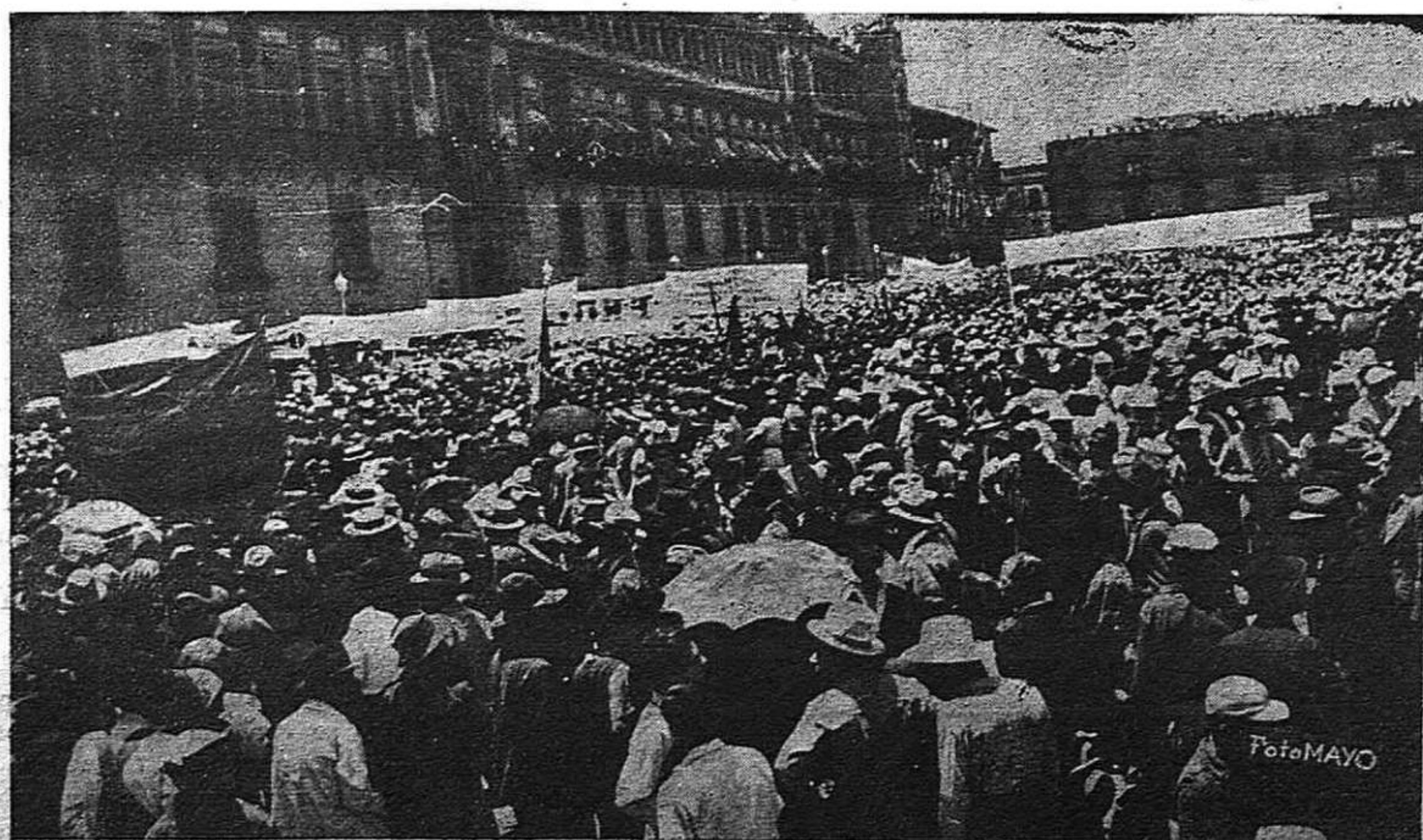
Todo el pueblo de México manifestó el Primero de Mayo con fervor y entusiasmo. He aquí la gran manifestación a su paso frente al Palacio presidencial.

En la página 5.a Texto íntegro del Manifiesto dirigido por la Internacional Comunista A todos los trabajadores del mundo en el Primero de Mayo