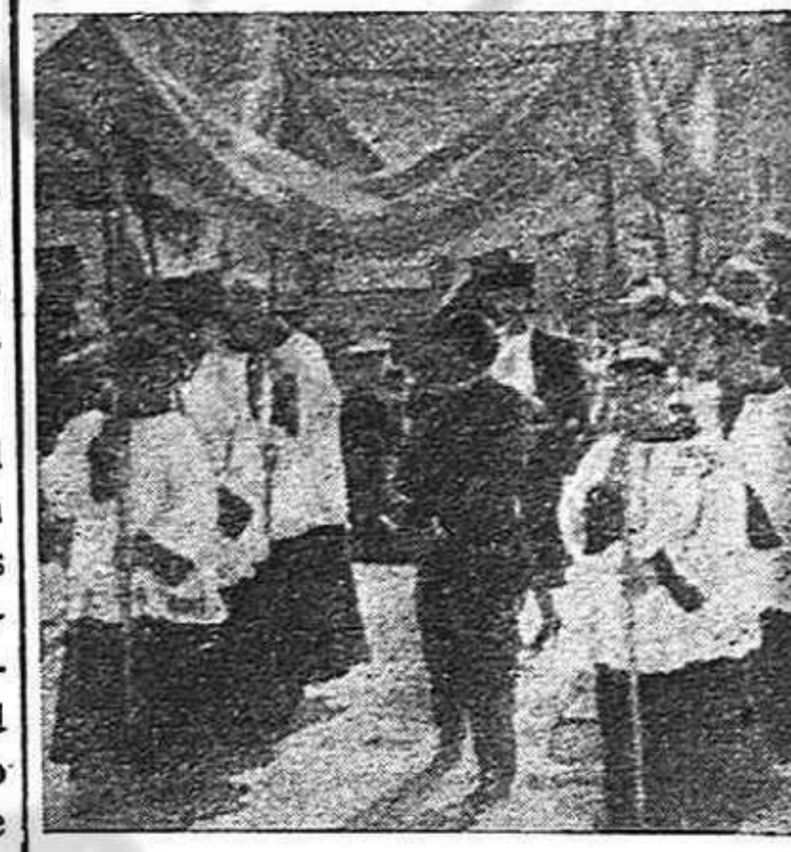
He aquí un aspecto de la España que están haciendo los frailazos.

El miedo al fascismo y a la invasión extranjera, de los que con más energías y fervor habían luchado contra el uno y contra la otra, se había agigantado junto al odio de siempre. El sueño permanecía alejado de los sentidos, pendientes únicamente de lo que pudiese aún ocurrir o de la llegada del día. Todavía hay quien se suicida, y quien, sin llegar a eso, se ha visto presa de la locura, entre el choque de la muerte presentida y el deseo de conservar sus vidas jóvenes.