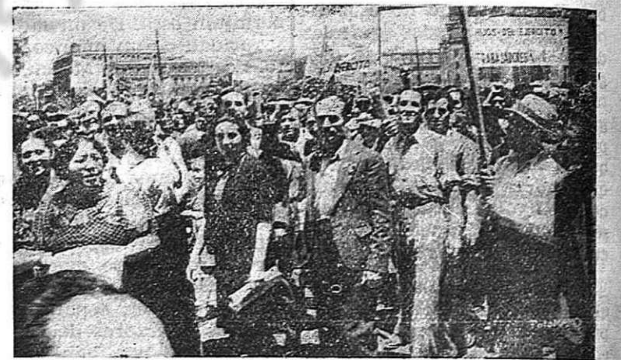
La manifestación del Primero de Mayo a su paso por el Zócalo, en la ciudad de México.

Claro que el sistema que en los primeros momentos dió cierto resultado, comienza a fallar ya, porque los trabajadores conocen a estos soplones hasta en el olor, y además se ayudan con su gran arma: la solidaridad.