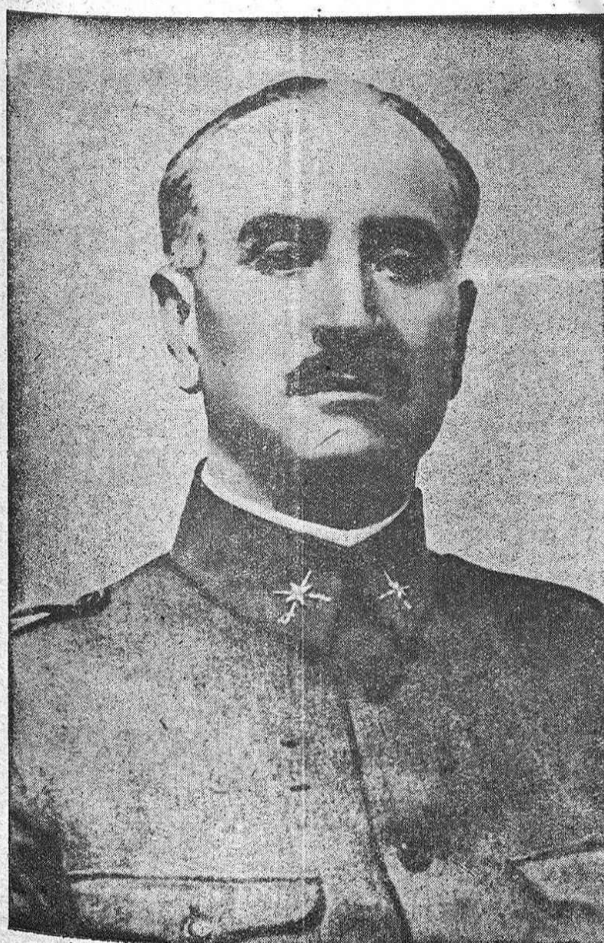
QUEIPO DE LLANO