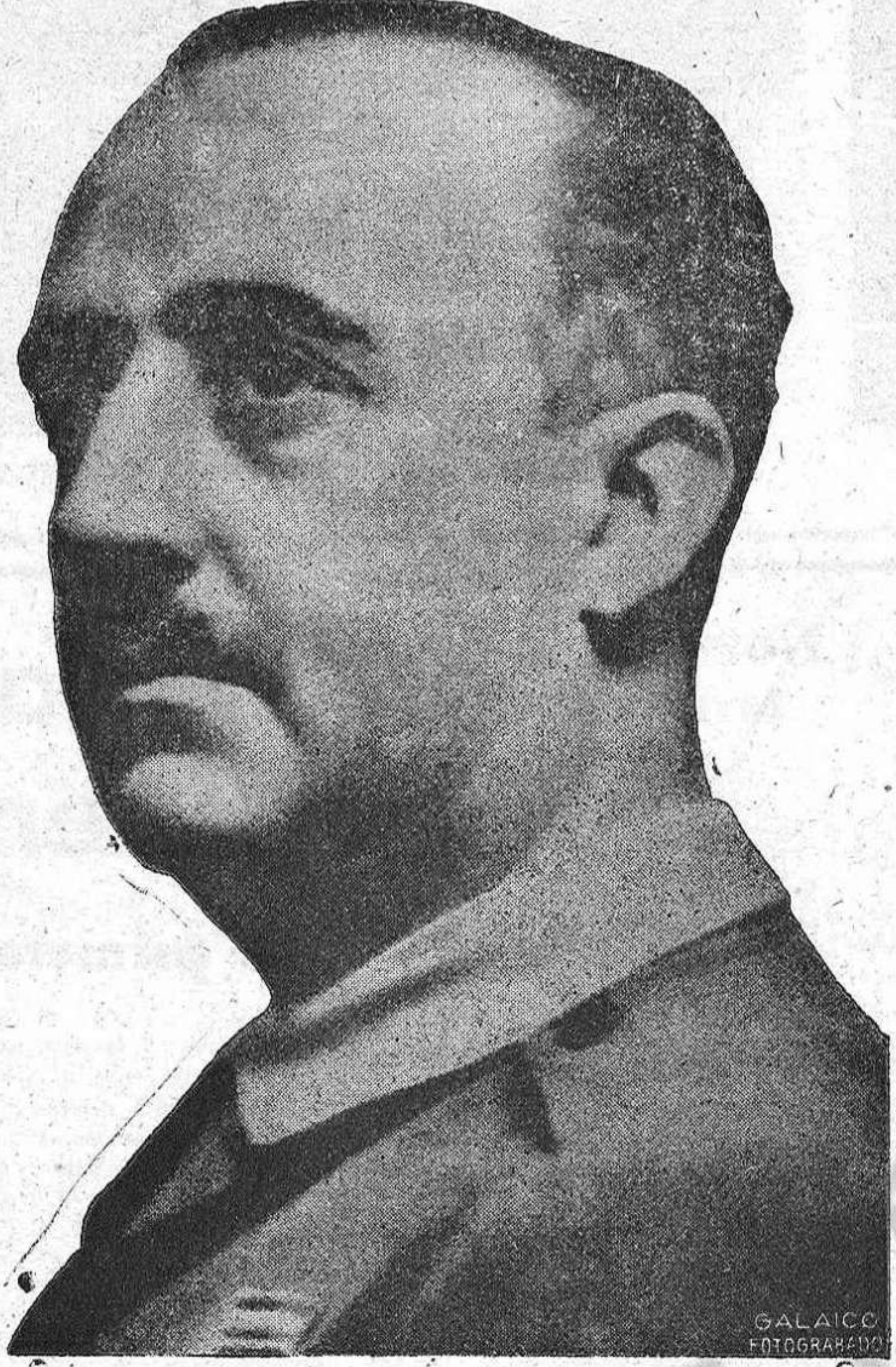
En este día glorioso de intensa emoción hispánica la atención del mundo escucha absorta la triple voz unánime de ¡FRANCO! ¡FRANCO! ¡FRANCO!