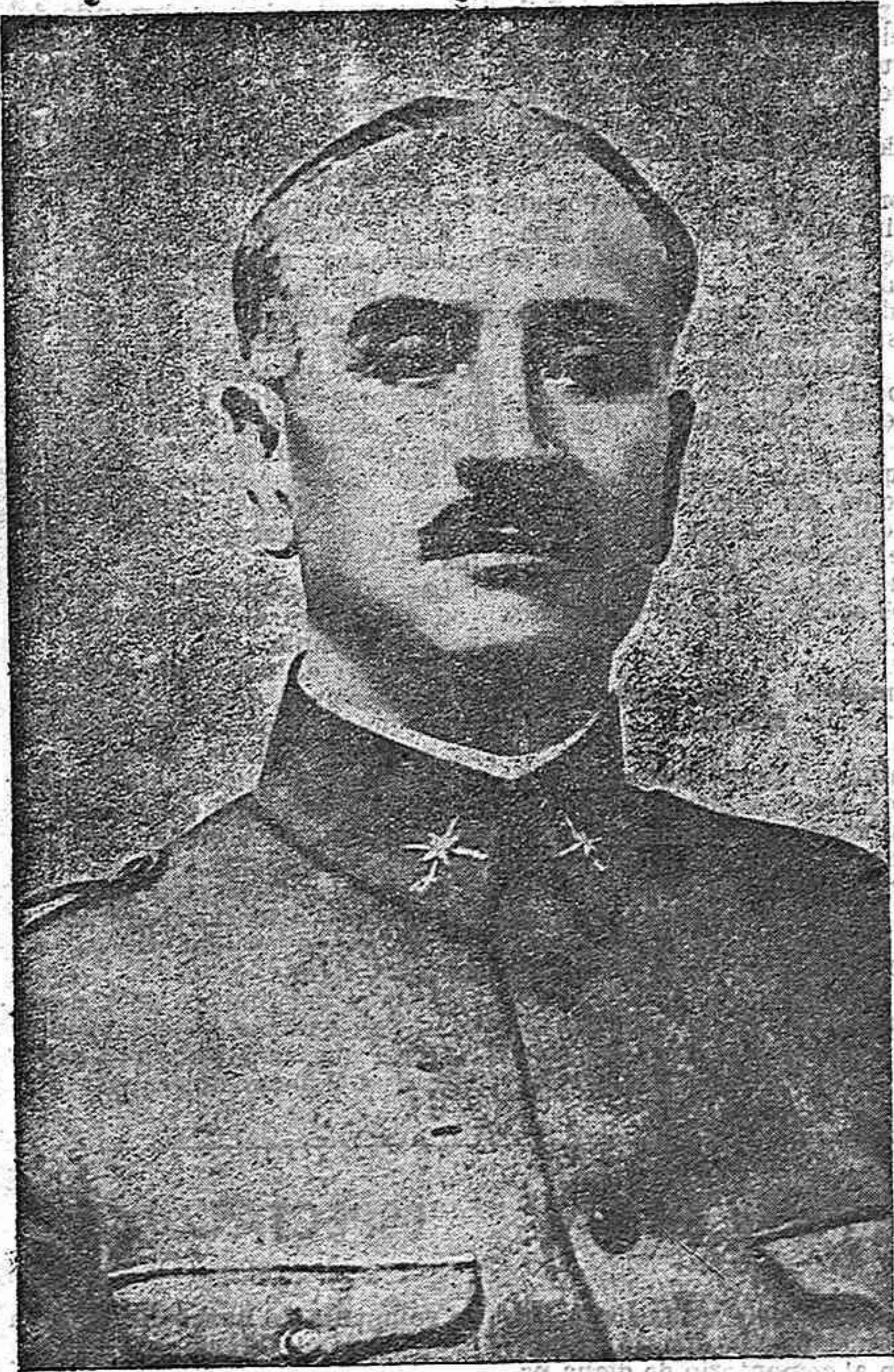
QUEIPO DE LLANO