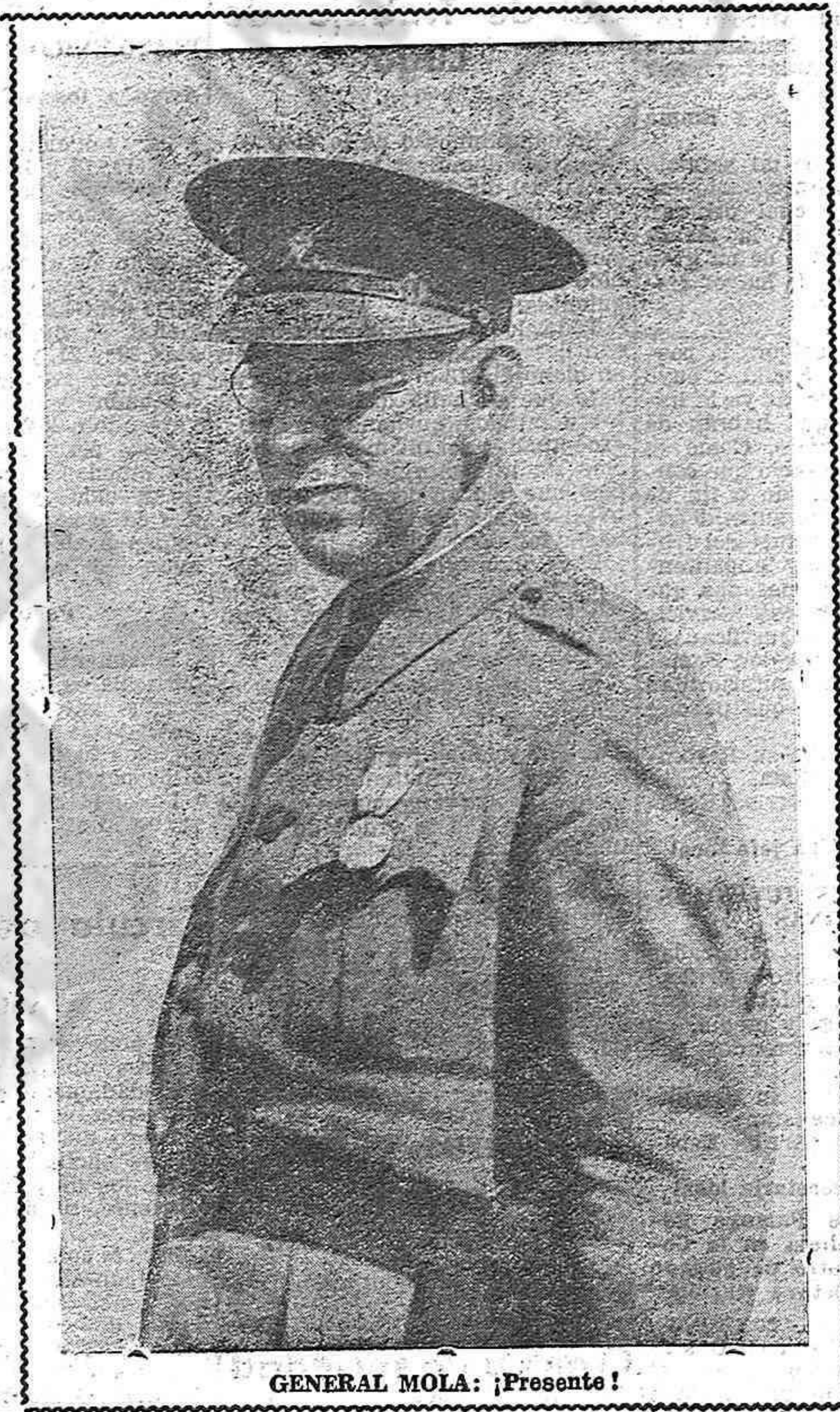
GENERAL MOLA: ¡Presente!