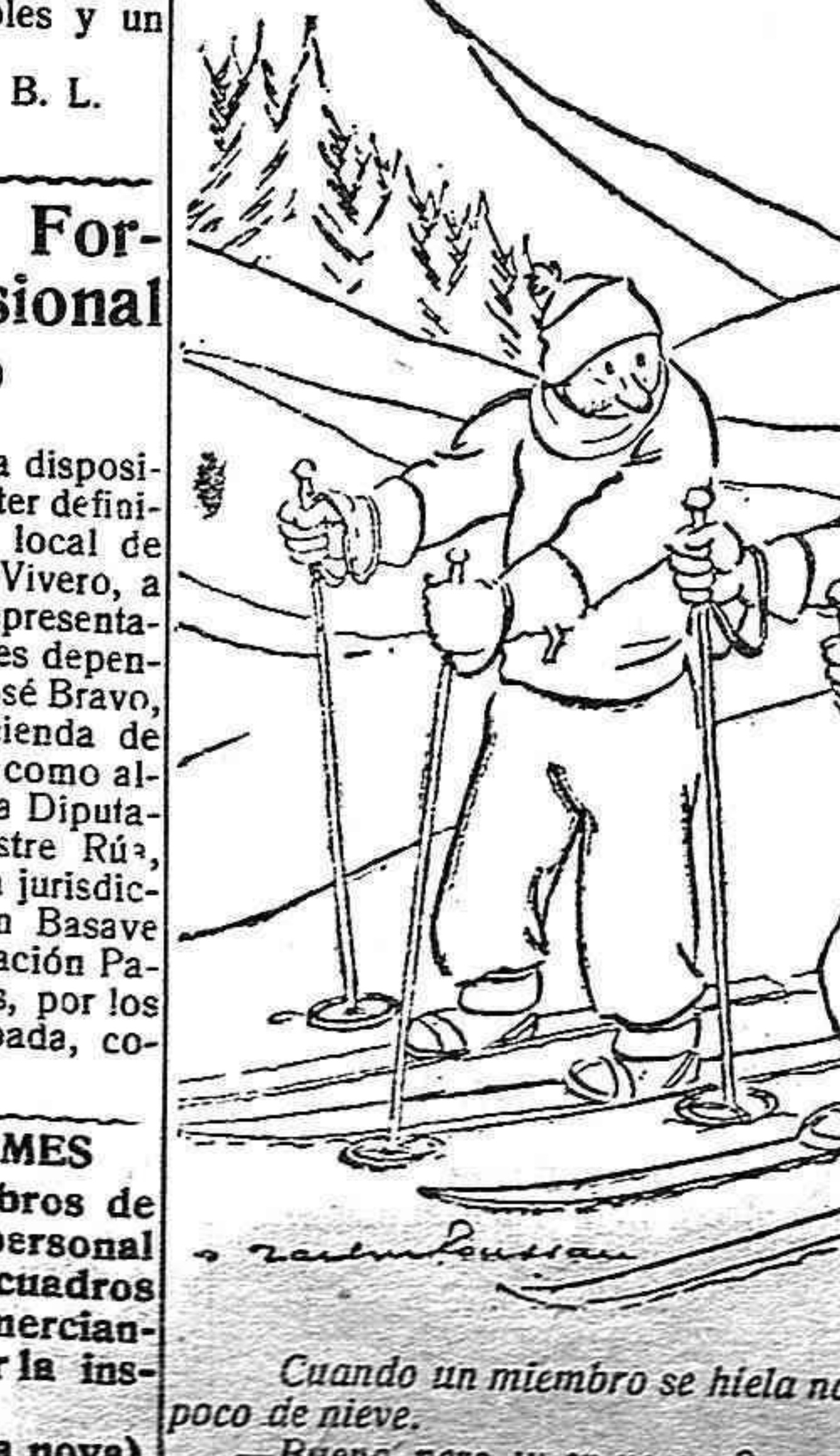
Cuando un miembro se hiela no hay más que frotarlo con un poco de nieve. — Bueno, pero ¿y en verano?

Por el ministerio del Trabajo se ha publicado un Orden disponiendo que por el servicio de acción social del ministerio, se recopilarán los datos y antecedentes que existan sobre legislación social en materia de casas baratas y económicas y proponiendo las modificaciones que se estimen convenientes para la tramitación de los expedientes oportunos y que por el Patronato de política social, inmobiliaria del Estado, se estudie y formule un proyecto razonado de reforma de la legislación vigente sobre dicha materia.