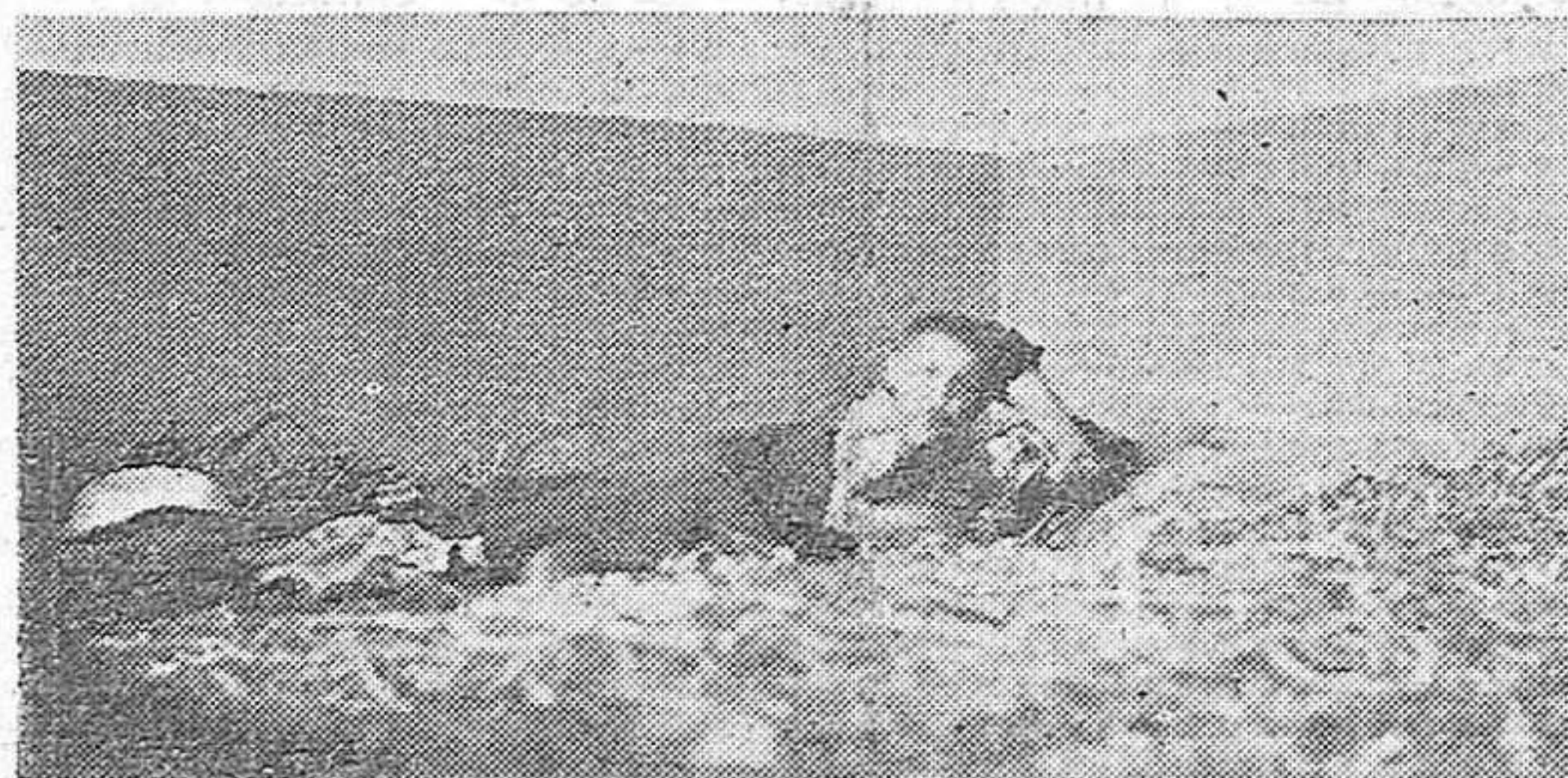
He aquí este niño, acostado sobre paja y algún trapo sucio, única cama de que disponen los infortunados seres que habitan los campos de concentración.