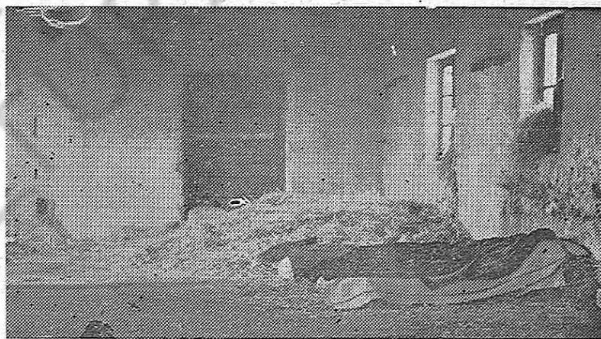
Este es otro de los albergues de que disponen en los campos los refugiados españoles. Es bochornoso que Francia, país de tradicionales libertades, no mejore esta espantosa realidad.

España, Partidos políticos y organizaciones democráticas que impatan con la gran causa del pueblo español, a hacer llegar hasta el Dr. Frugoni, su expresión de solidaridad con el proyecto que dicho diputado ha presentado a la Cámara.