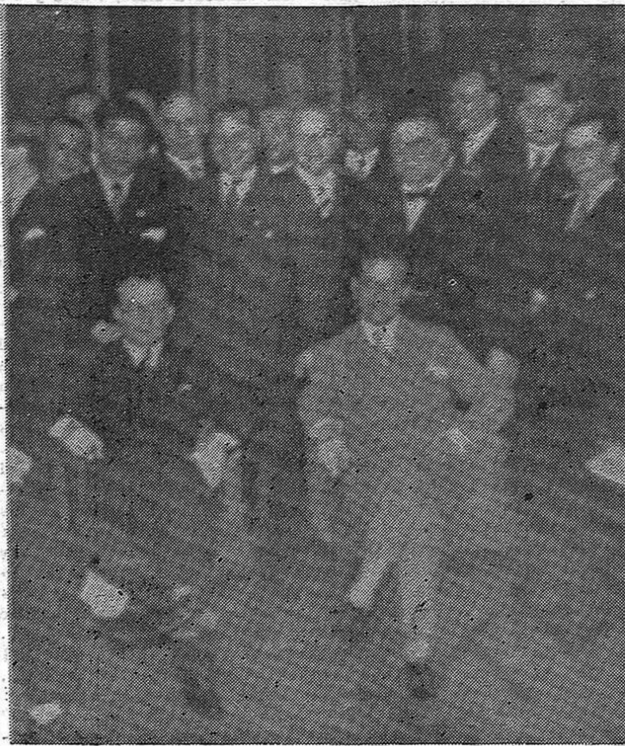
Este es el siniestro personaje al servicio de la penetración nazi en nuestro país