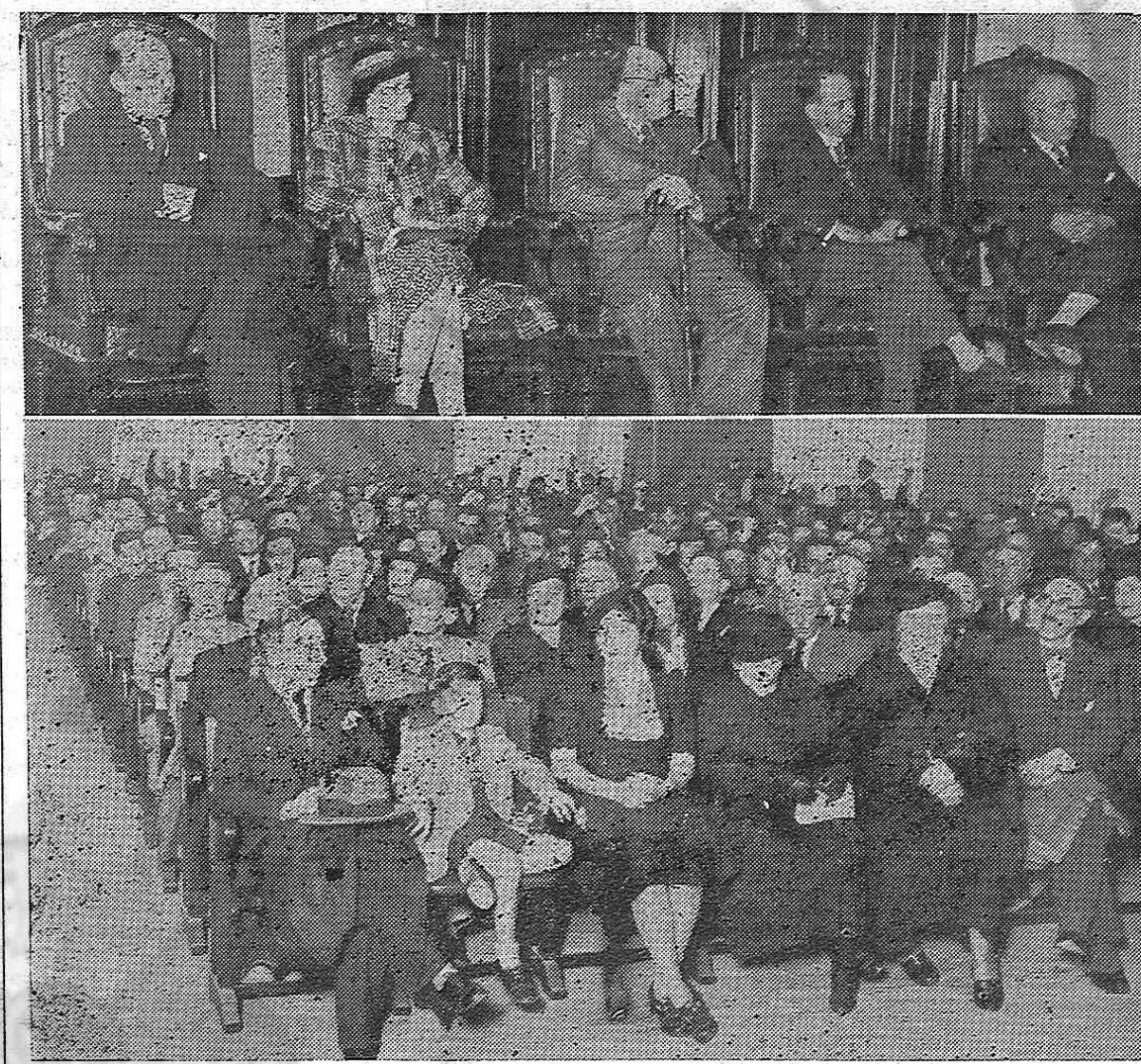
La fecha ilustre del Día de España fué conmemorada por los organismos de Ayuda, con un acto público en el Ateneo, que alcanzó gran éxito. Las fotos ilustran de la importancia de este acto