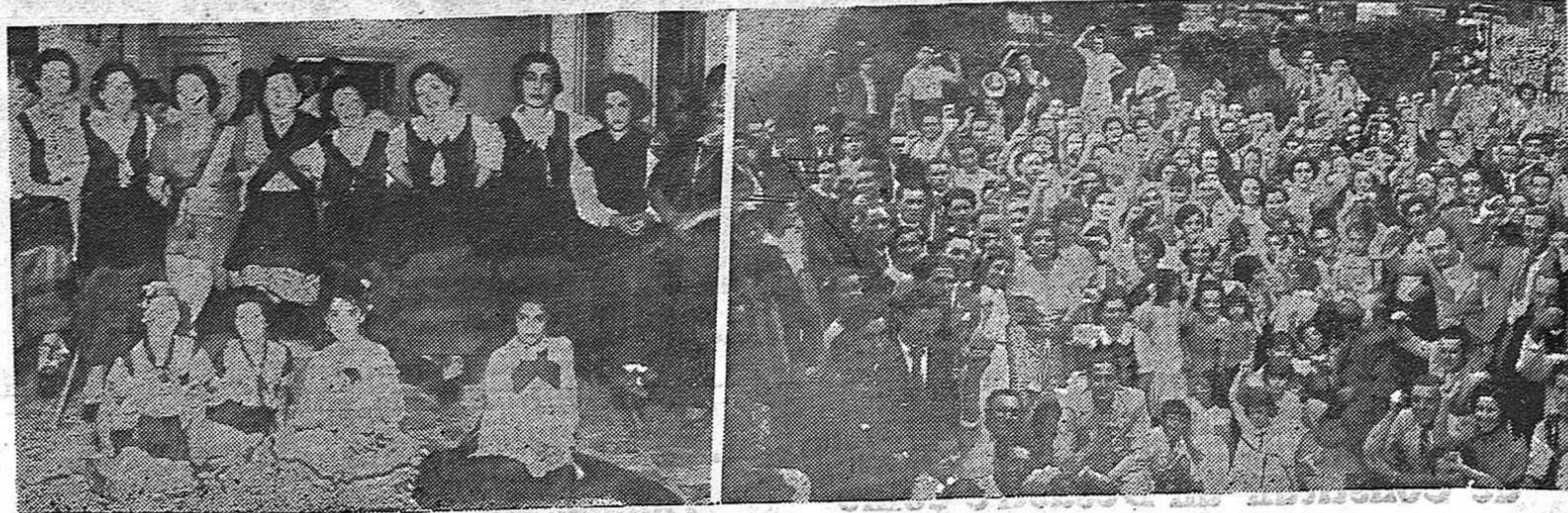
Como habíamos anunciado, se llevó a cabo el pasado domingo en la quinta del Centro Asturiano, una gran fabada organizada por el Comité de Asturianos Leales a la República Española. Del éxitto de la fiesta, hablan en forma elocuente los fotos que publicamos