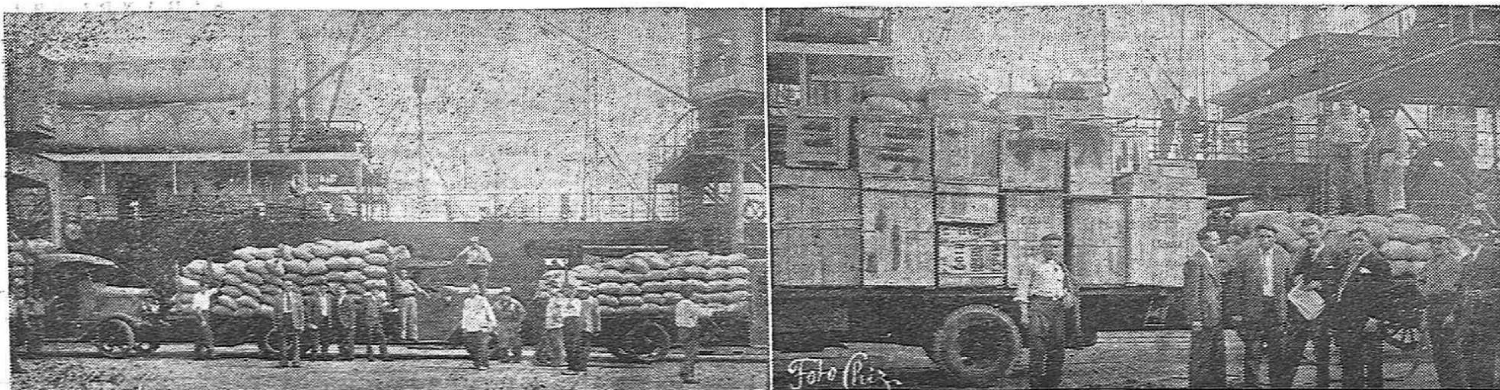
El 16 del Corriente, la Comisión de Campaña de Invierno efectuó un nuevo e importante embarque de ropas y víveres destinados al heroico y sacrificado pueblo español. Componen el embarque a que hacemos referencia, 34 cajones de ropa; 3 cajones de comestibles; 457 sacos de lentejas; 30 sacos de arroz; 5 sacos de avena; 2 sacos de porotos y 1 saco de cocoa.