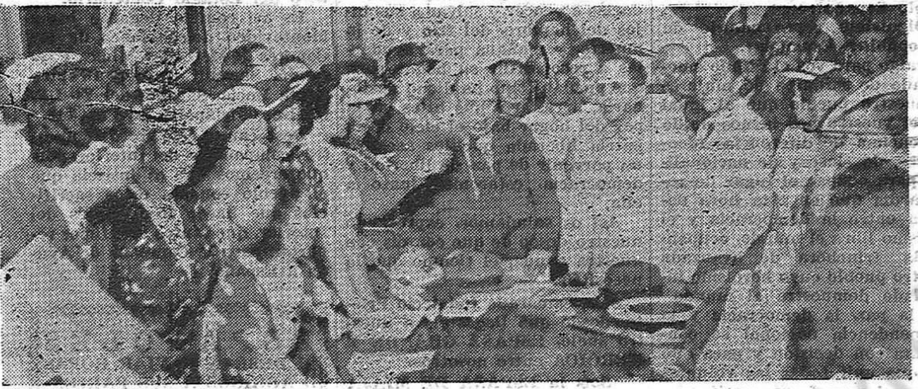
“Casa de España”, visitando por tanto la sede de concurrió durante su estada entre nosotros a Indalecio Prieto, el líder Republicano Español, las Centrales de Ayuda a la República. El Dr. Edmundo Castillo, dió la bienvenida al ilustre visitante en nombre de los Comités, respondiendo el Sr. Prieto con un vibrante y emocionado discurso