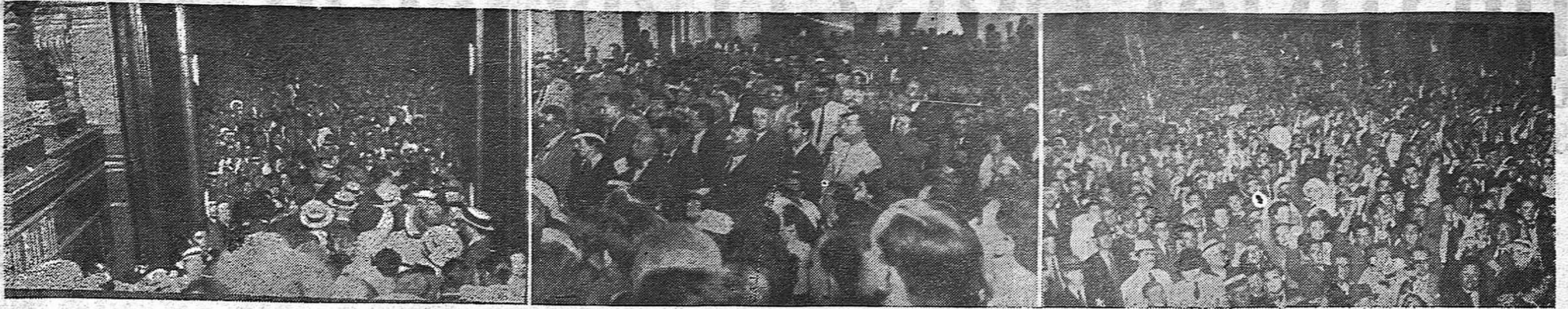
Fálido reflejo de lo que fué el formidable acto del Ateneo, dan estas tres vistas de público congregado en las salas, escaleras, hall de entrada y alrededores del local, ansioso de escuchar la palabra del gran tribuno republicano