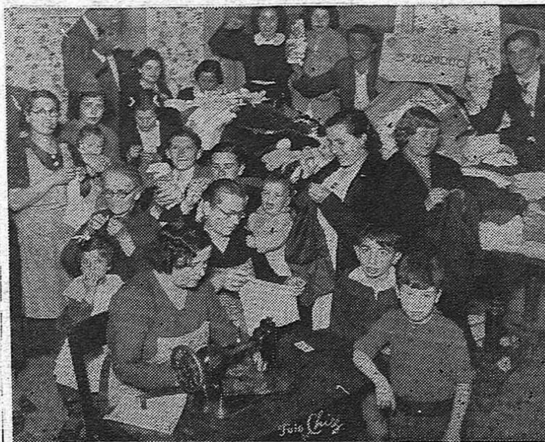
Las mujeres del Comité 5.º Regimiento, trabajan intensamente en el costurero de su local, preparando ropas para la Campaña de Invierno