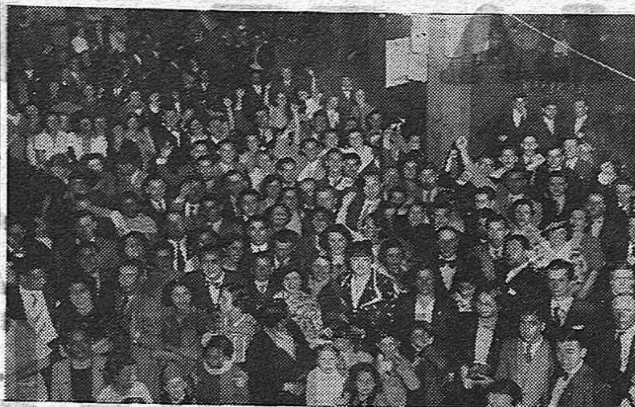
Una vista del público asistente al festival realizado el domingo por el círculo "El Progreso"