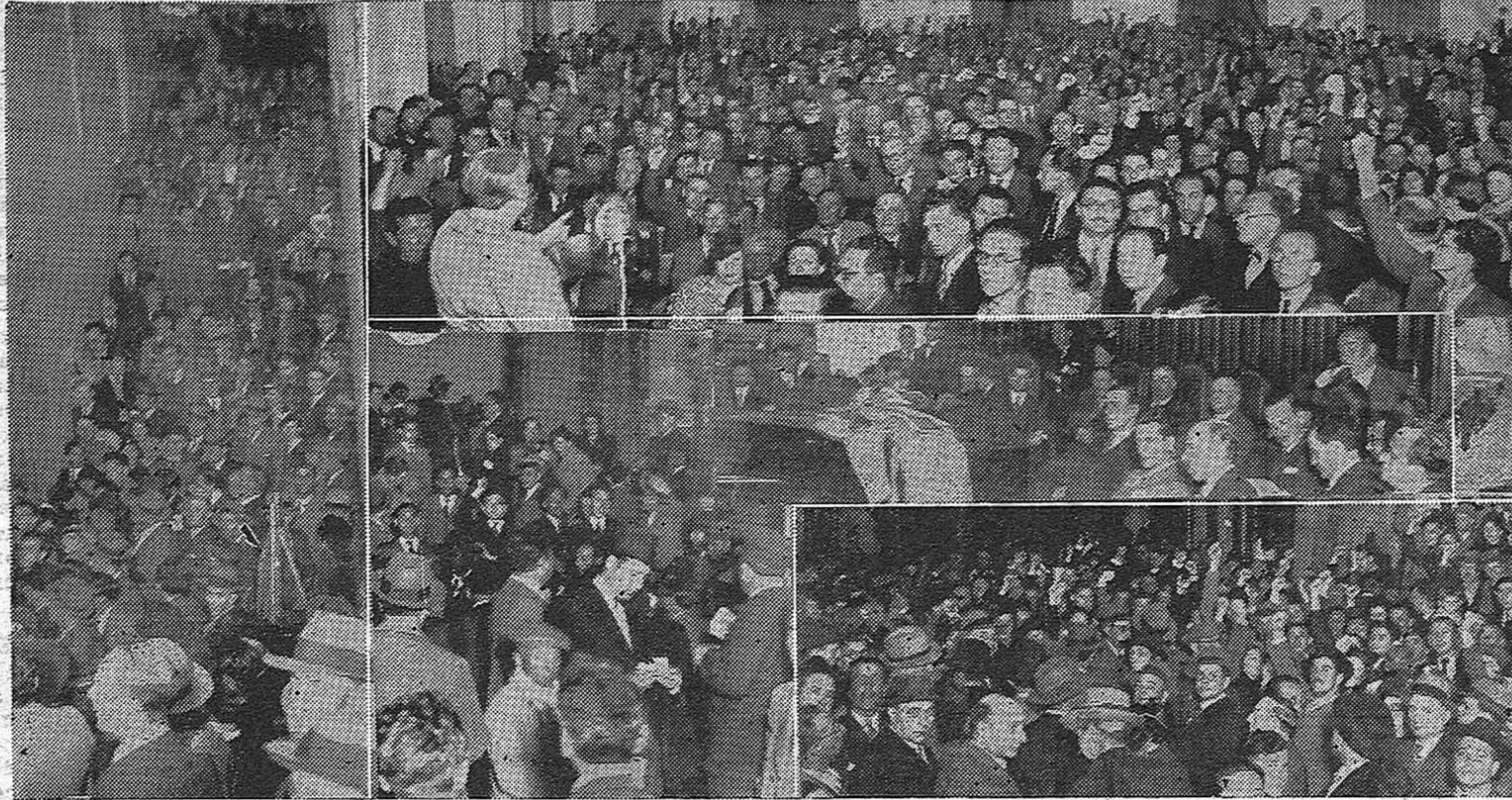
Organizado por el Instituto de Investigación Científica contra el Racismo, el Fascismo y el Antisemitismo, realizóse en el Ateneo de Montevideo, un gran acto de reprobación a los procedimientos adoptados por el nazismo alemán, contra los judíos. Una enorme concurrencia llenó totalmente el local del Ateneo, manifestando sin lugar a equívocos su repudio a los bárbaras medidas de Hitler y sus adláteres. En las notas gráficas que insertamos, pueden apreciarse distintos aspectos de la concurrencia: Arriba, la sala repleta de público, en el momento en que se pronuncian los discursos; debajo el Estrado, y detalles del hall y puerta del Ateneo; a la izquierda, las escaleras de acceso al salón obstruidas totalm ente por la concurrencia.