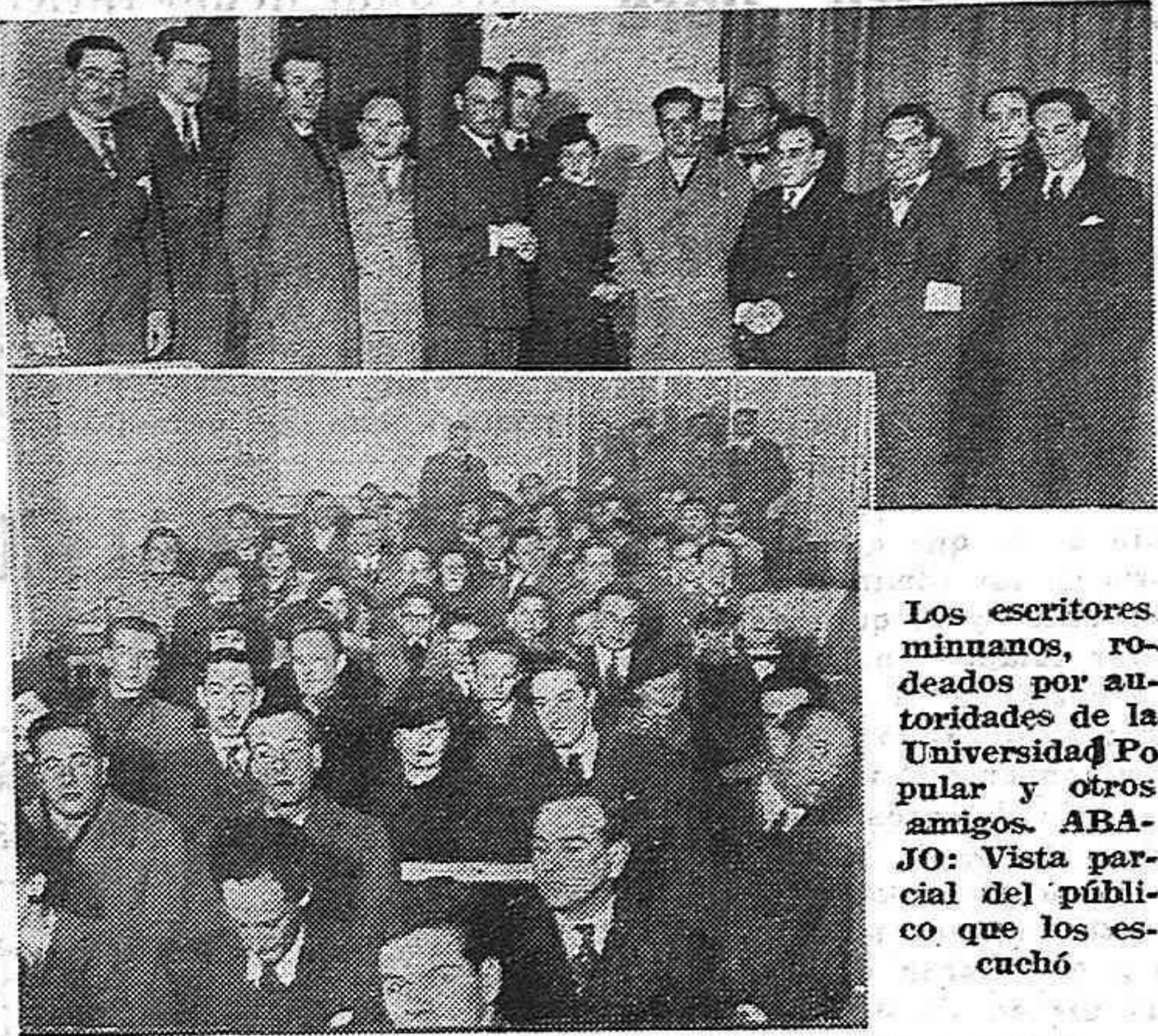
Los escritores minnanos, rodeados por autoridades de la Universidad Popular y otros amigos. ABAJO: Vista parcial del público que los escuchó

Estos dos recios escritores, hermanados por la amistad y por ser minnanos, pronunciaron el sábado último una hermosa conferencia en la Universidad Popular Central.