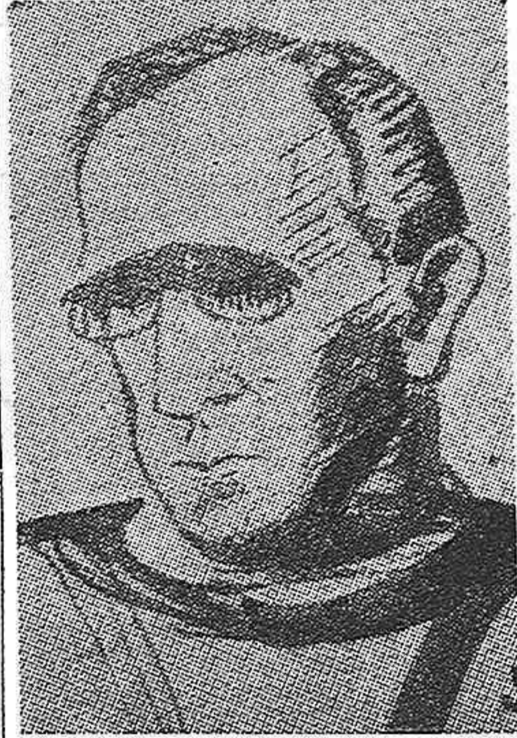
El escritor Justino Zavala Muniz.

via en todas las estancias sin parar en ninguna"; El Mellizo, pequeño, huyendo ante la figura de Muniz; Felisberto Pelo Largo, Feliciano El Callao, Perico El Manco, Fusil... Todos así, clasificados por un detalle físico o moral, sobre la escena íntima del autor, que les quita toda variada exterioridad, y los hace recorcentrados, como embriados por sus propias sombras.