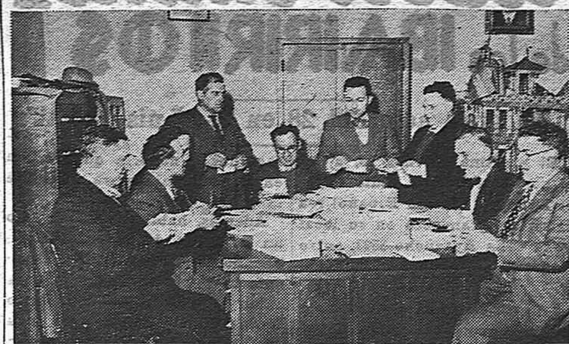
La comisión de propaganda del Comité "Nuevas Orientaciones" trabaja diariamente en la preparación y desarrollo de la jornada electoral...