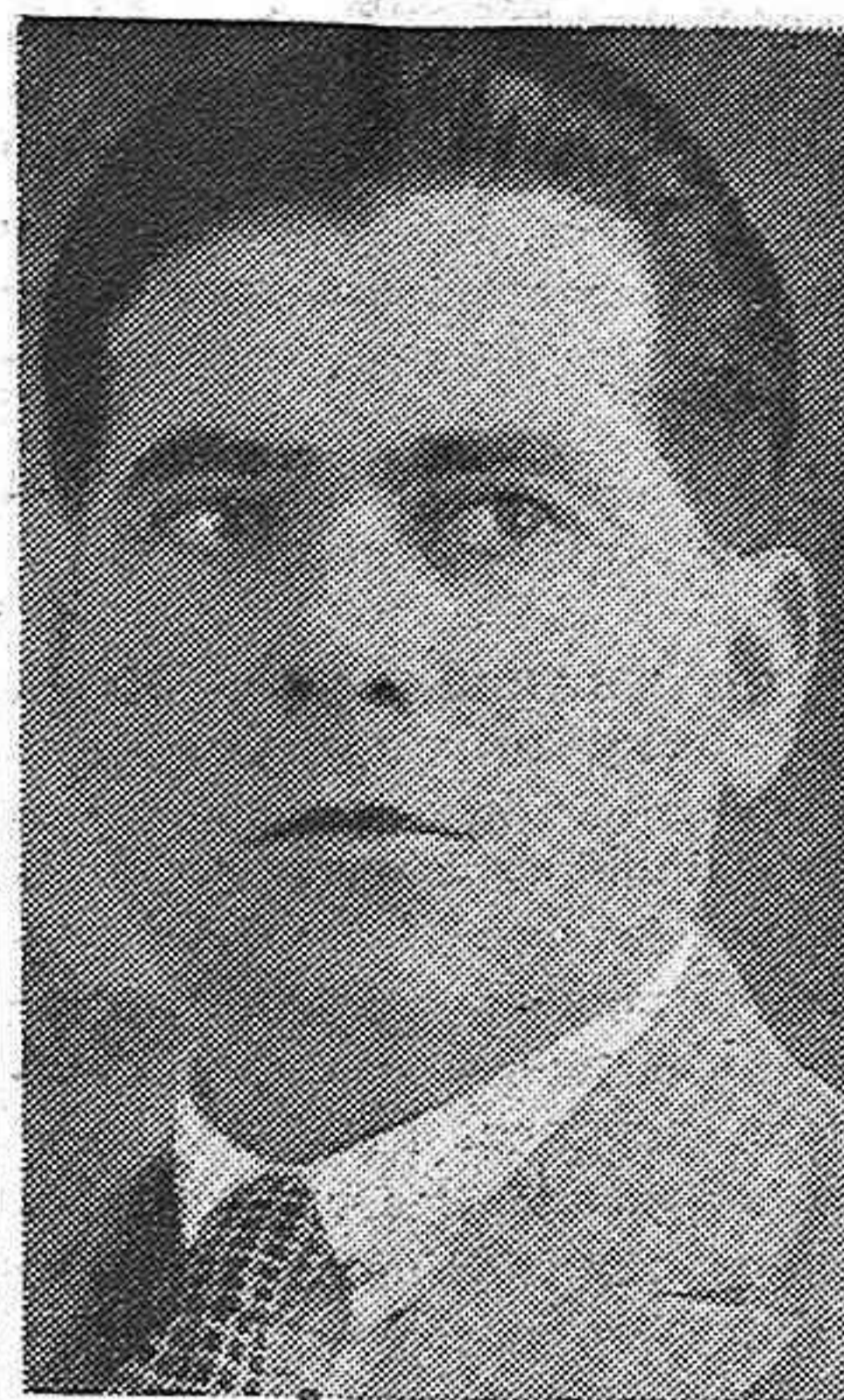
El entusiasta republicano y gran luchador por la defensa de las libertades de su pueblo...