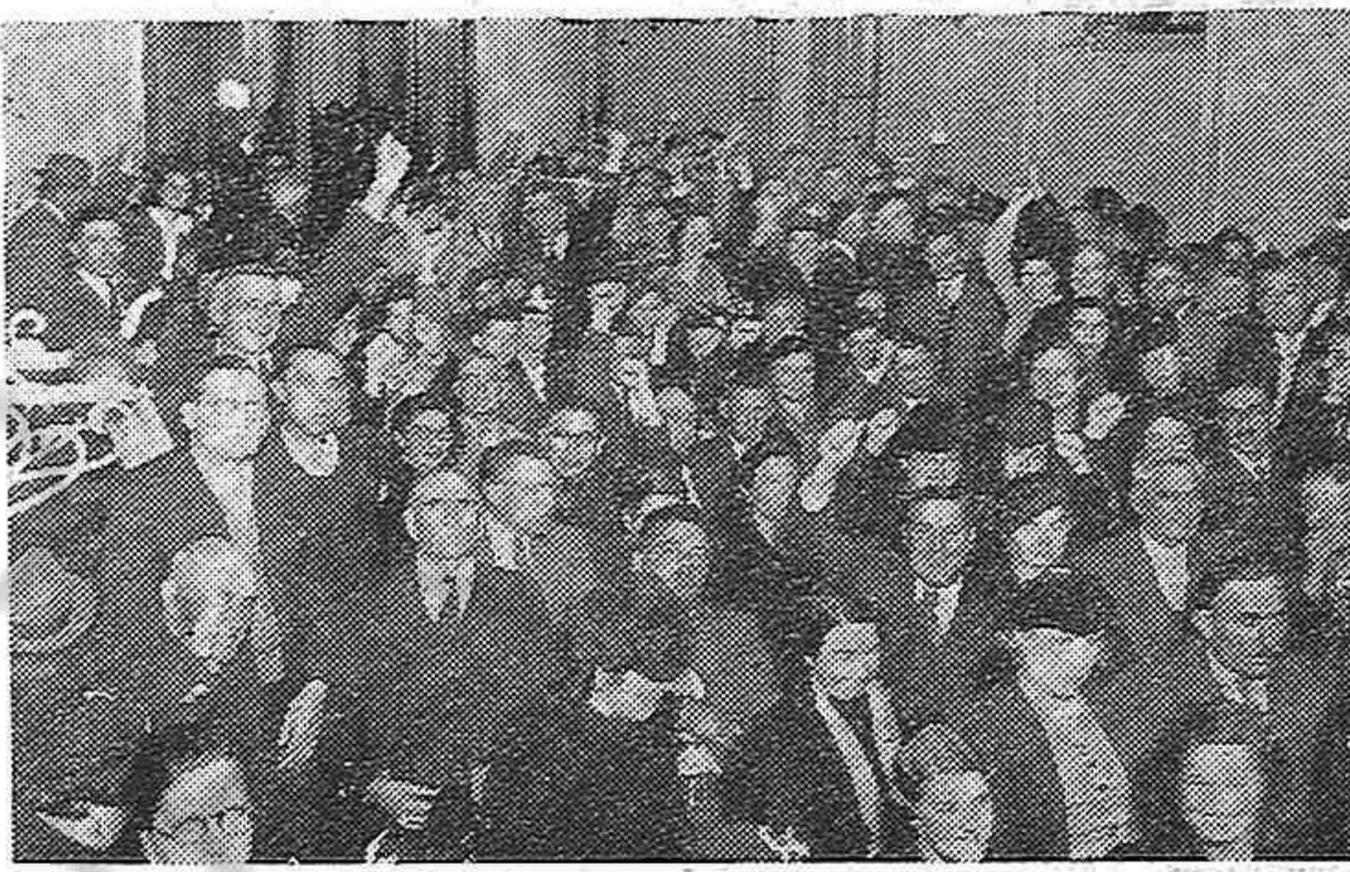
Vista del numeroso público que asistió a la Conferencia dictada por el ex-sacerdote español Marino Ayerra, en Casa de España

todo momento una admirable aportación para la divulgación de la verdad. Por su voz sincera se descorría ante los ojos del emocionado auditorio el torpe telón que ha presentado a Navarra como una provincia casi unánimemente reaccionaria, cuando la realidad histórica presenta casos sublimes de civismo y de sacrificio que hacen de la brava región una de las más martirizadas y que serán el asombro de la posteridad. De quince a diez y seis mil fusilamientos de navarros calcula el Dr. Ayerra que se han efectuado durante el terrible drama, y semejante proporción representa un promedio extraordinario si se compara con su densidad de población. Nuestro honrado y valiente compatriota conserva de su paso por la Iglesia una vastísima cultura clásica que cimienta perfectamente sus convicciones de hombre sereno y estudioso. Todo ello contribuyó al éxito alcanzado el sábado en su notable discurso que se reflejó en los frenéticos aplausos con que fué premiada su labor, y el número de felicitaciones a las cuales ESPAÑA DEMOCRÁTICA une las suyas con los más felices augurios para su entrada en la vida civil que es la vida auténtica de la lucha y de la libertad.