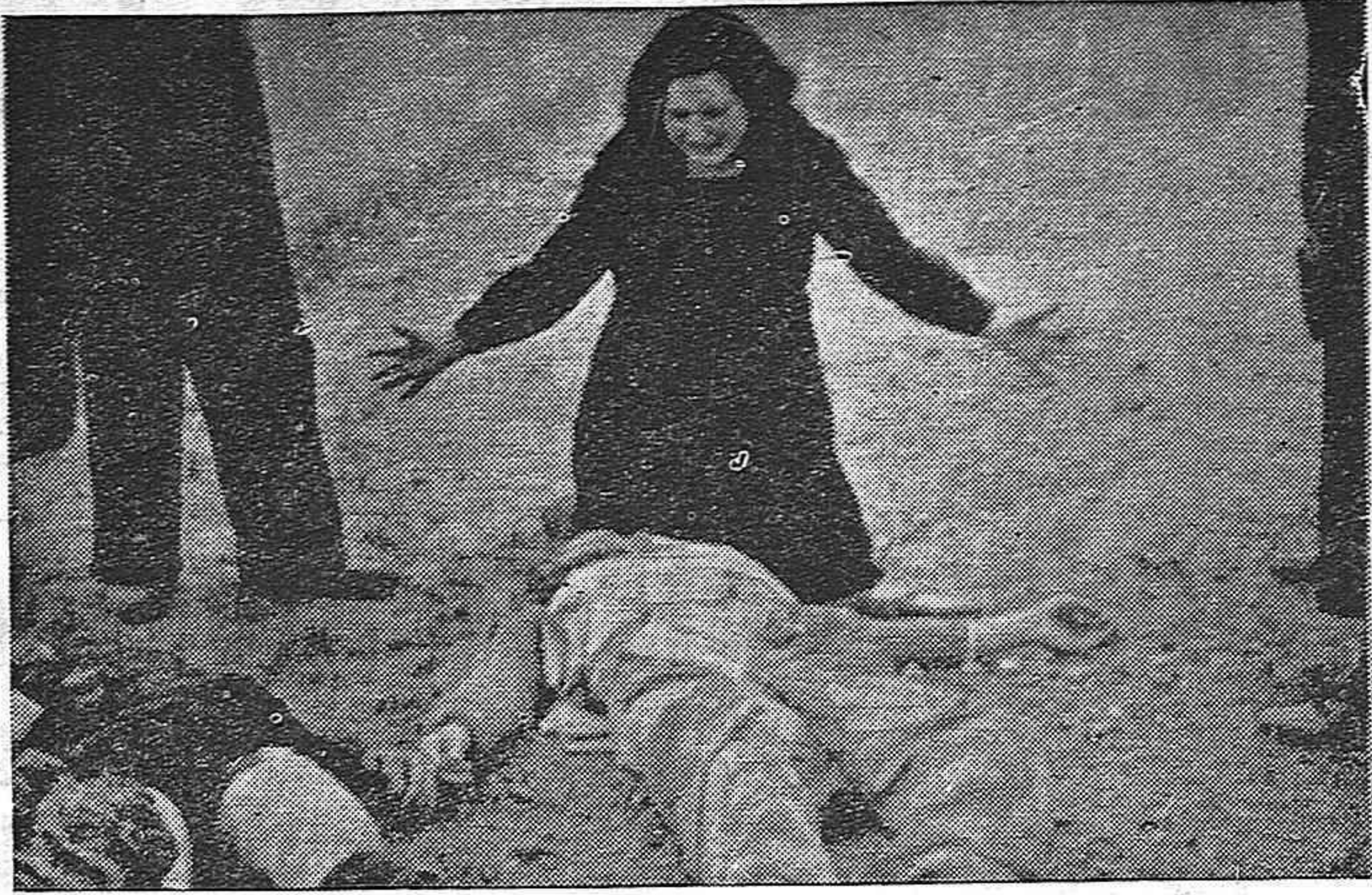
El sangriento terror desencadenado por el franquismo en España continúa intensamente. Millares de republicanos son asesinados por haber defendido a su patria de la invasión extranjera. Escenas como ésta se repiten diariamente en toda España