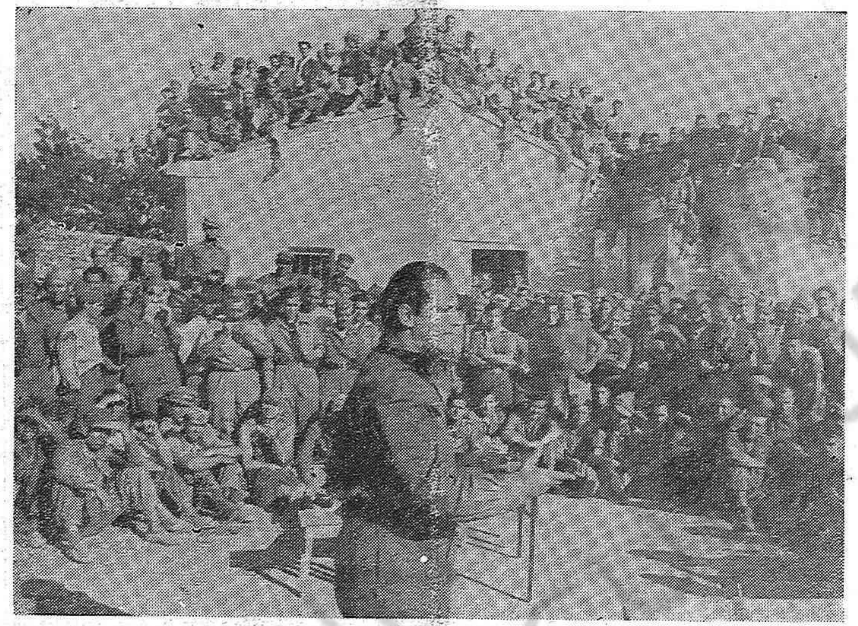
A la lucha heroica del pueblo español se sumaron los poetas, que pronto crearon las magníficas canciones de guerra entonadas por todo el ejército republicano. En la foto vemos a Rafael Alberti recitando cerca del frente.