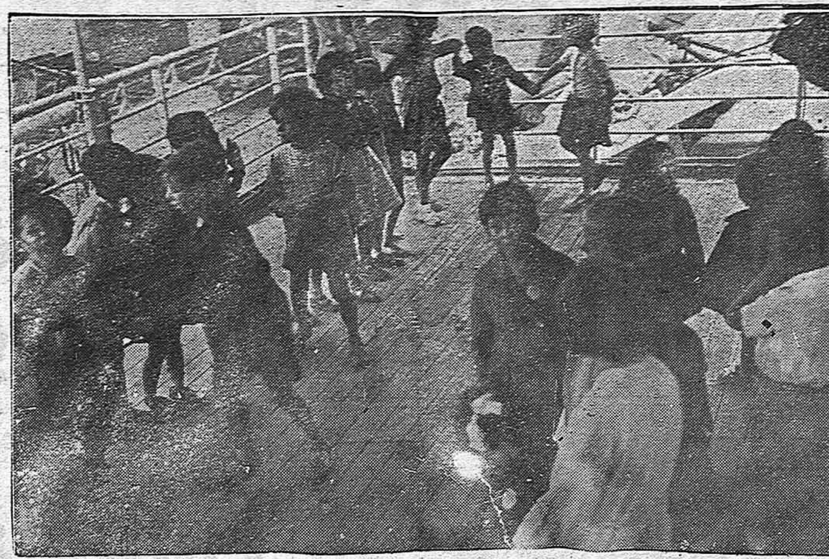
Un grupo de niños españoles de los que embarcaron los movimientos de solidaridad de Argentina, Chile, Colombia y Uruguay, en el "Winnipeg". Juegan en la cubierta del barco felices de viajar a tierras de paz y libertad. Pronto se repetirán estas escenas cuando comiencen los embarques de refugiados españoles a nuestro país.