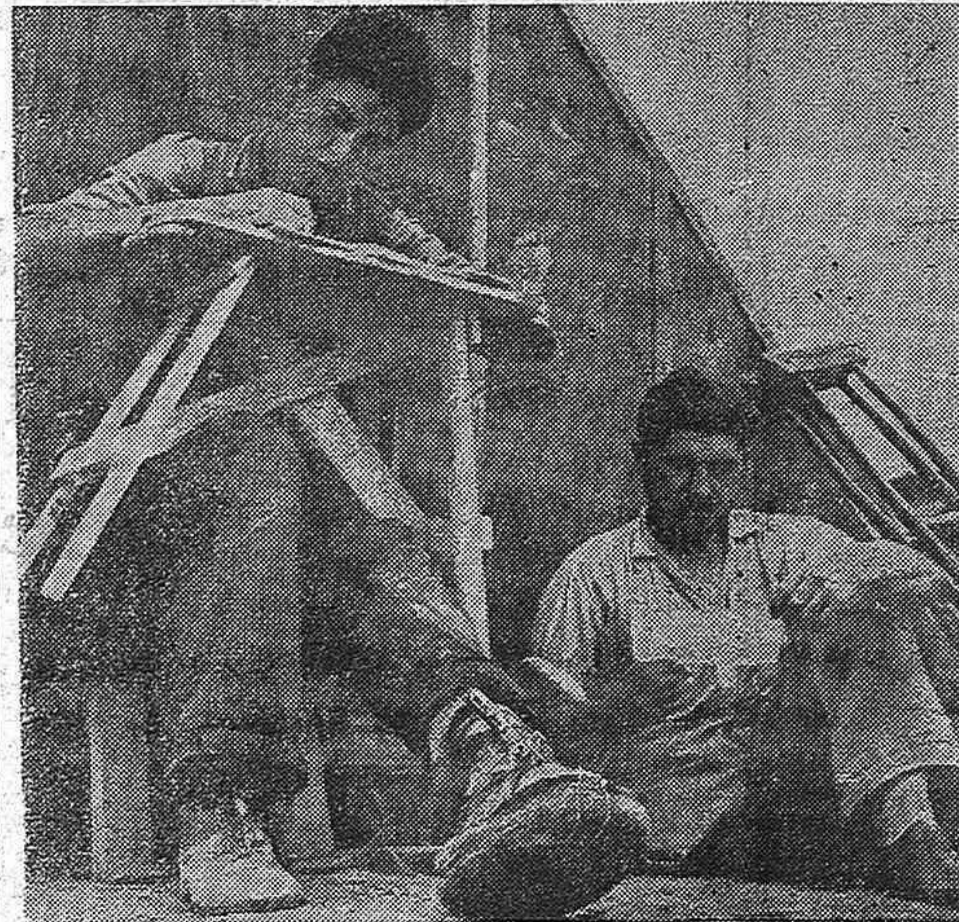
Mutilados españoles estudiando durante las tristes horas de un campo de concentración. Todo nuestro pueblo, en especial la clase obrera organizada, debe acudir de inmediato en socorro de estos heroicos luchadores que desean llegar a América.