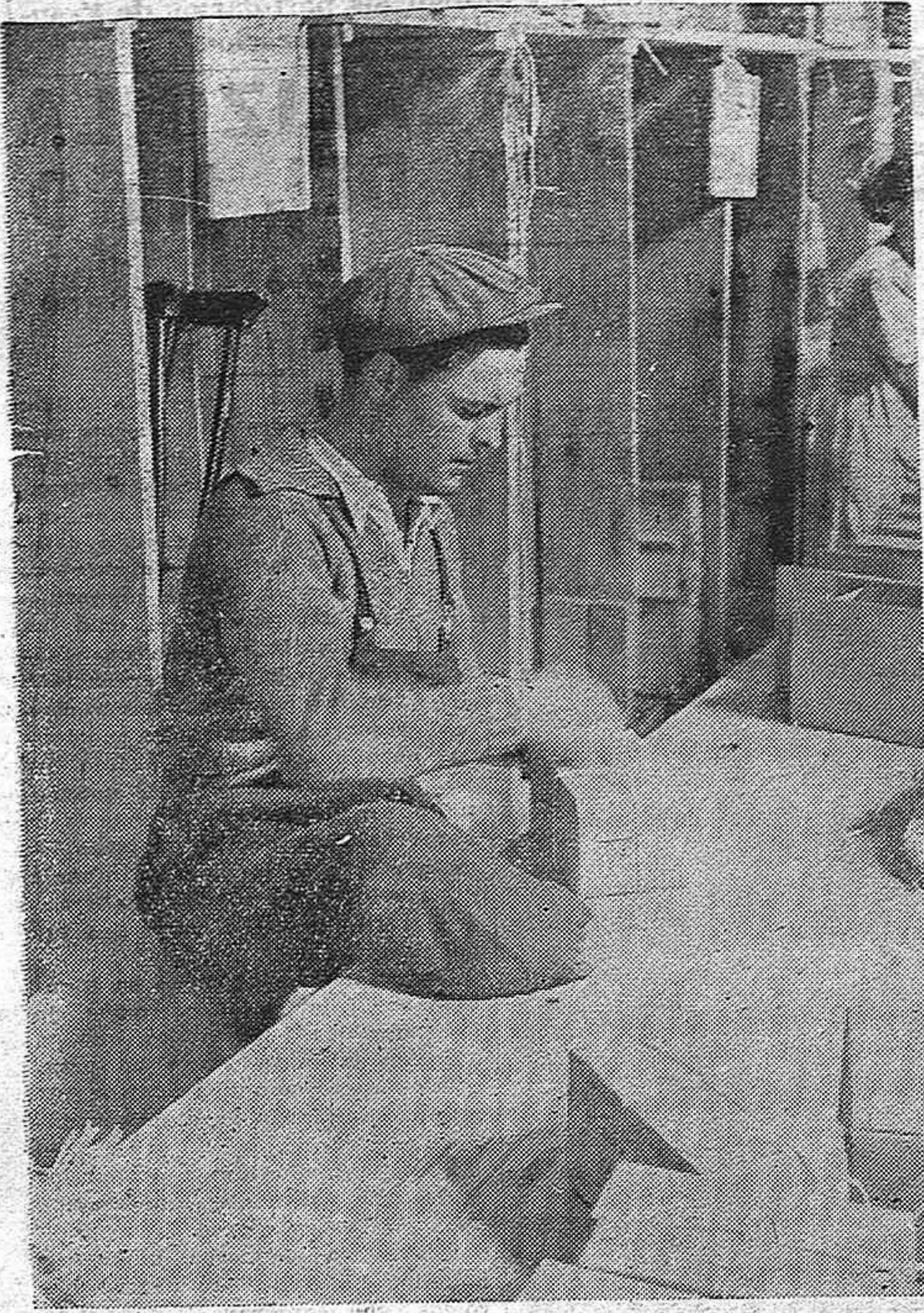
Un mutilado español, trabaja apesar de su invalidez. Estos heroicos combatientes pueden ser devueltos a la vida con la ayuda de todos los hombres de sentimientos en América. Nuestro colaborador Castellote trata en el artículo que publicamos el problema de los 4.000 mutilados españoles que aún permanecen en Francia y que esperan ansiosos la ayuda de América. (Lea Nota en la Página 8)