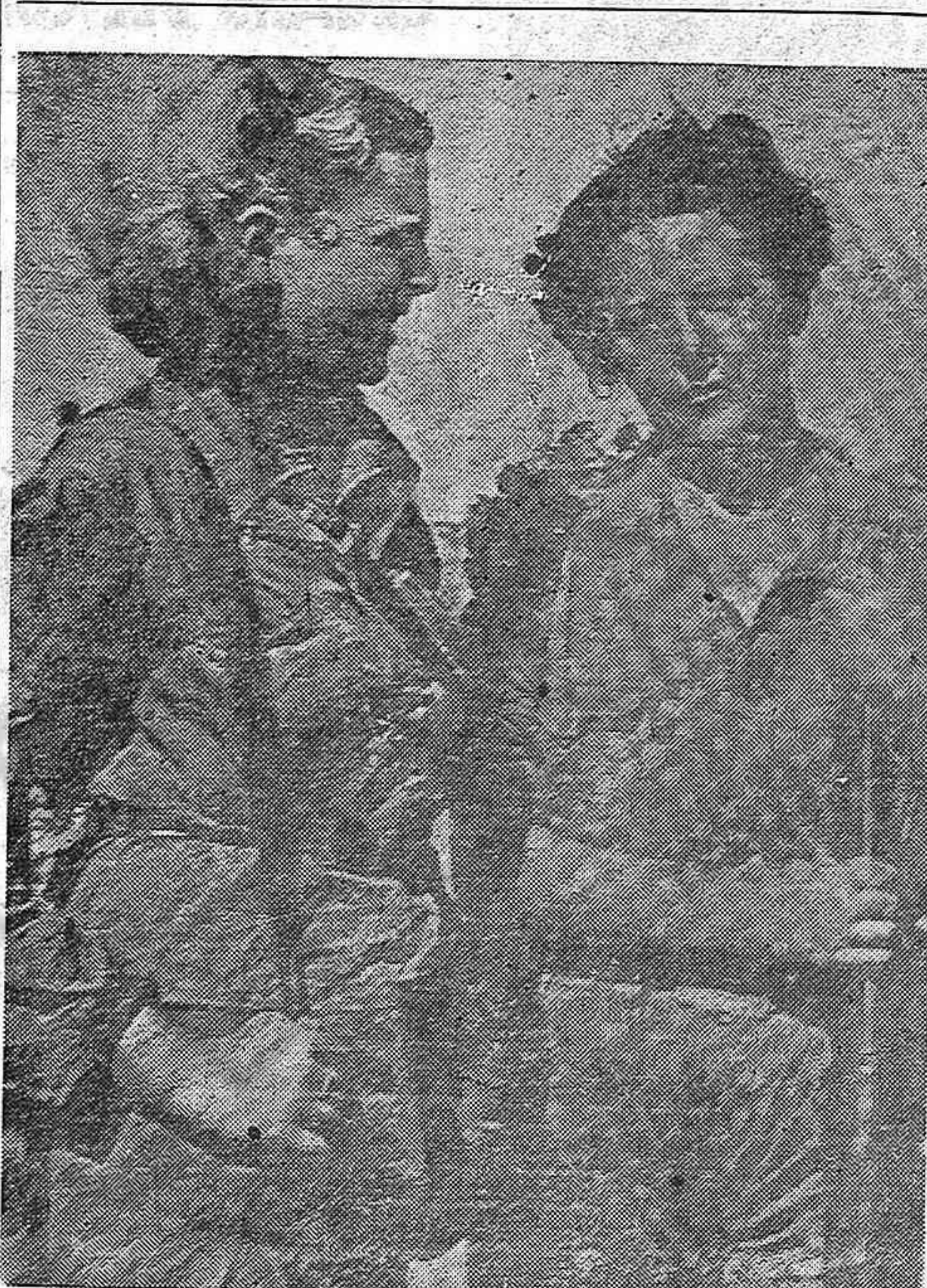
No solo en la retaguardia combatió la mujer española, contra la República. En los primeros momentos ella también marchó a los frentes o ejerció funciones de vigilancia. Olga Anton nos describe en su artículo uno de los aspectos de la obra de la mujer.