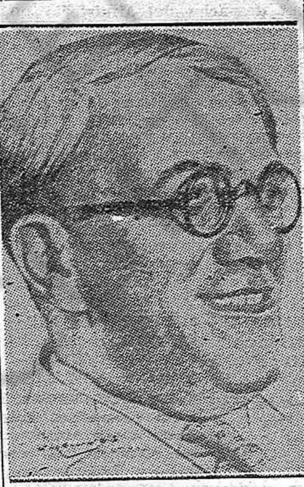
Alvarez del Vayo, Ministro de la República, autor de un interesante libro que ya ha aparecido