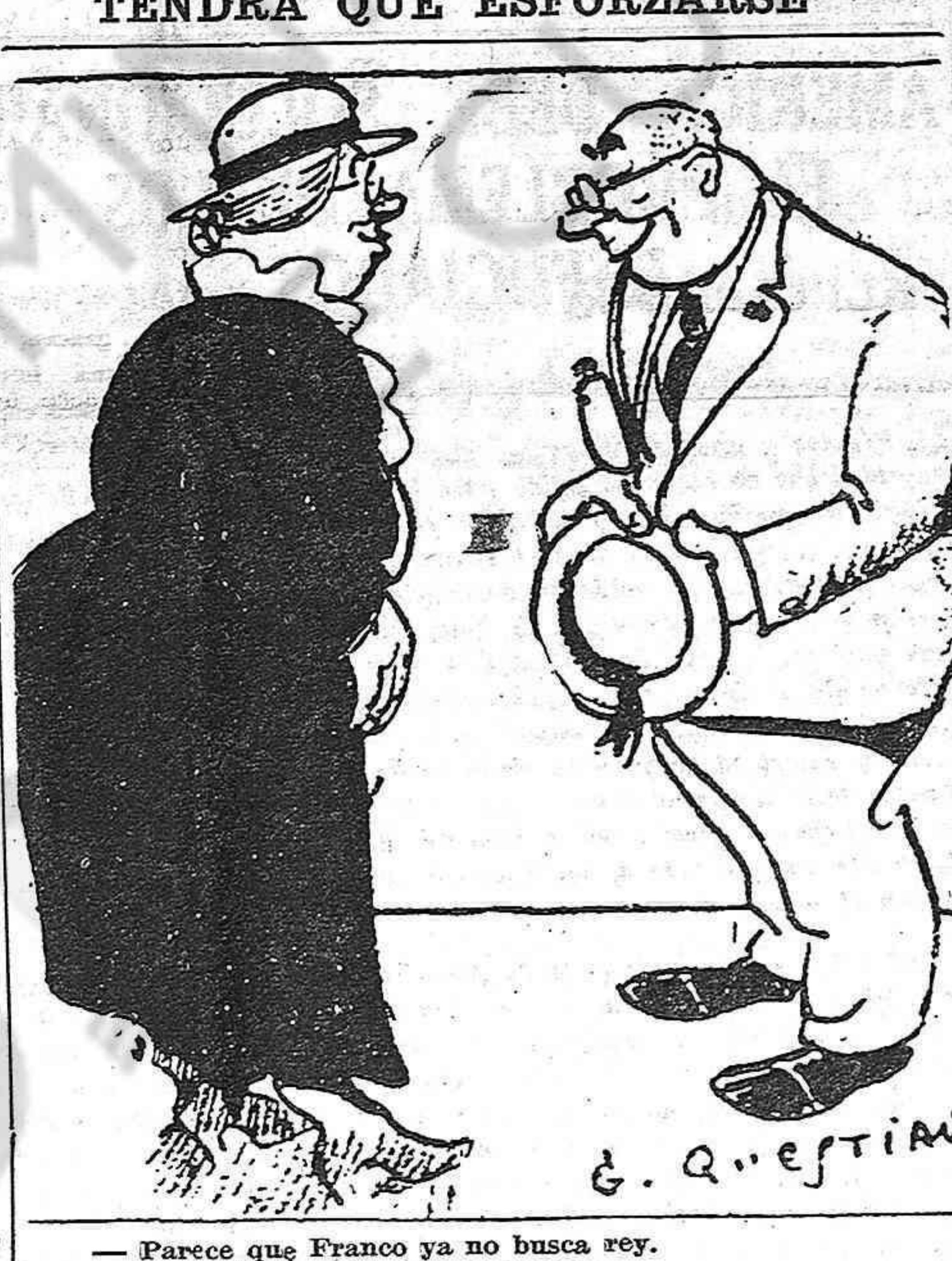
— Parece que Franco ya no busca rey. — Bastante hará él si logra escapar.

CONCLUSIONES Primero: La Conferencia Panamericana d eayuda a los refugiados españoles propone que estos sean libremente admitidos en los países americanos y objeto de los beneficios de la nacionalidad; tanto por razones de consanguinidad, como de mantenimiento de los países acorcedores de su tradición de hospitalidad y de la utilidad que consiguen en el aumento de población calificada, homogénea, e inmediatamente asimilable. Segundo: En caso de que momentáneamente se crea necesaria diferir el beneficio de la concesión de la nacionalidad, la conferencia sugiere para los refugiados españoles en cada país, un régimen similar al que en Mé-