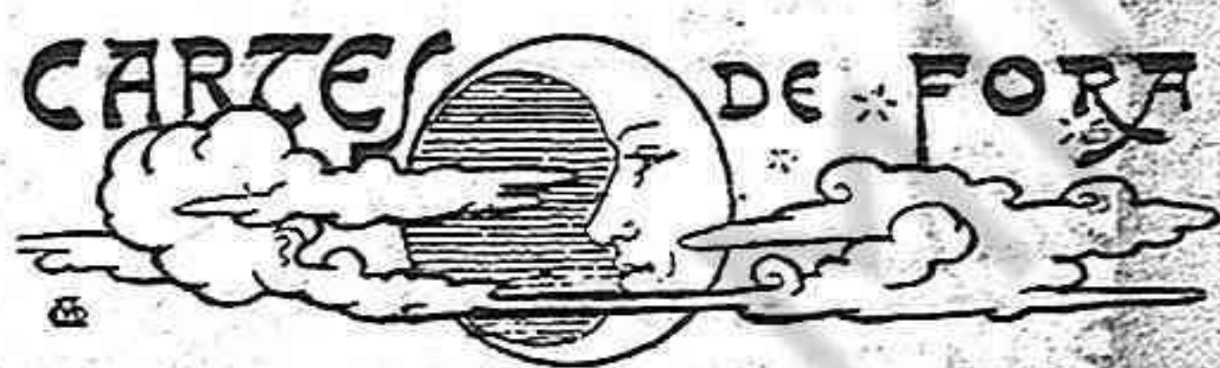
OLOT, 3 de Janer

Ab que se'ls apujin les contribucions o se'ls hi birli l'acta, n'hi ha més que suficient.