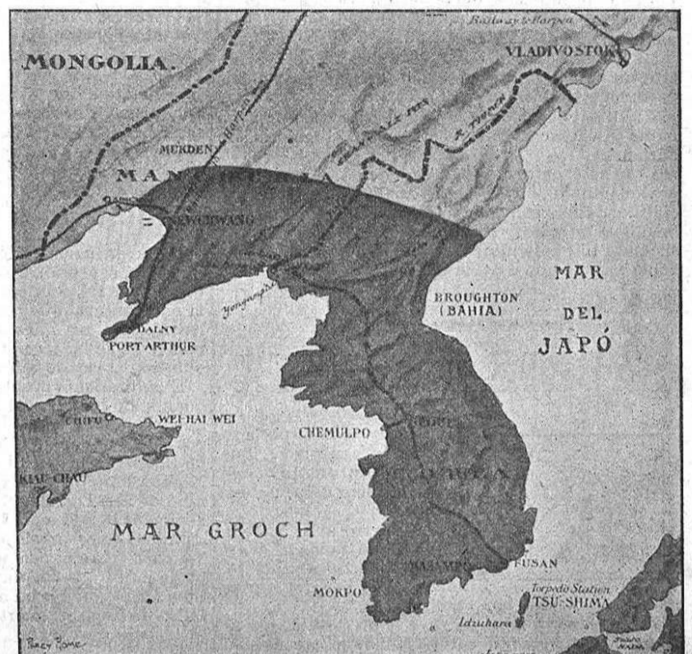
Mapa de Port-Arthur, ab la Corea y la Mandxuria.