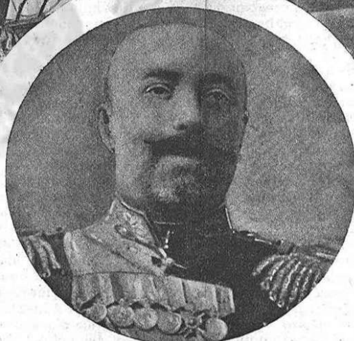
El general STOESEL jefe de la plassa sitiada.