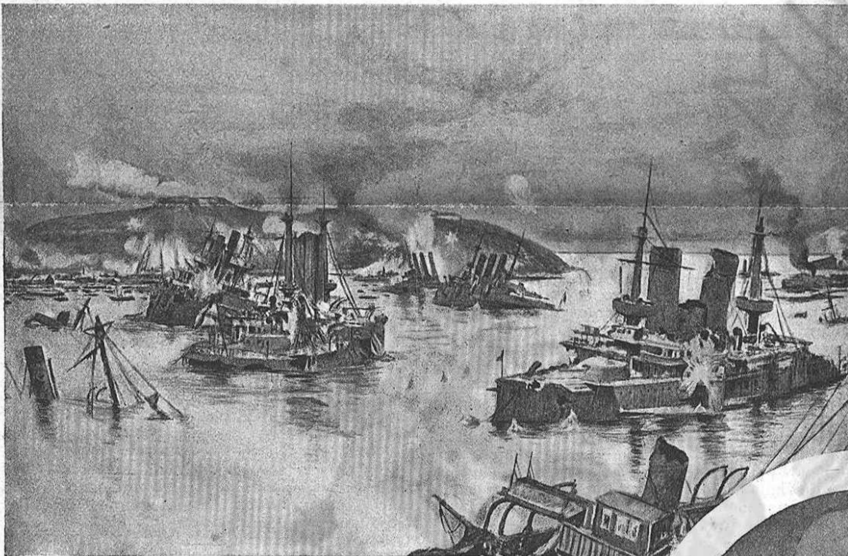
Dintre de Port-Arthur

Ultims moments y destrucció final de la esquadra russa.