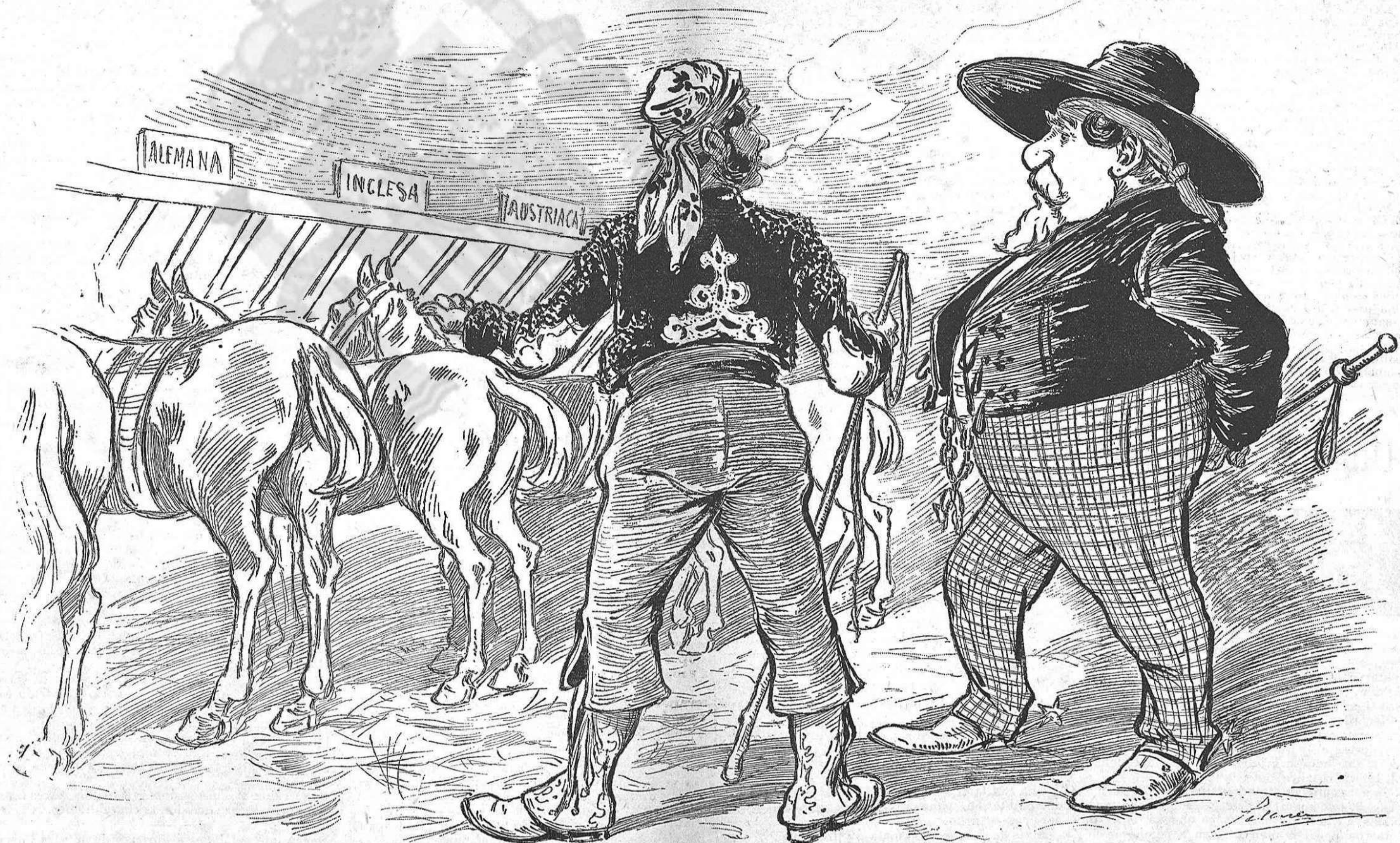
—Vea V., don Marcelo, zi le conviene arguna. Hay inglesas, alemanas, normandas, rusas....