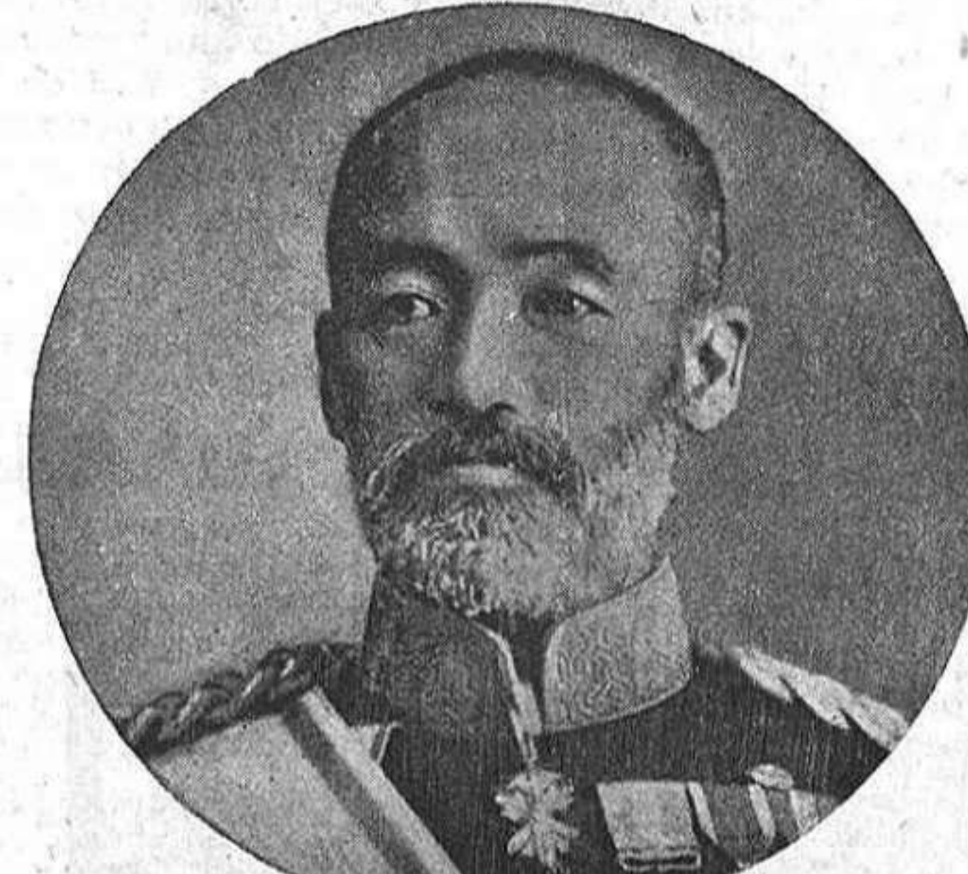
El general NOGI jefe de las forsas sitiadoras.