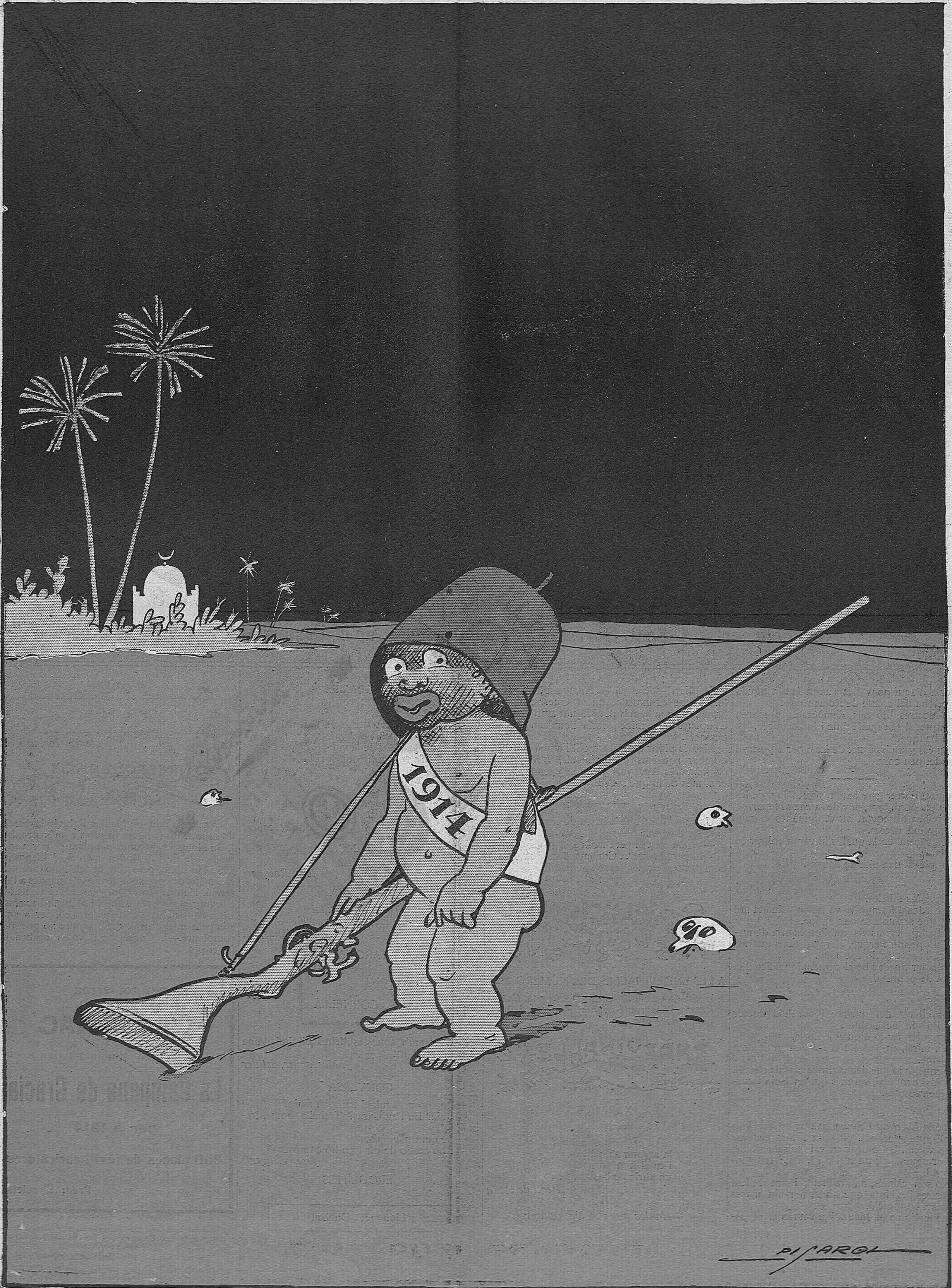
«Any nou... vida vella»